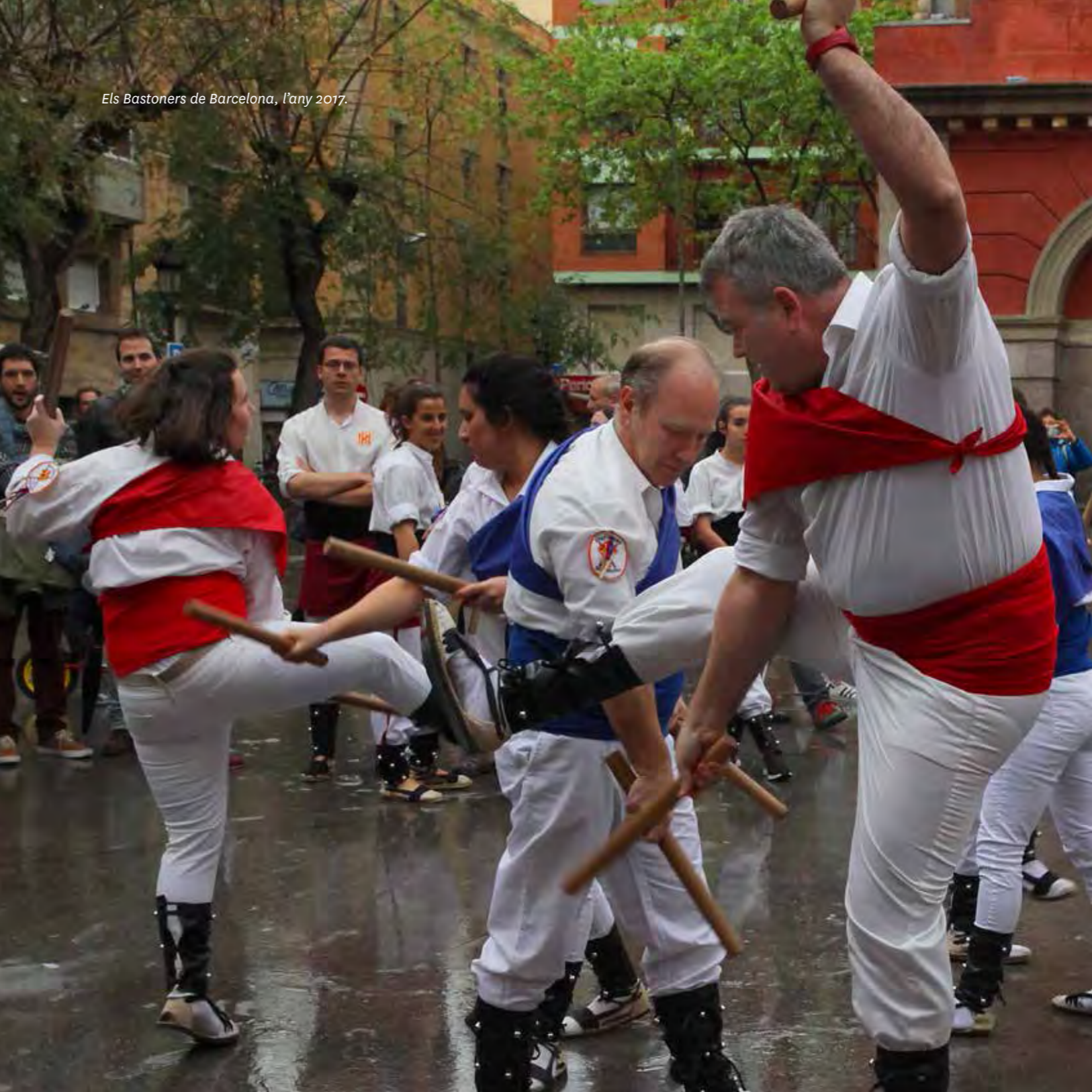
Els Bastoners de Barcelona, l'any 2017.