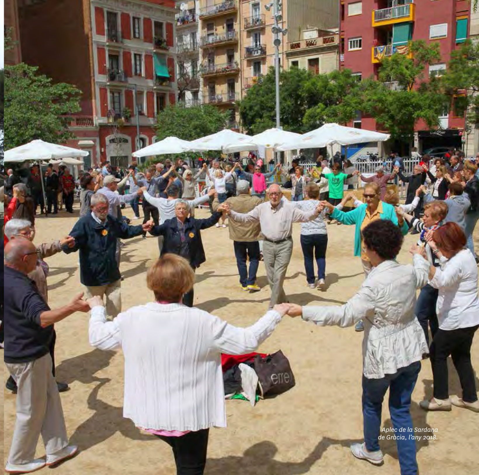
Aplec de la Sardana de Gràcia, l'any 2018.