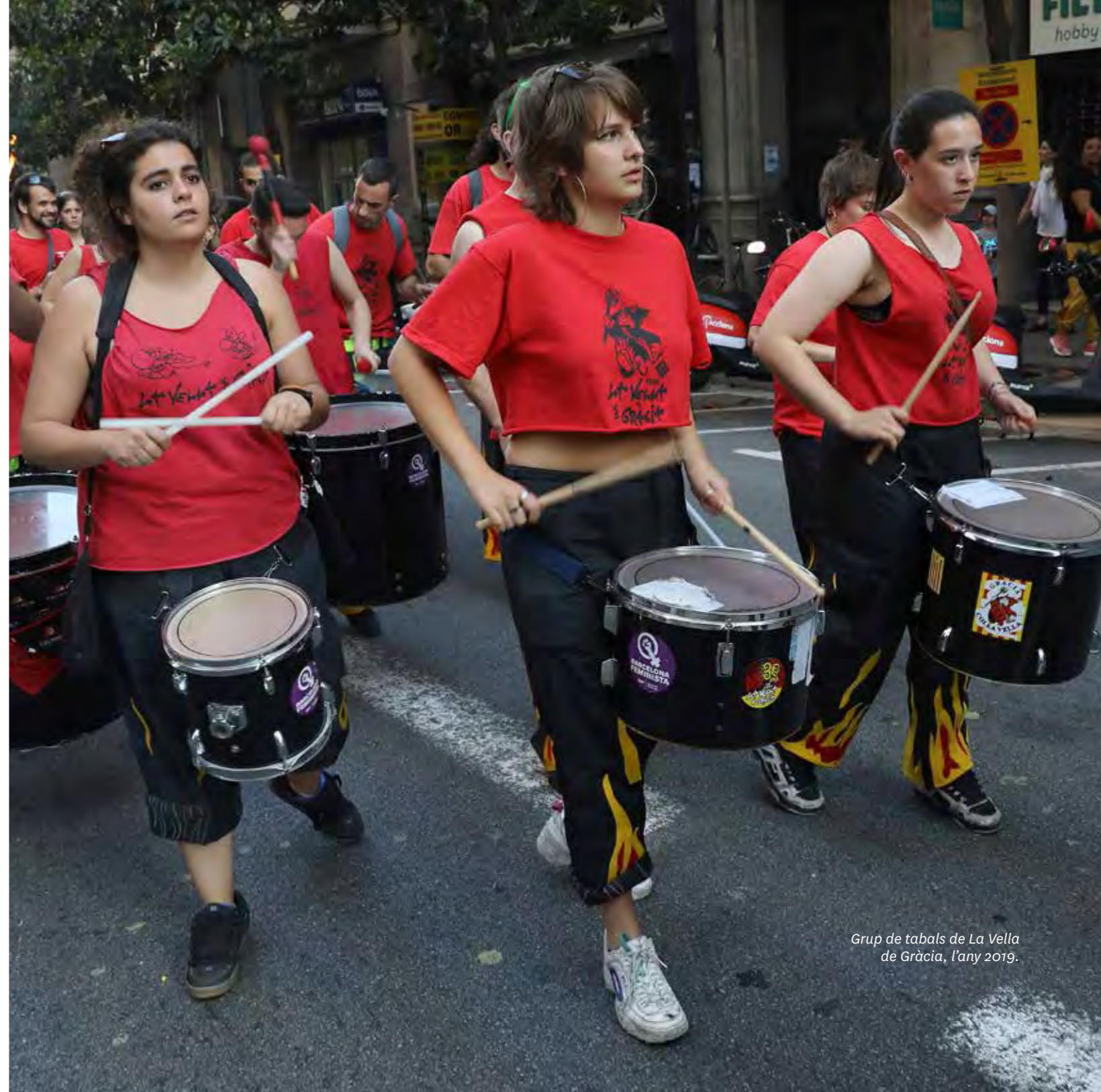
Grup de tabals de La Vella de Gràcia, l'any 2019.