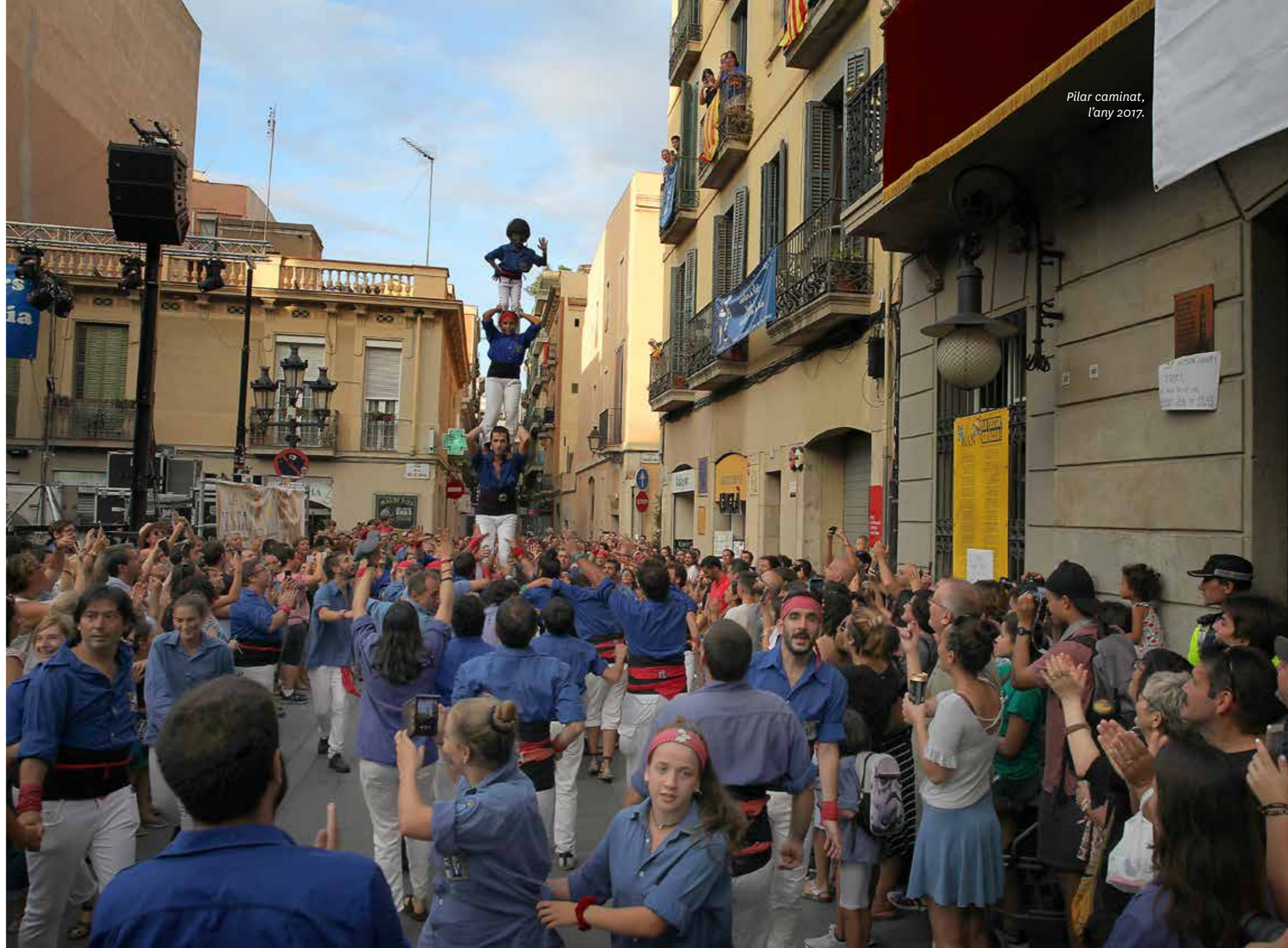
Pilar caminat, l'any 2017.

A la plaça del Sol, a la cantonada del carrer dels Xiquets de Valls amb el carrer de Maspons, s'aixeca un pilar de quatre. Aleshores, aquest pilar inicia el recorregut cap al carrer dels Xiquets de Valls i el carrer de Mariana Pineda, entra a la plaça de la Vila de Gràcia i acaba davant de la seu del Districte de Gràcia, després de fer la corba de la cantonada del carrer del Diluvi amb el de Francesc Giner. Mentre es fa el pilar caminat, les gralles i els tabals toquen el Pilar caminat . L'hora d'inici és a les vuit del vespre.