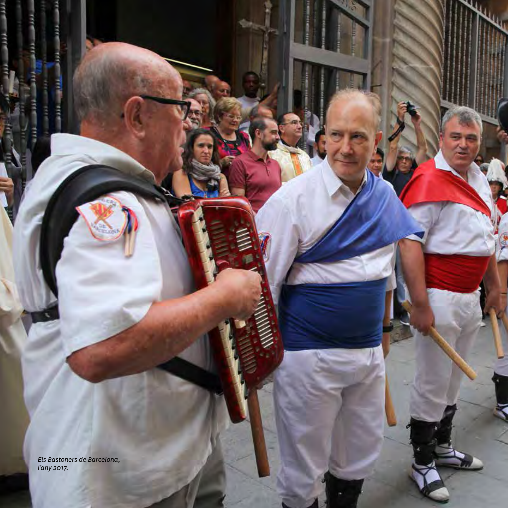
Els Bastoners de Barcelona, l'any 2017.