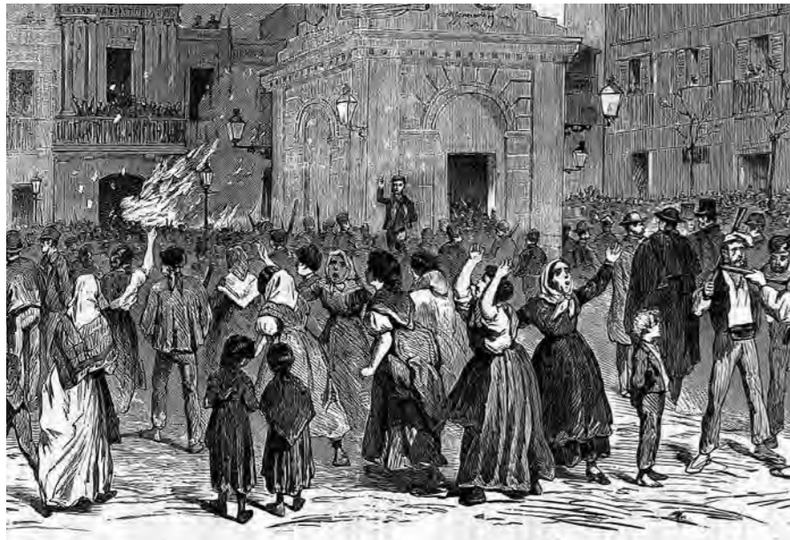
La Revolta de les Quintes de 1870.

La celebració de la Revolta de les Quintes té la distinció dels Premis Vila de Gràcia.