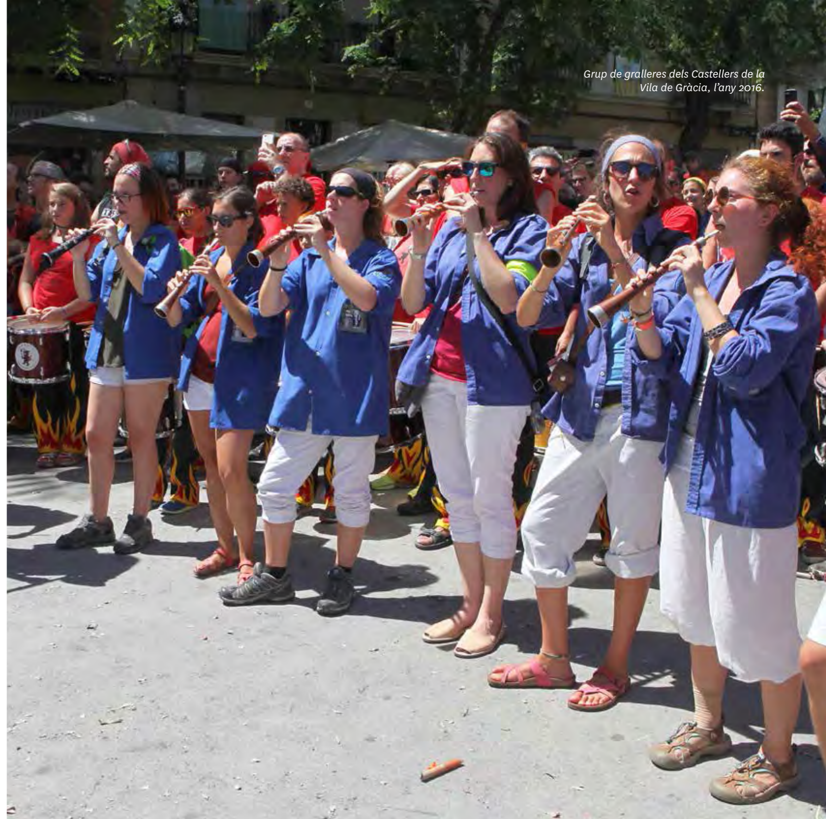
Grup de gralleres dels Castellars de la Vila de Gràcia, l'any 2016.