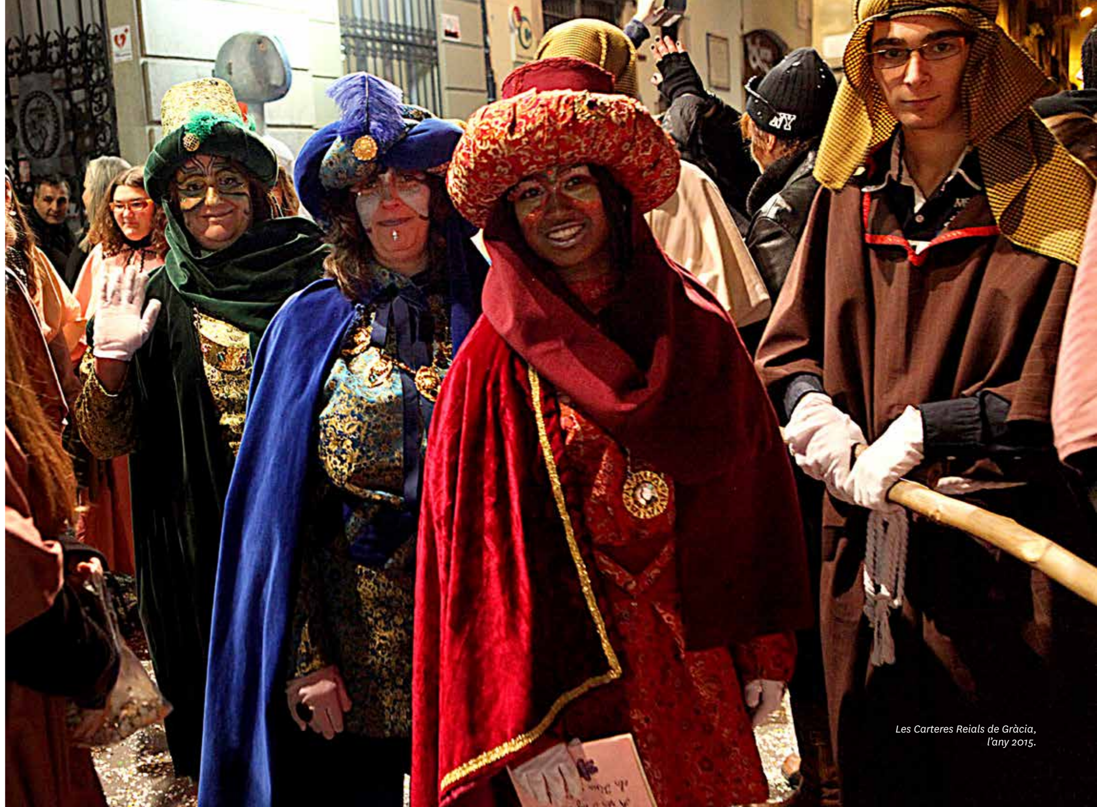
Les Carteres Reials de Gràcia, l'any 2015.

La Cavalcada recorre diferents carrers de Gràcia i acaba a la plaça de la Vila, on les Carteres Reials de Ses Majestats els Reis d'Orient, arribades amb carruatges de cavalls ornamentats, surten al balcó de l'Ajuntament mentre s'escolta El Messies de Händel i des del campanar cau una pluja de paperets. Les Carteres Reials fan un breu parlament i després, en un tendal instal·lat a la plaça, reben les cartes dels infants.