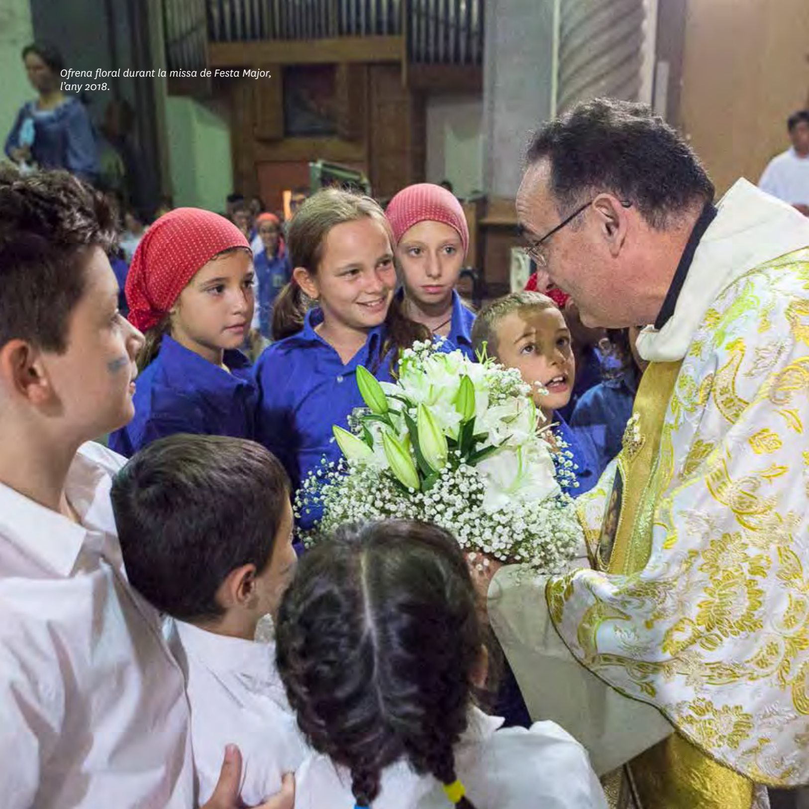
Ofrena floral durant la missa de Festa Major, l'any 2018.

La cultura és la forma cabdal de les relacions socials. Cada persona està integrada en registres diferents. La cultura no és un mosaic, sinó un calidoscopi que conté tot el que hi ha a la vida.