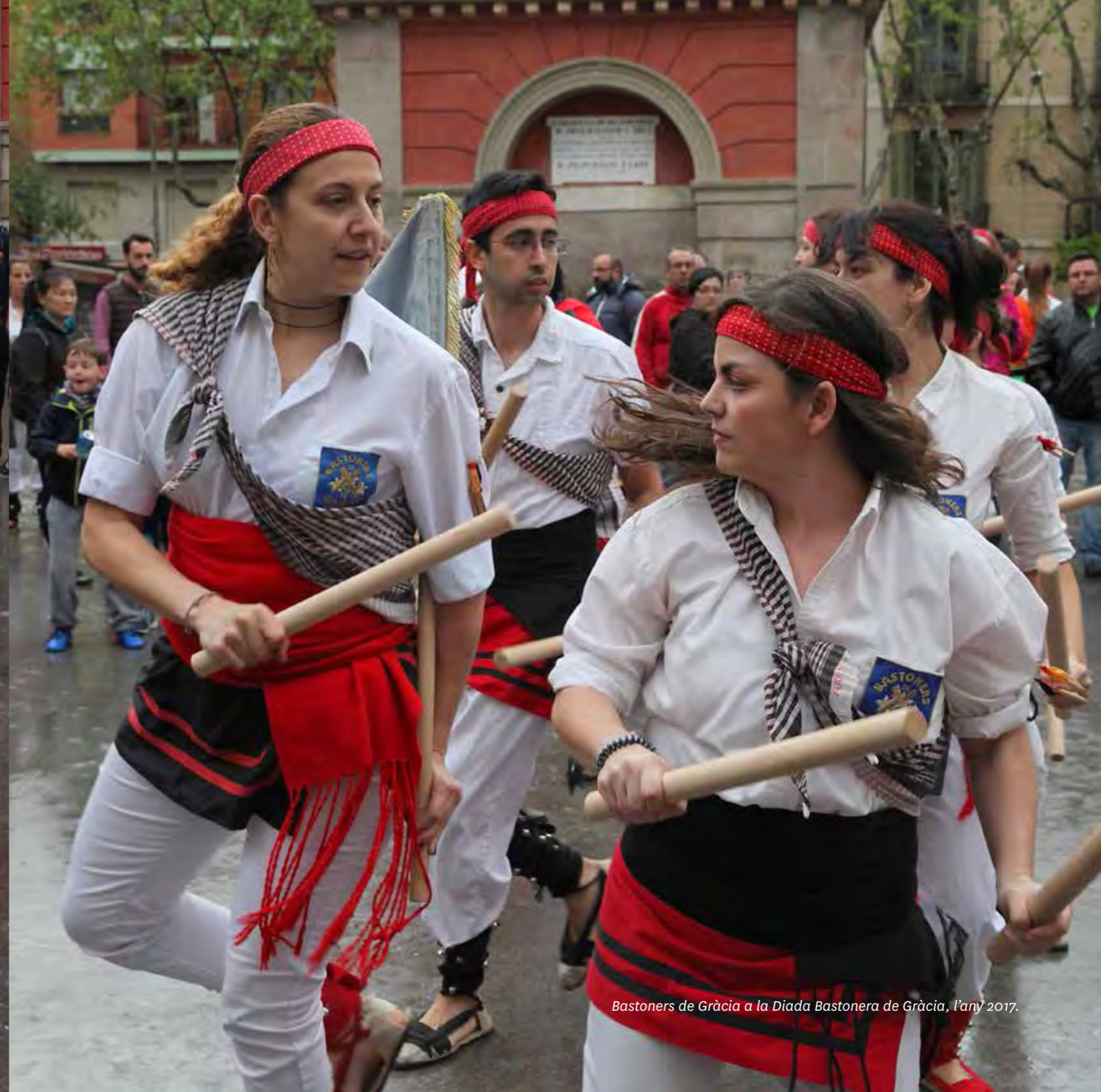
Bastoners de Gràcia a la Diada Bastonera de Gràcia, l'any 2017.