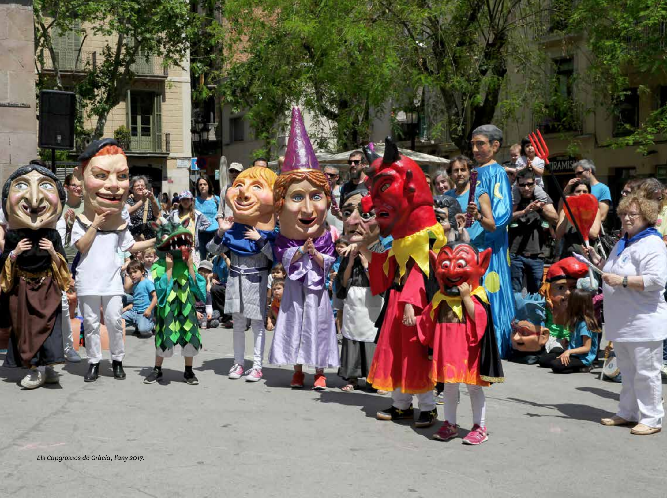
Els Capgrossos de Gràcia, l'any 2017.