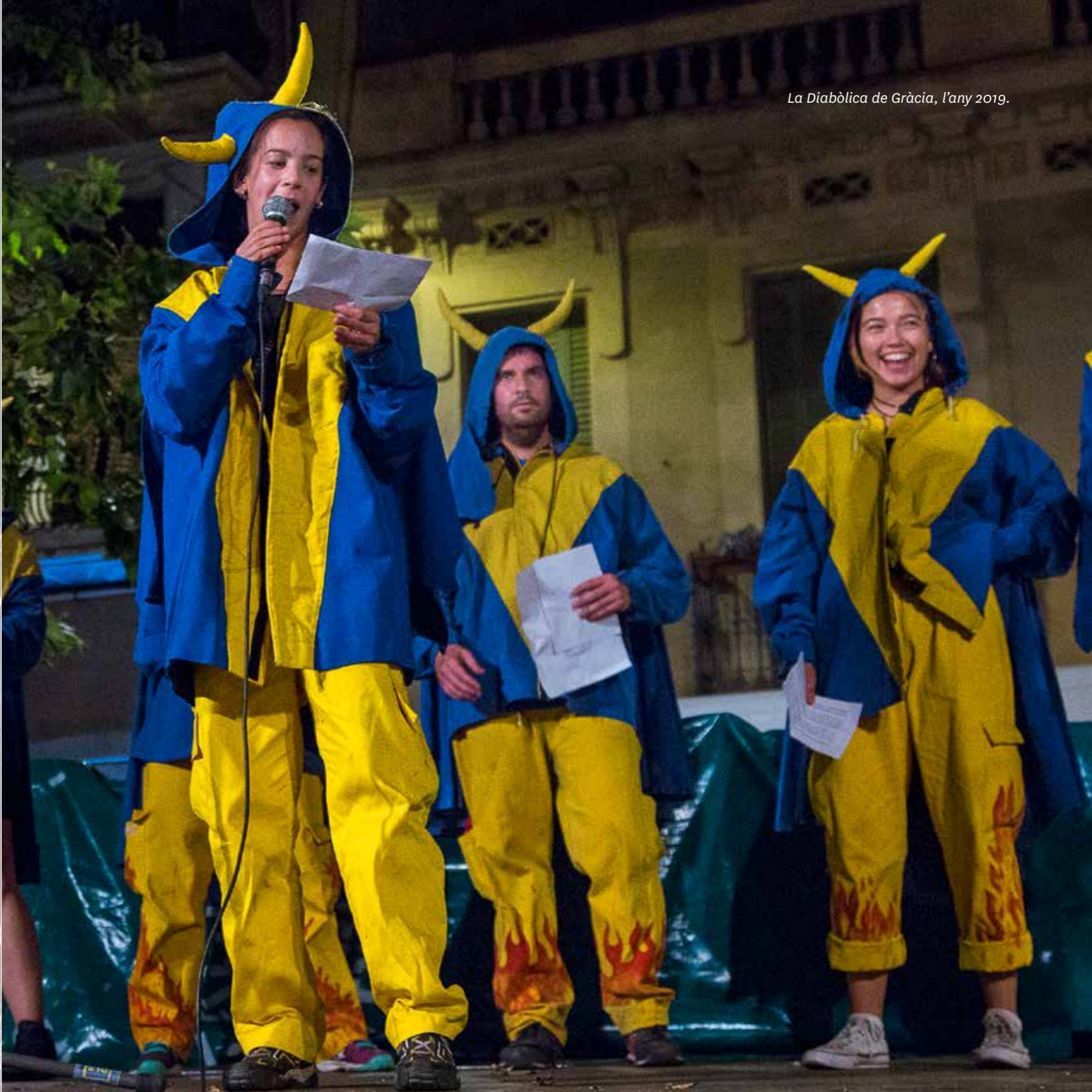
La Diabòlica de Gràcia, l'any 2019.