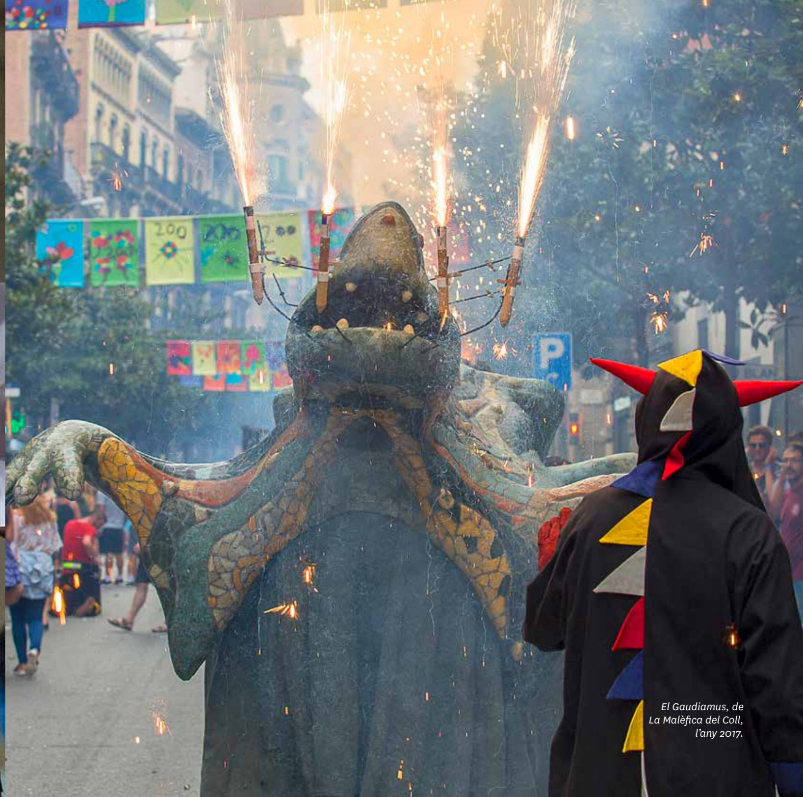
El Gaudiamus, de La Malèfica del Coll, l'any 2017.