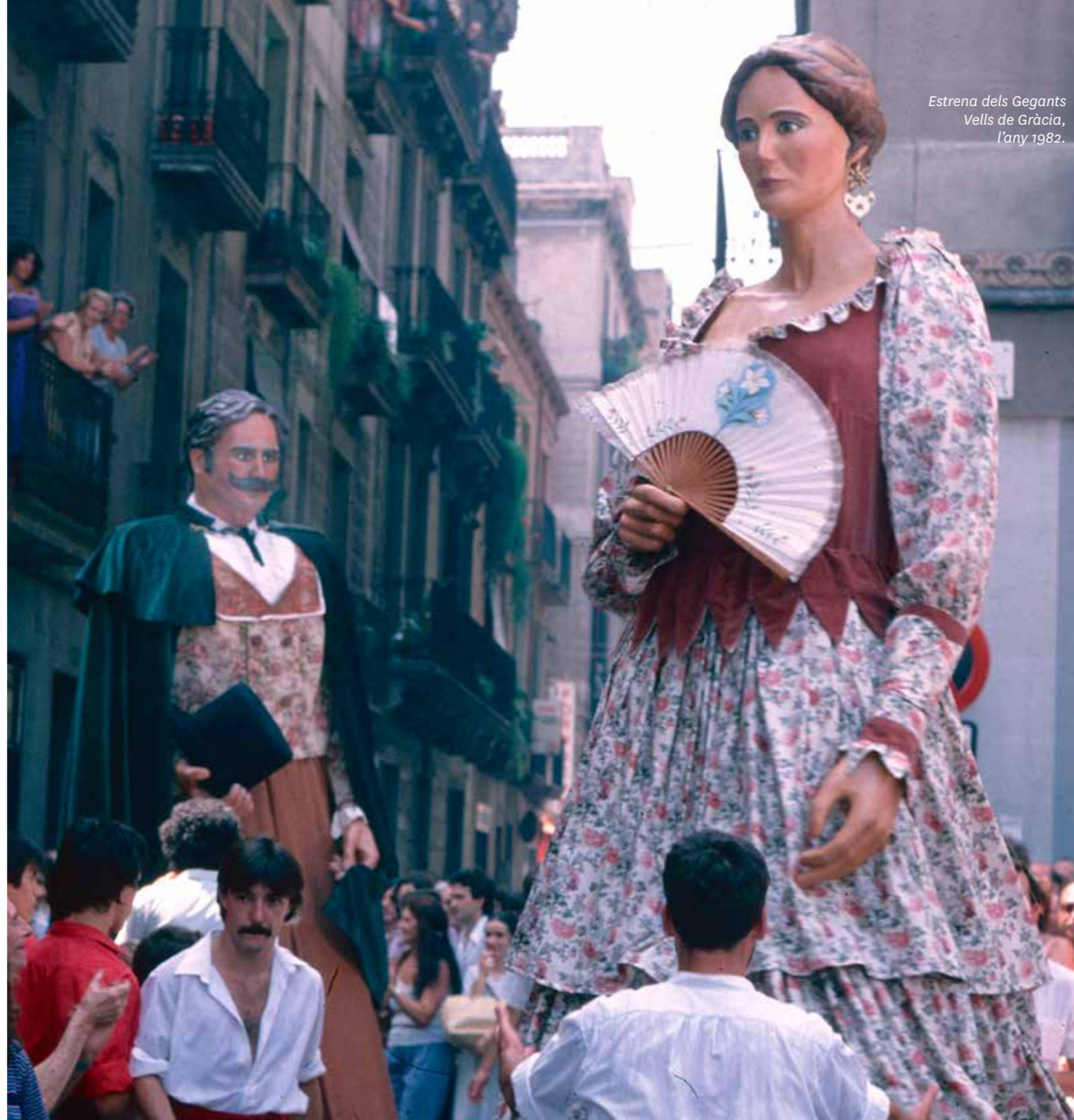
Estrena dels Gegants Vells de Gràcia, l'any 1982.