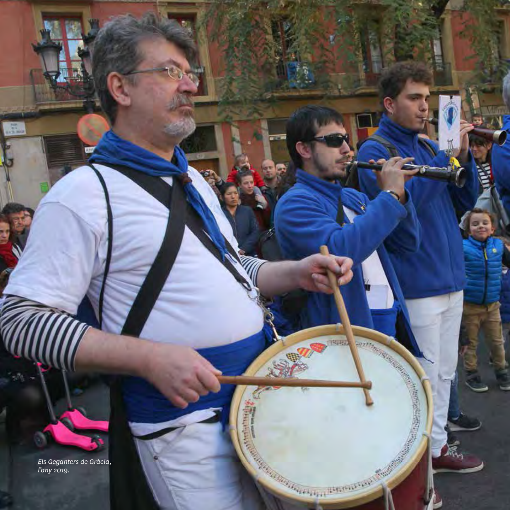
Els Geganters de Gràcia, l'any 2019.