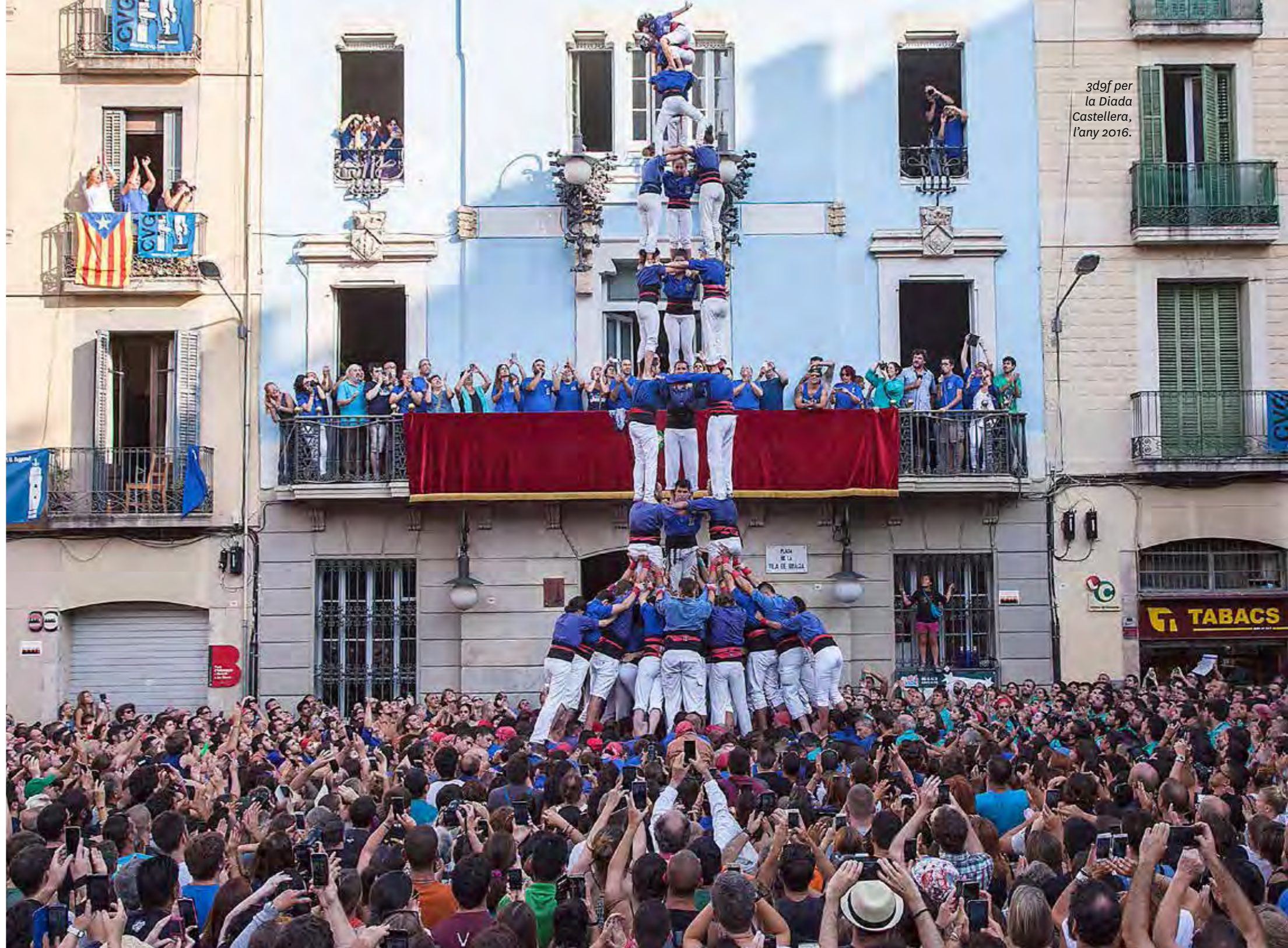
3d9f per la Diada Castellera, l'any 2016.

plaça . L'actuació es desenvolupa de la manera següent: tres rondes de castells i una de pilars, després els Castellers de la Vila de Gràcia carreguen un pilar al balcó del Districte. A part dels Castellers de la Vila de Gràcia, hi participen dues colles convidades. Durant els castells sona el Toc de castells , excepte per al pilar del balcó, per al qual es toca Pilar al balcó . L'actuació s'acaba quan els grallers i els tabalers interpreten el Toc de vermut .