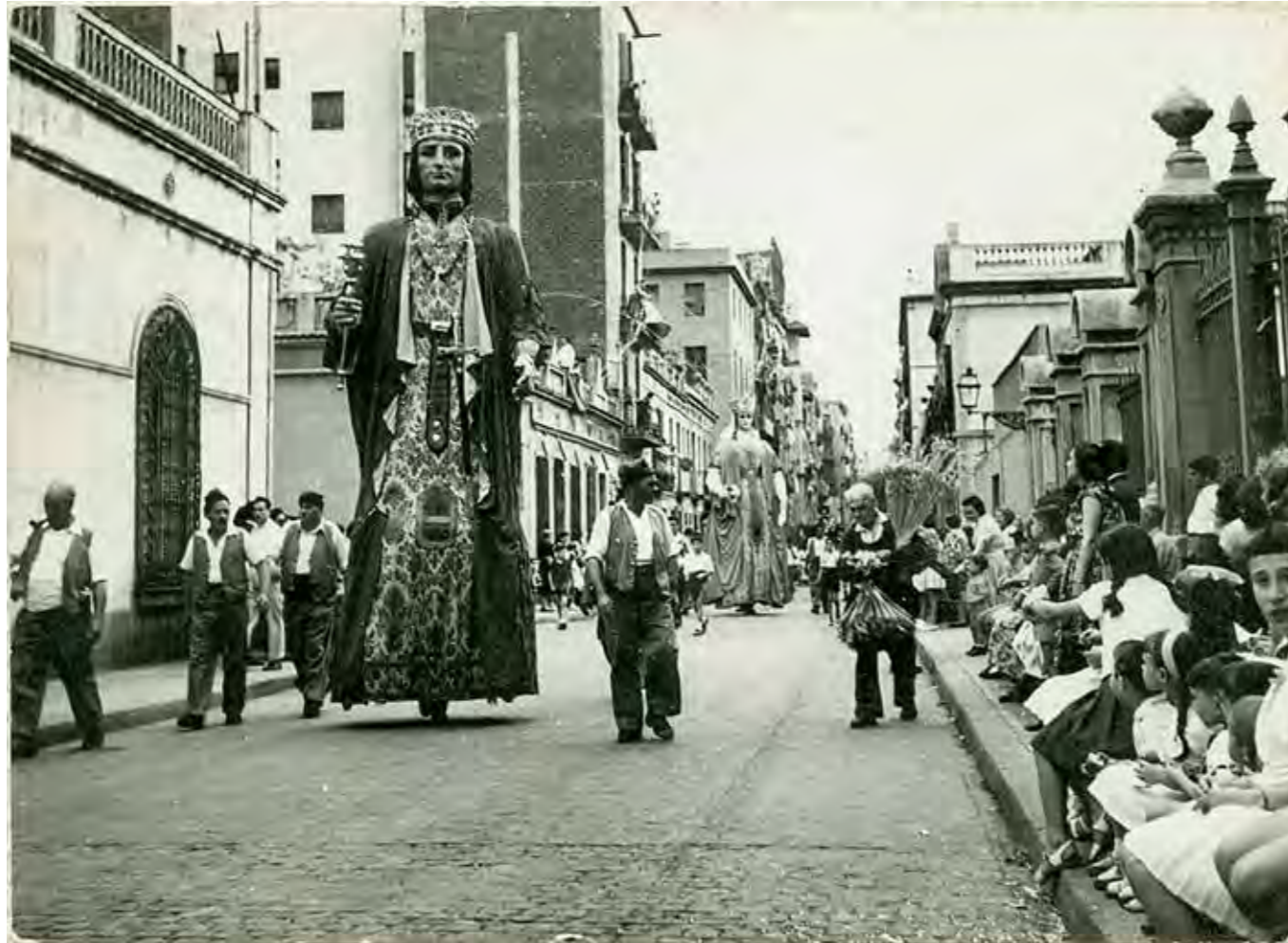
La Processó de Corpus, a l'altura del carrer de l'Encarnació amb el de Montmany, l'any 1952.

El primer Protocol Festiu de Gràcia es va aprovar en el Plenari del Districte el 23 de gener de 2007. Uns quants anys més tard, el 14 de març de 2011, se'n va aprovar la primera revisió, després que s'hagués treballat durant molts mesos en la Comissió de Seguiment del Protocol Festiu de Gràcia, i, així, s'establiren les bases de la cultura popular a la vila de Gràcia pel que fa a les festes, a les figures festives i als grups i colles de cultura popular.