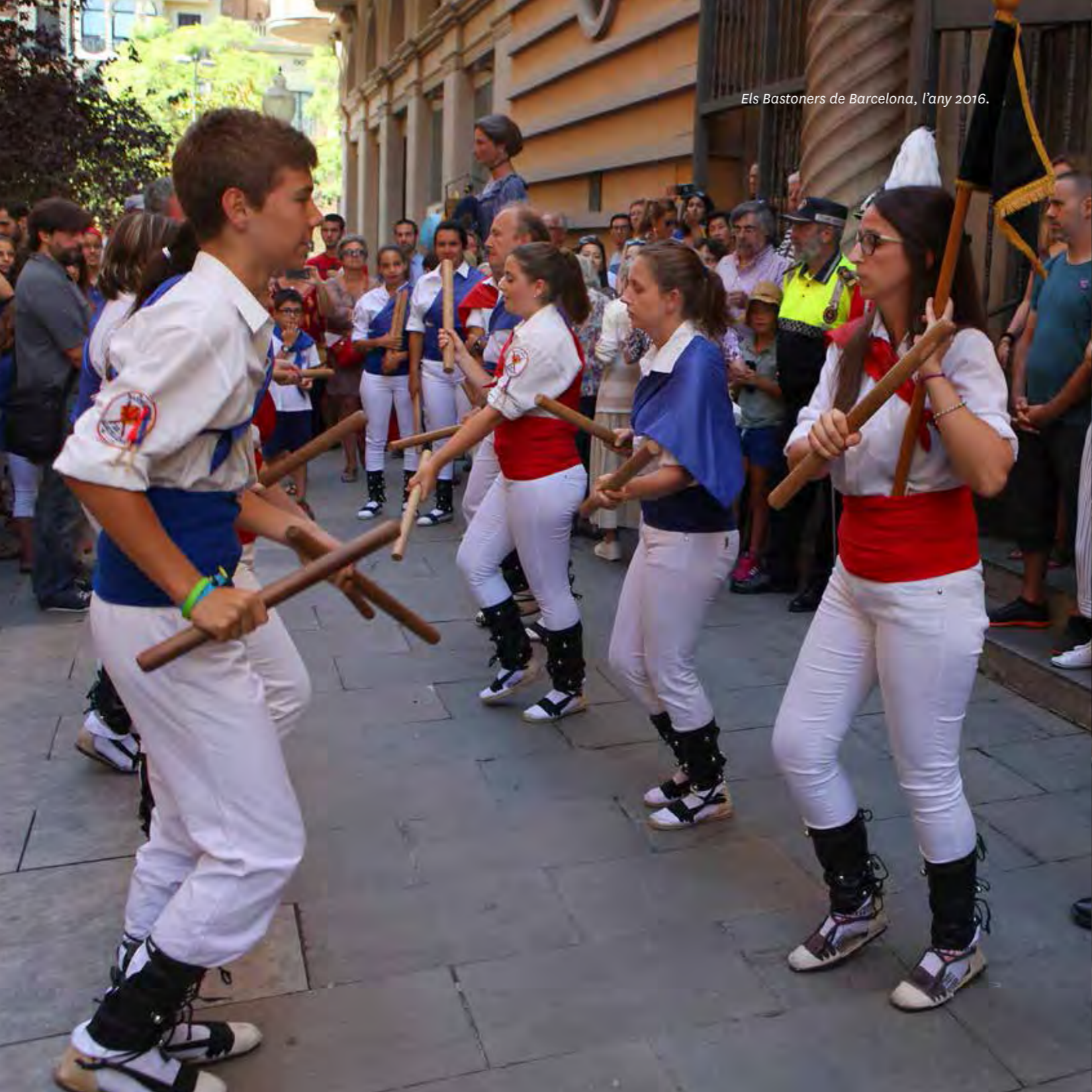
Els Bastoners de Barcelona, l'any 2016.