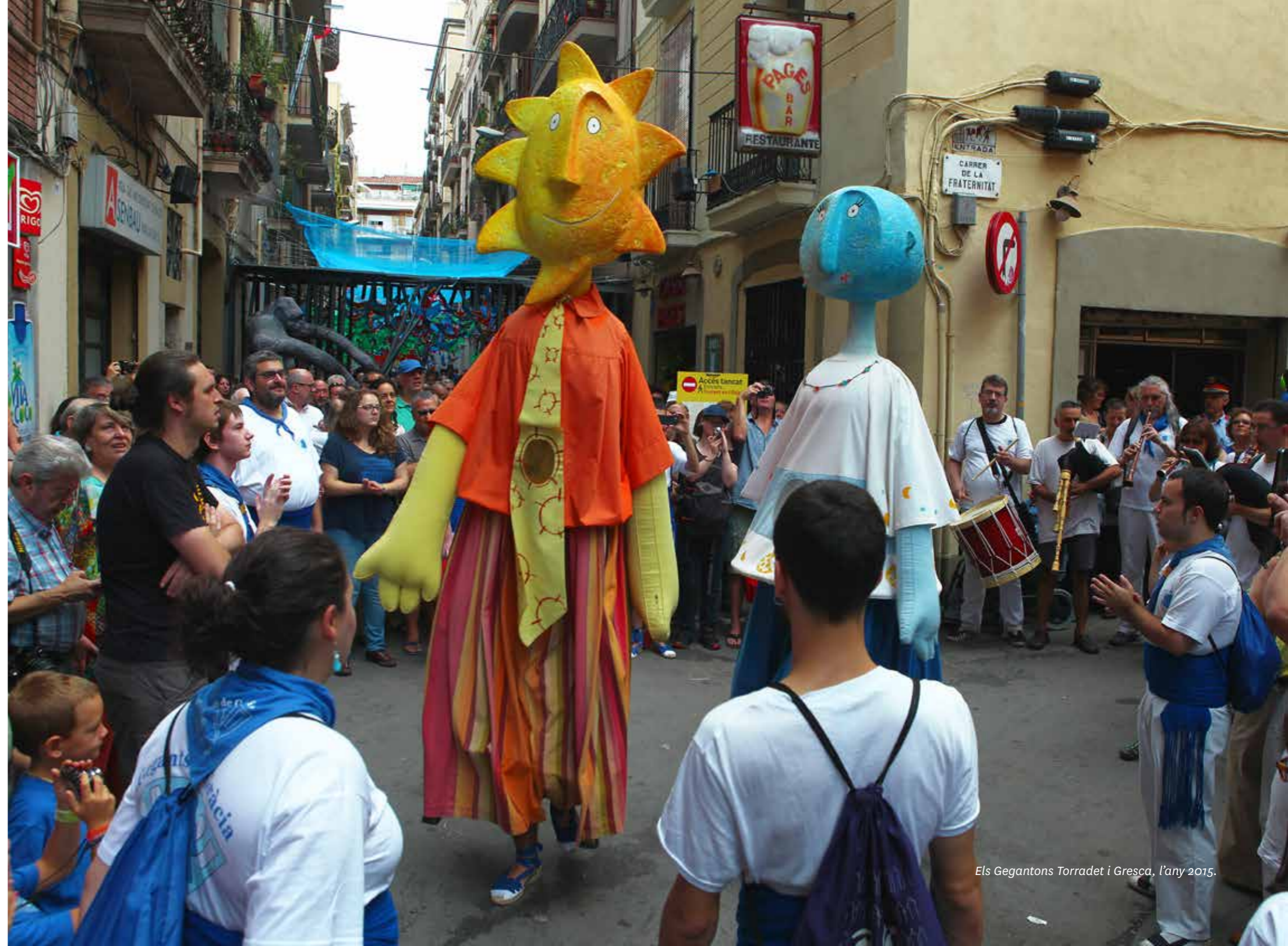
Els Gegantons Torradet i Gresca, l'any 2015.

El Torradet i la Gresca són portats per la colla dels Geganters de Gràcia.