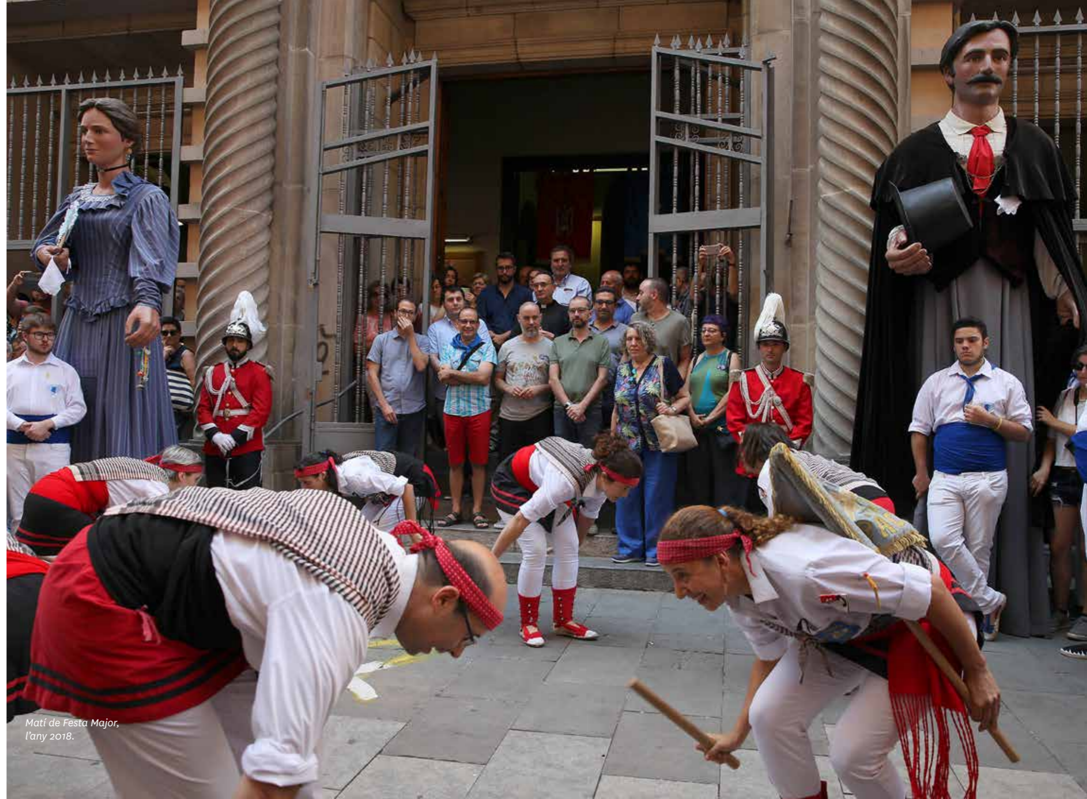
Matí de Festa Major, l'any 2018.

Es finalitza amb la interpretació de l'himne de les colles de cultura popular de Gràcia: Timbrallers .