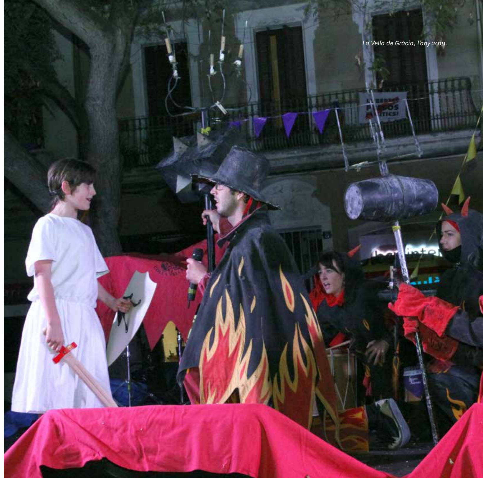
La Vella de Gràcia, l'any 2019.

Els tabalers tenen temes propis que toquen amb el tabal tradicional.