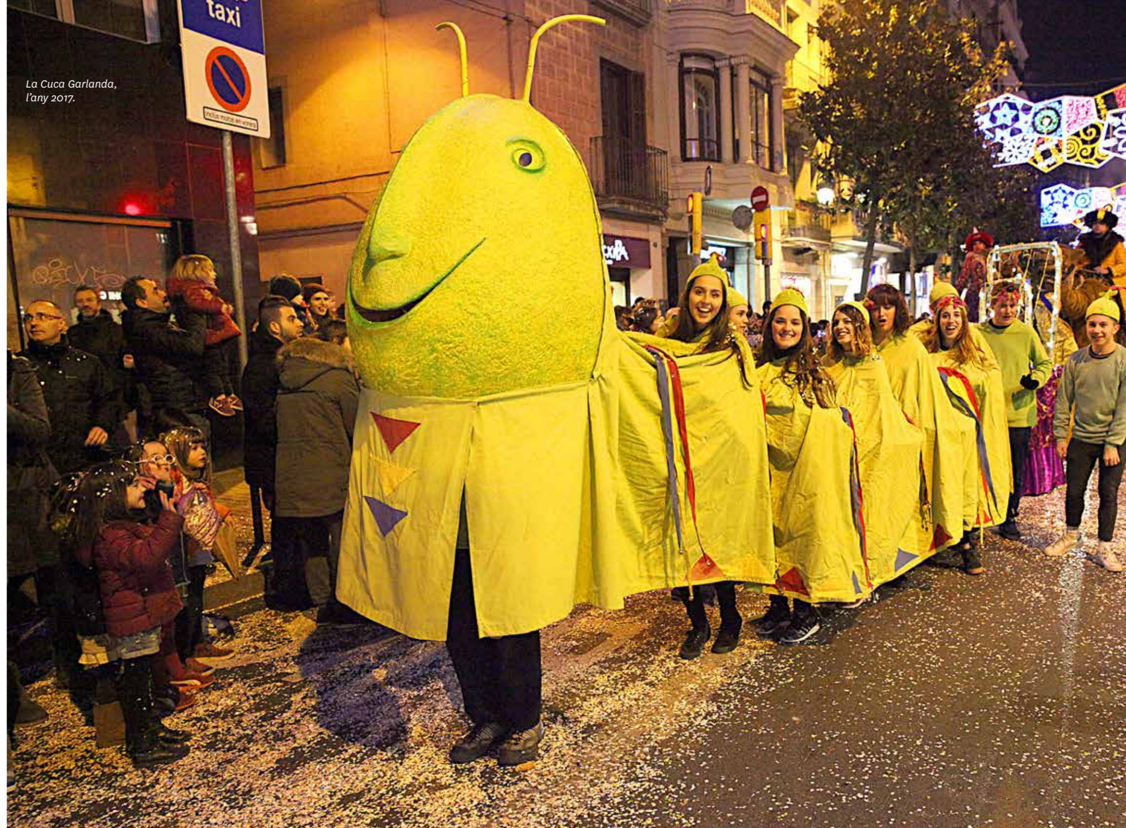
La Cuca Garlanda, l'any 2017.