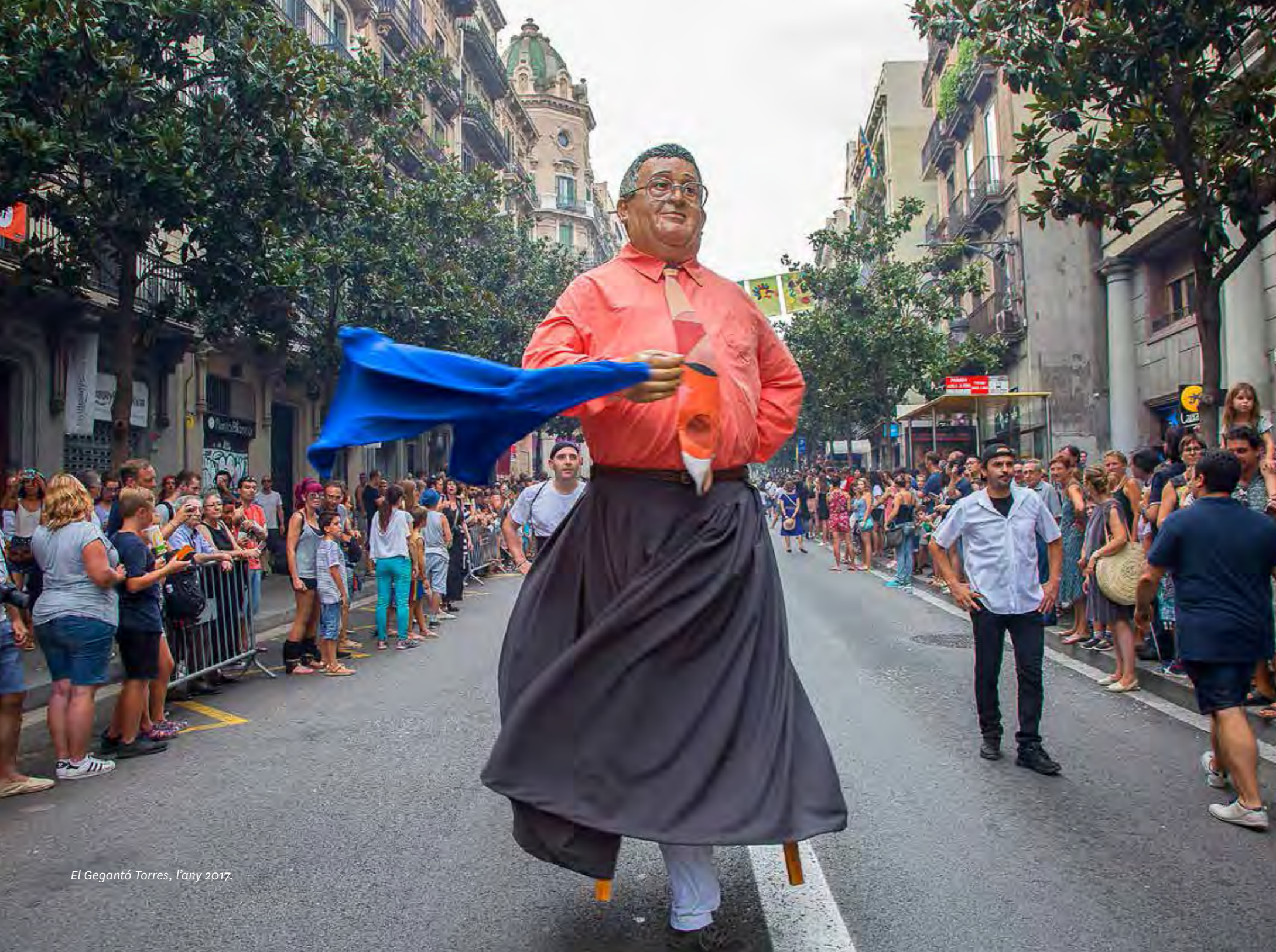
El Gegantó Torres, l'any 2017.