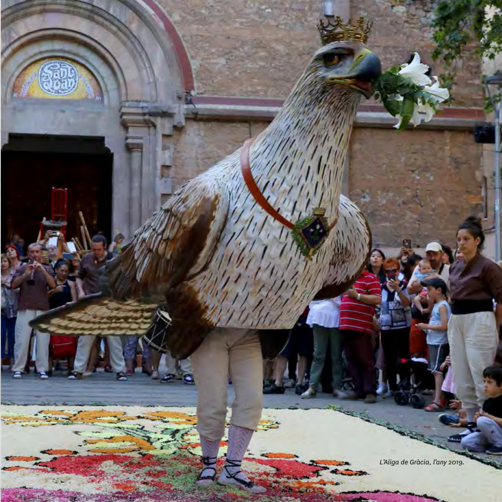
L'Aliga de Gràcia, l'any 2019.