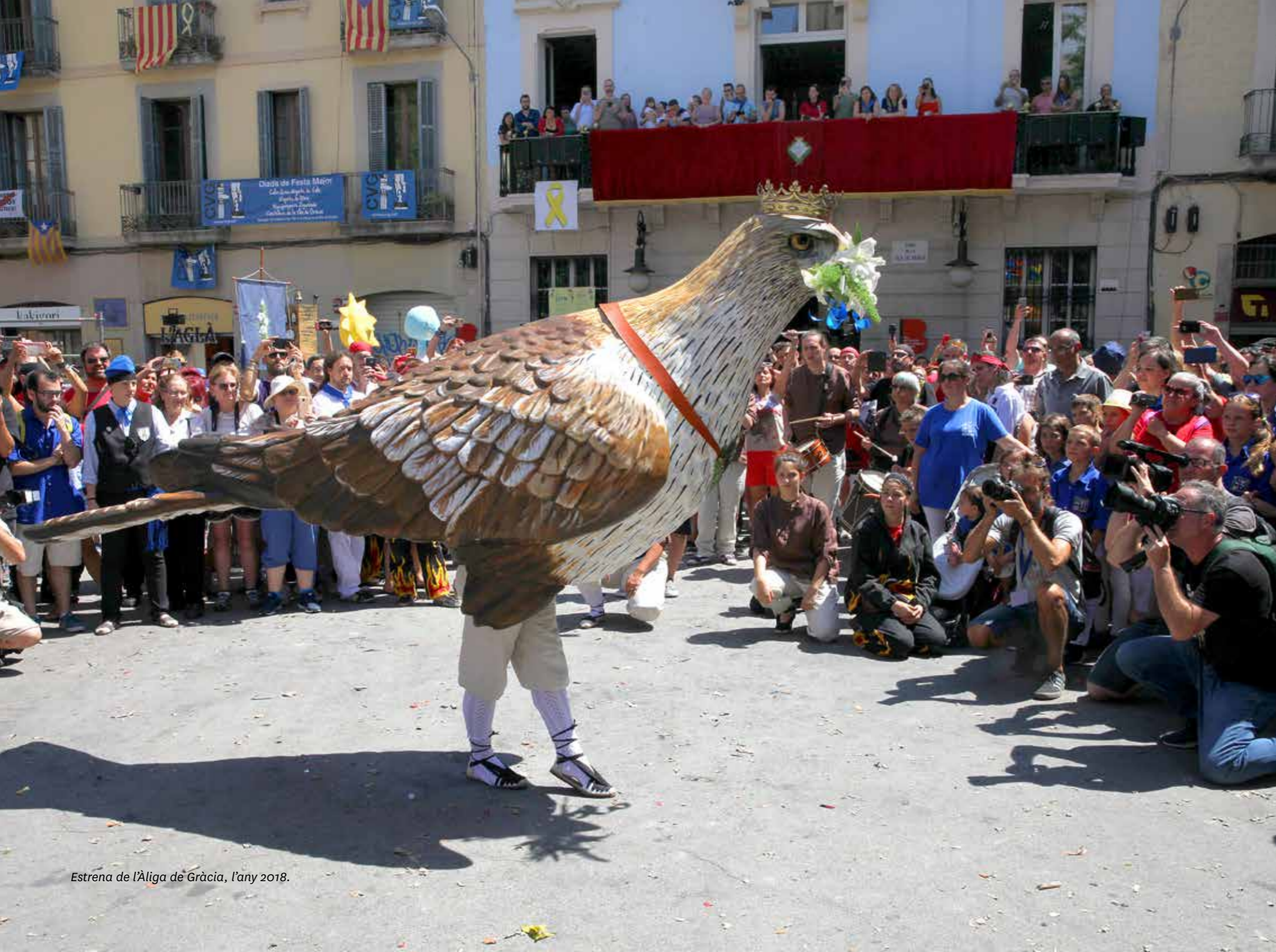
Estrena de l'Àliga de Gràcia, l'any 2018.