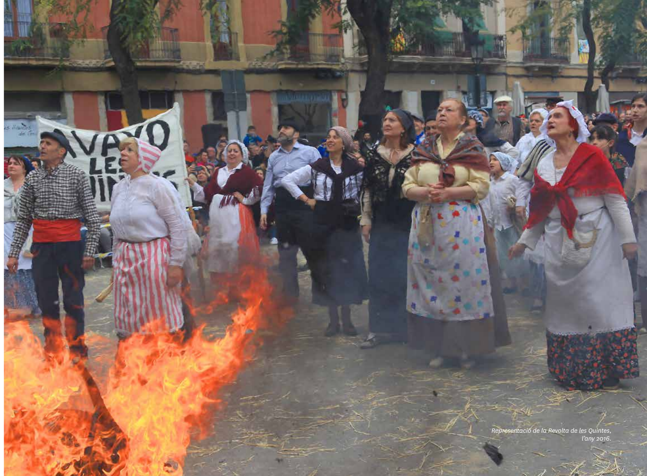
Representació de la Revolta de les Quintes, l'any 2016.