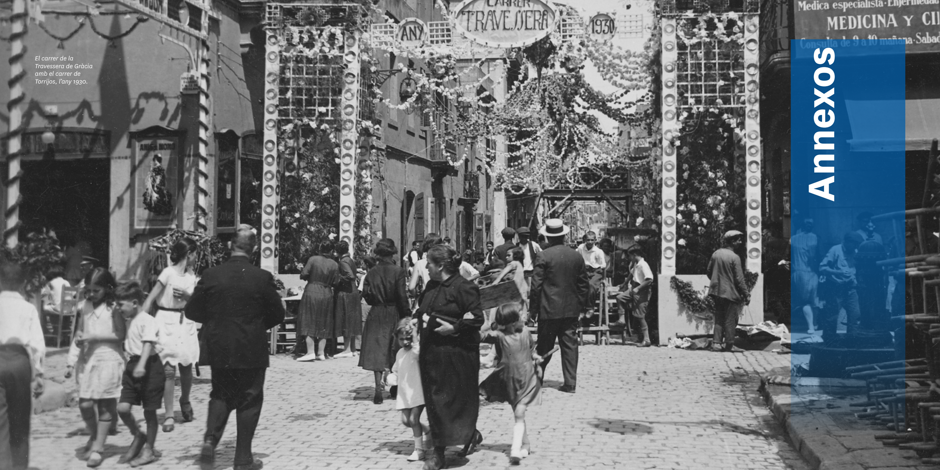
El carrer de la Travessera de Gràcia amb el carrer de Torrijos, l'any 1930.