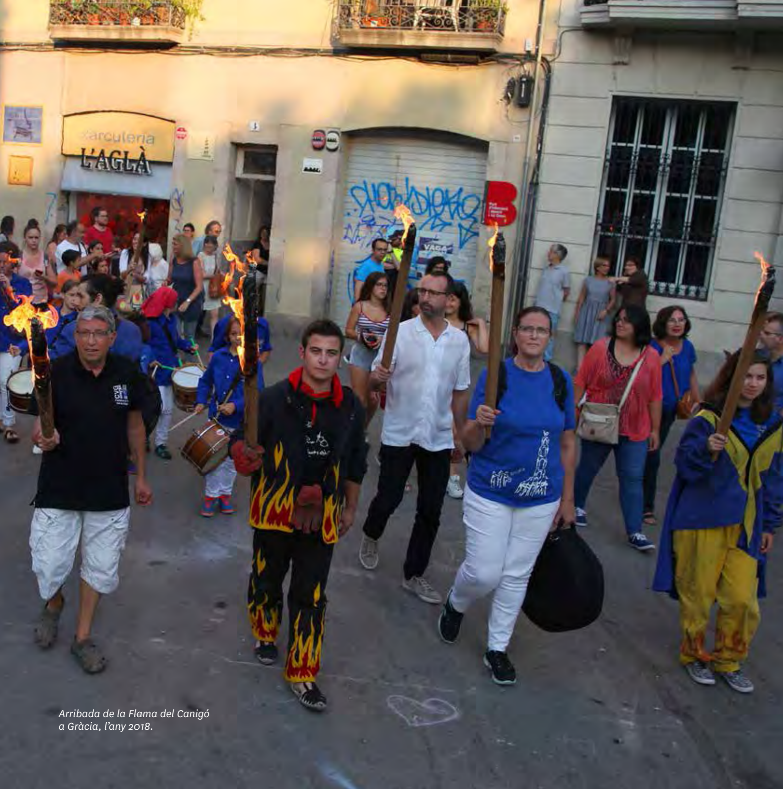
Arribada de la Flama del Canigó a Gràcia, l'any 2018.