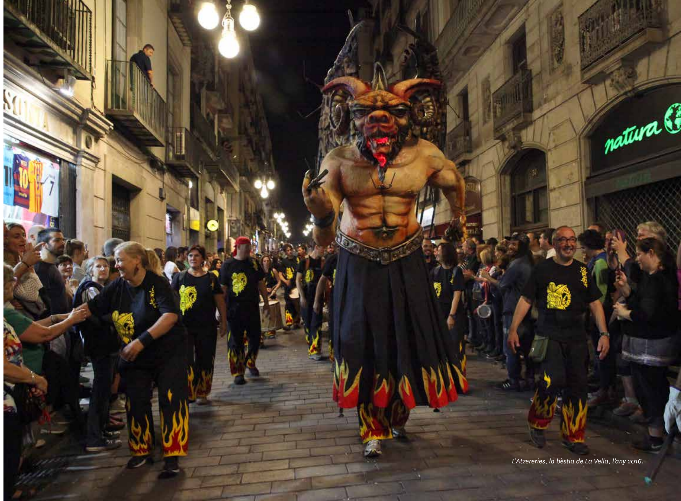
L'Atzeries, la bèstia de La Vella, l'any 2016.

Actualment, ja té tres temes propis: El ball de l'Atzeries , L'infern i Los Garrontxos , compostos per persones que formen part de la colla.