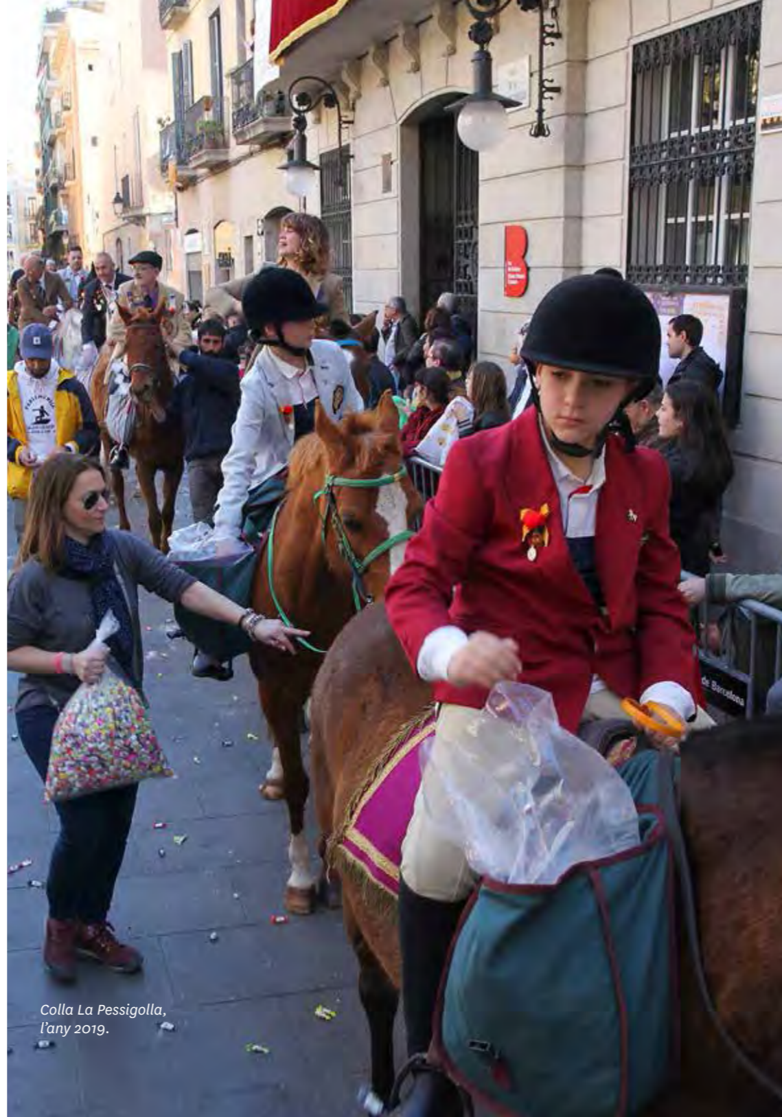
Colla La Pessigolla, l'any 2019.

La Federació de Colles de Sant Medir, amb la col·laboració de la Coordinadora de Colles de Cultura de Gràcia.