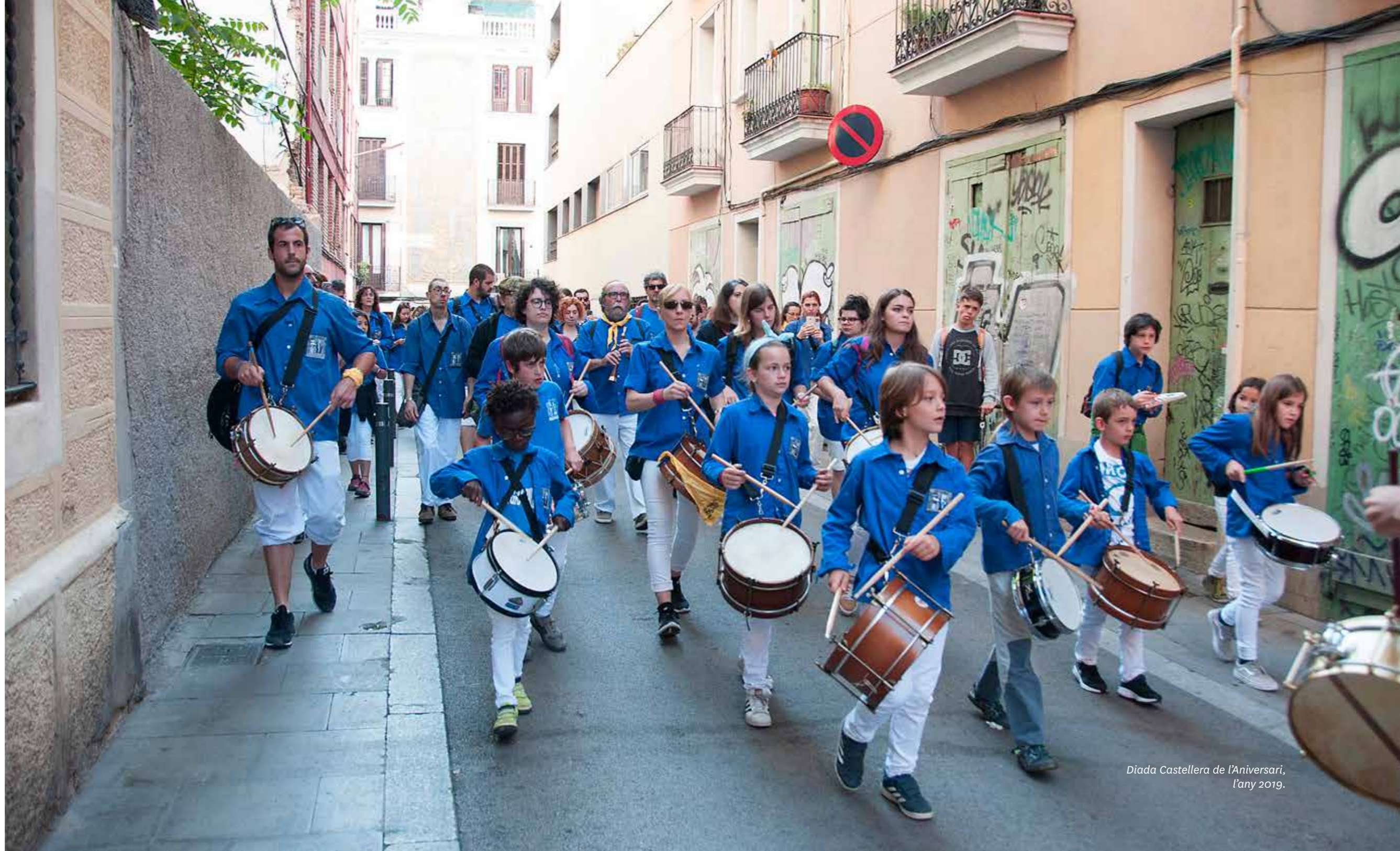
Diada Castellera de l'Aniversari, l'any 2019.

Segueix la mateixa estructura que la Diada Castellera de l'Aniversari.