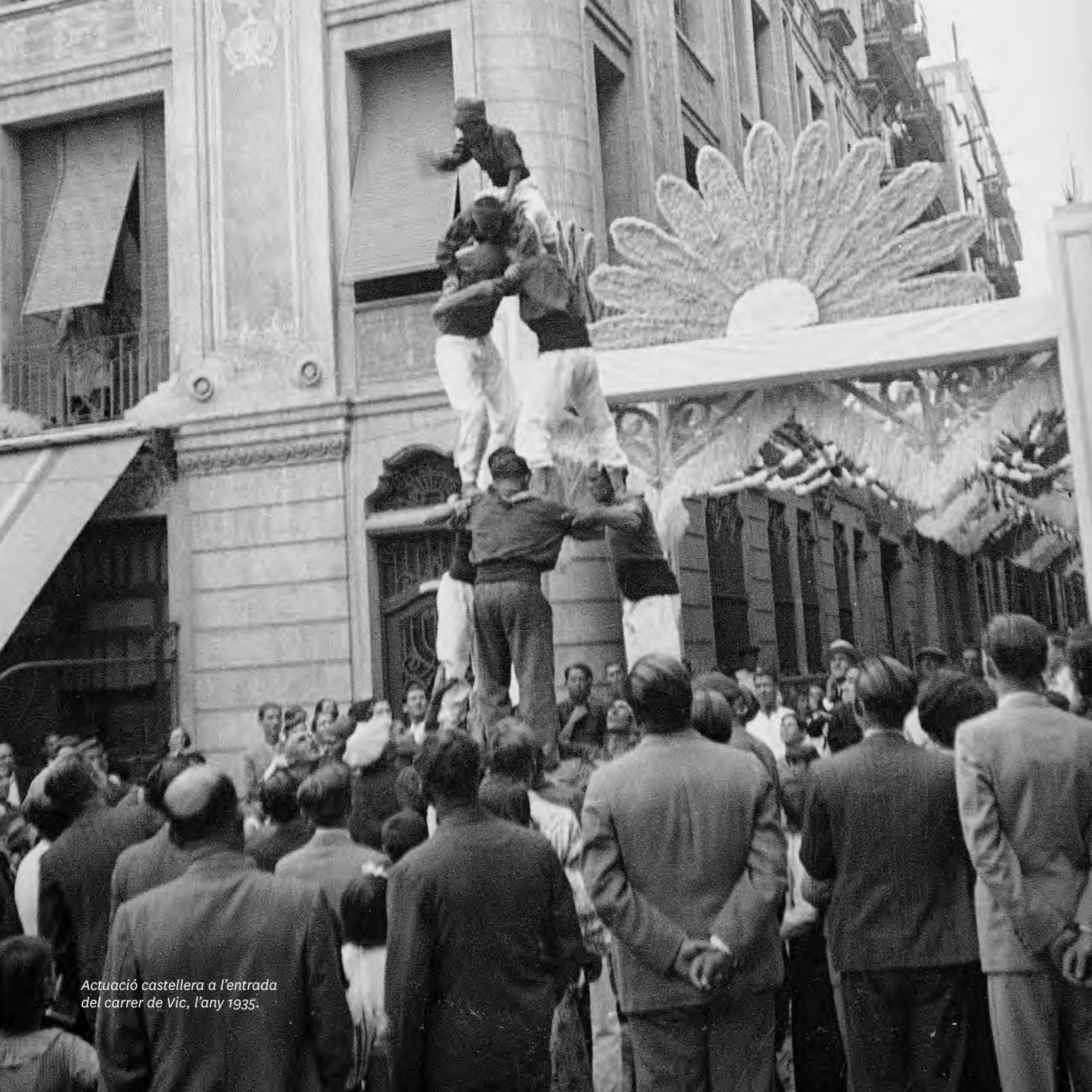
Actuació castellera a l'entrada del carrer de Vic, l'any 1935.