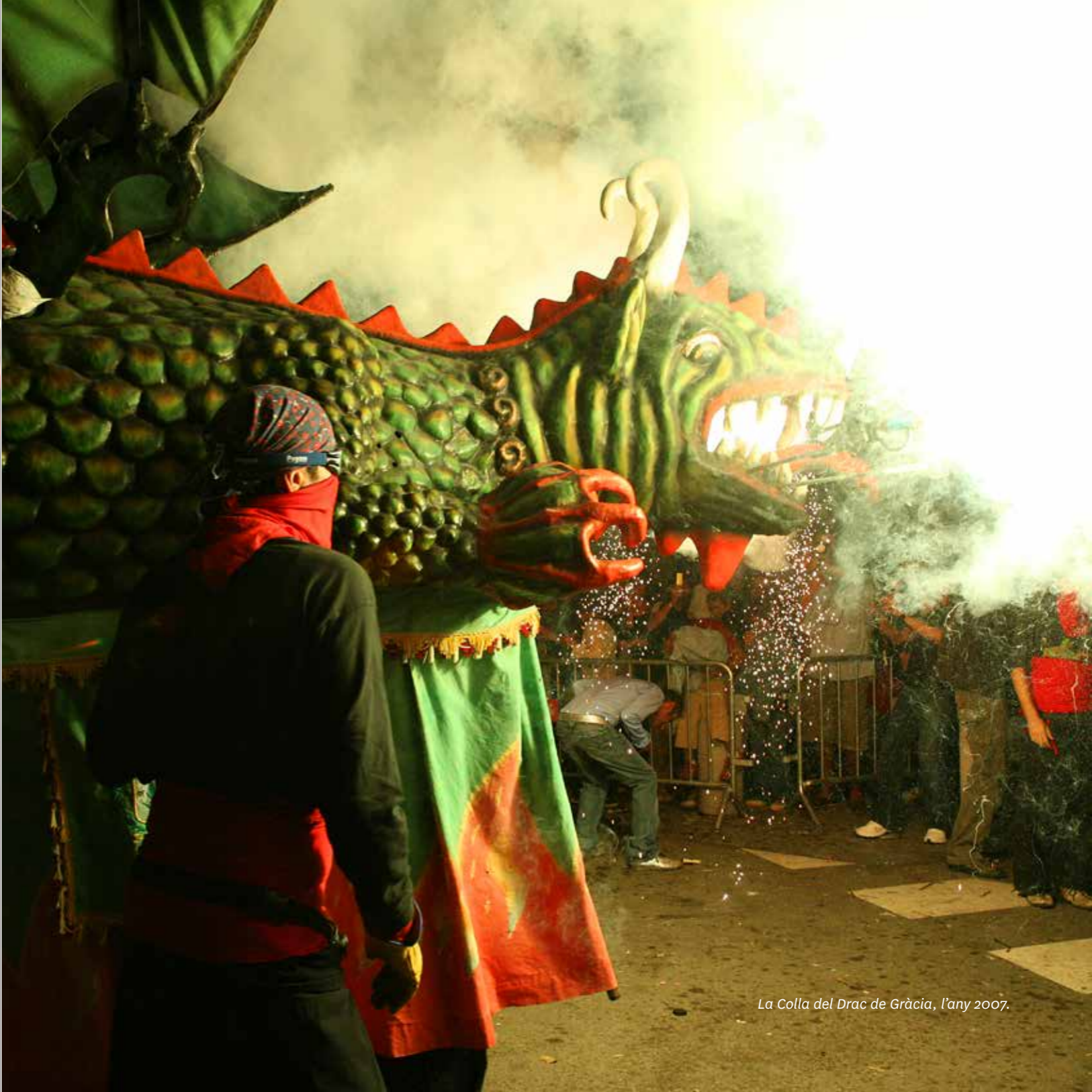
La Colla del Drac de Gràcia, l'any 2007.