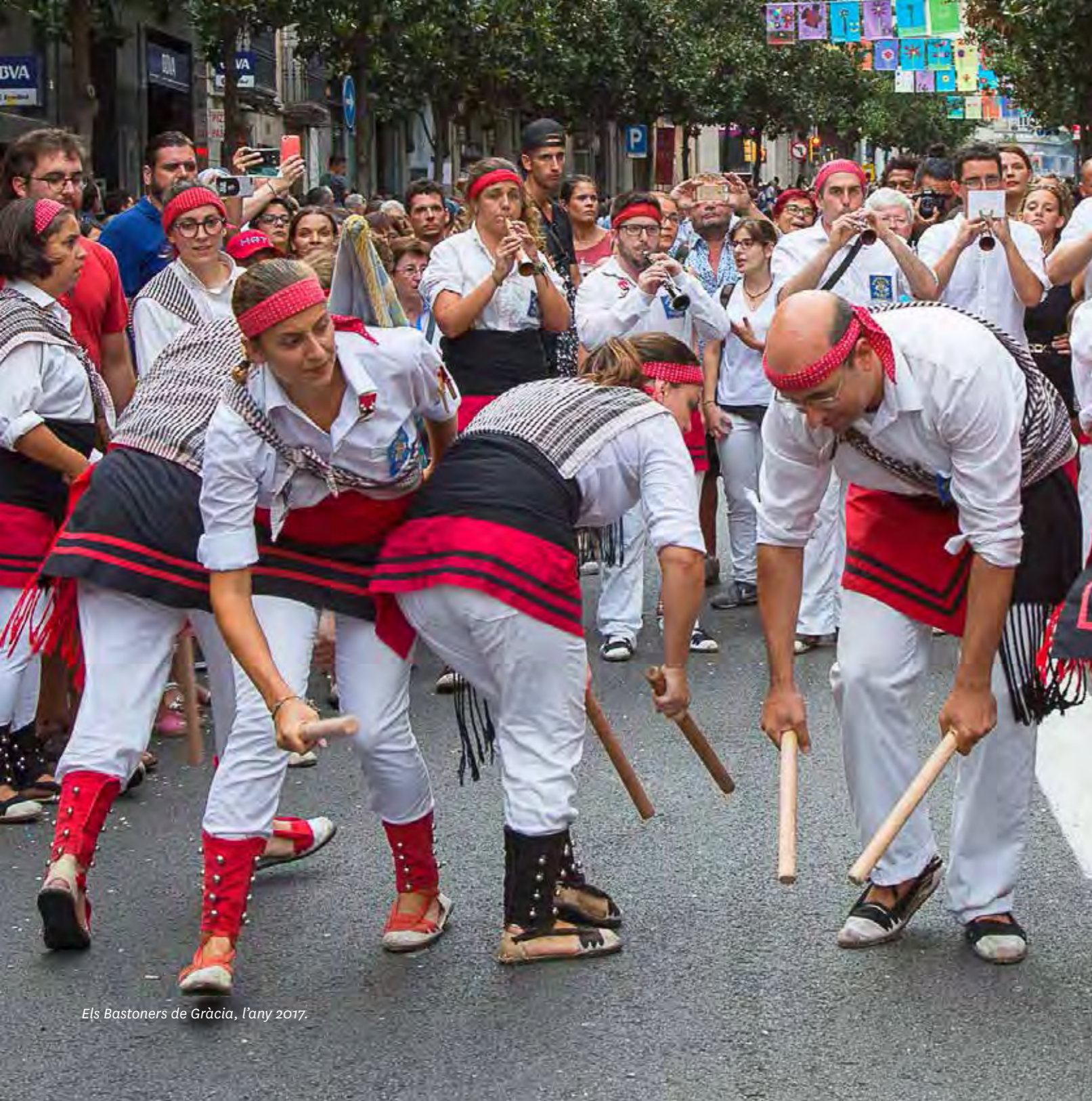
Els Bastoners de Gràcia, l'any 2017.