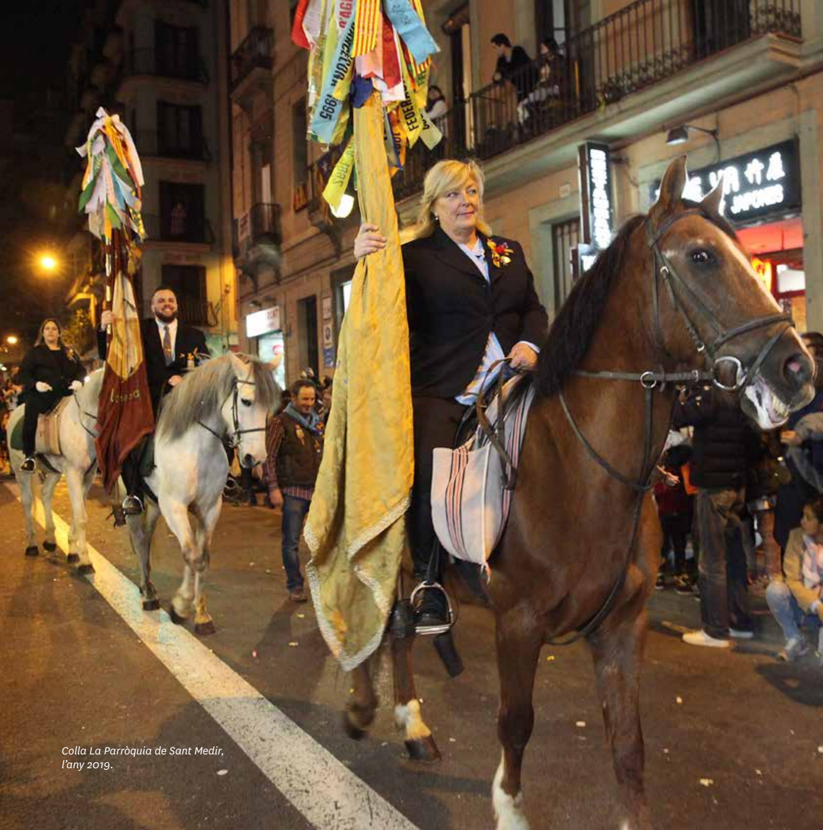
Colla La Parròquia de Sant Medir, l'any 2019.