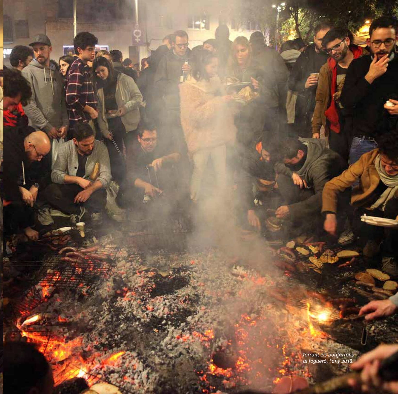
Torrant els botifarrons al fogueró, l'any 2018.