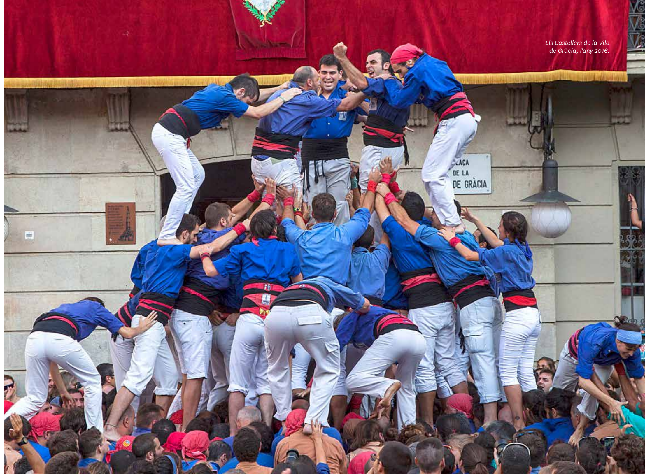
Els Castellers de la Vila de Gràcia, l'any 2016.

La colla va ser reconeguda l'any 1999 amb la Medalla d'Honor de la Ciutat de Barcelona i el Premi Vila de Gràcia, i els castells han estat reconeguts com a patrimoni immaterial de la humanitat per la UNESCO.