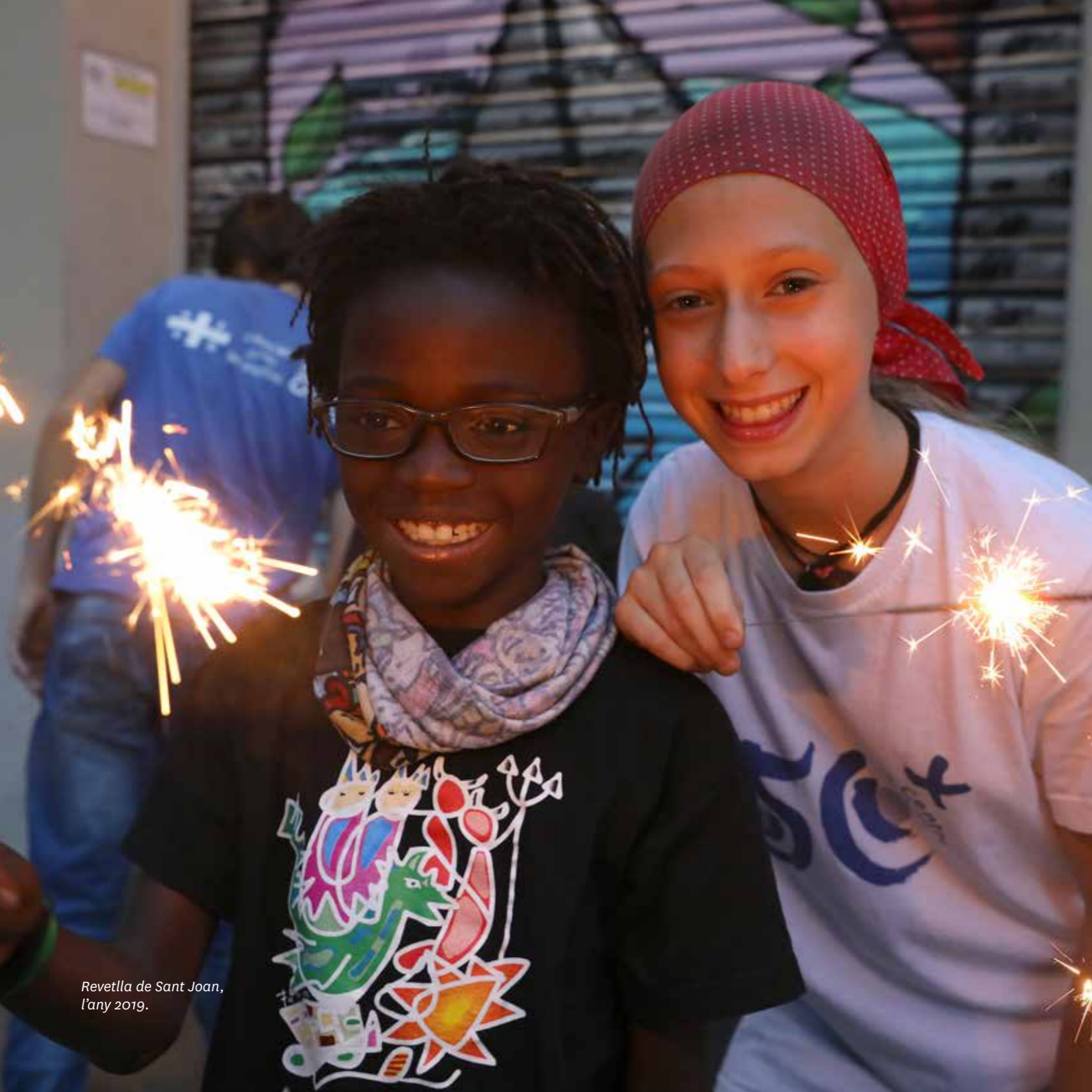
Revetlla de Sant Joan, l'any 2019.

Tradició seria allò del passat que subsisteix en una societat i que és acceptat per un cert consens compartit de creences [...]. La imatge de la continuïtat és la que més s'avé amb tradició, però, més que una continuïtat immòbil, cal que es fonamenti en la transformació.