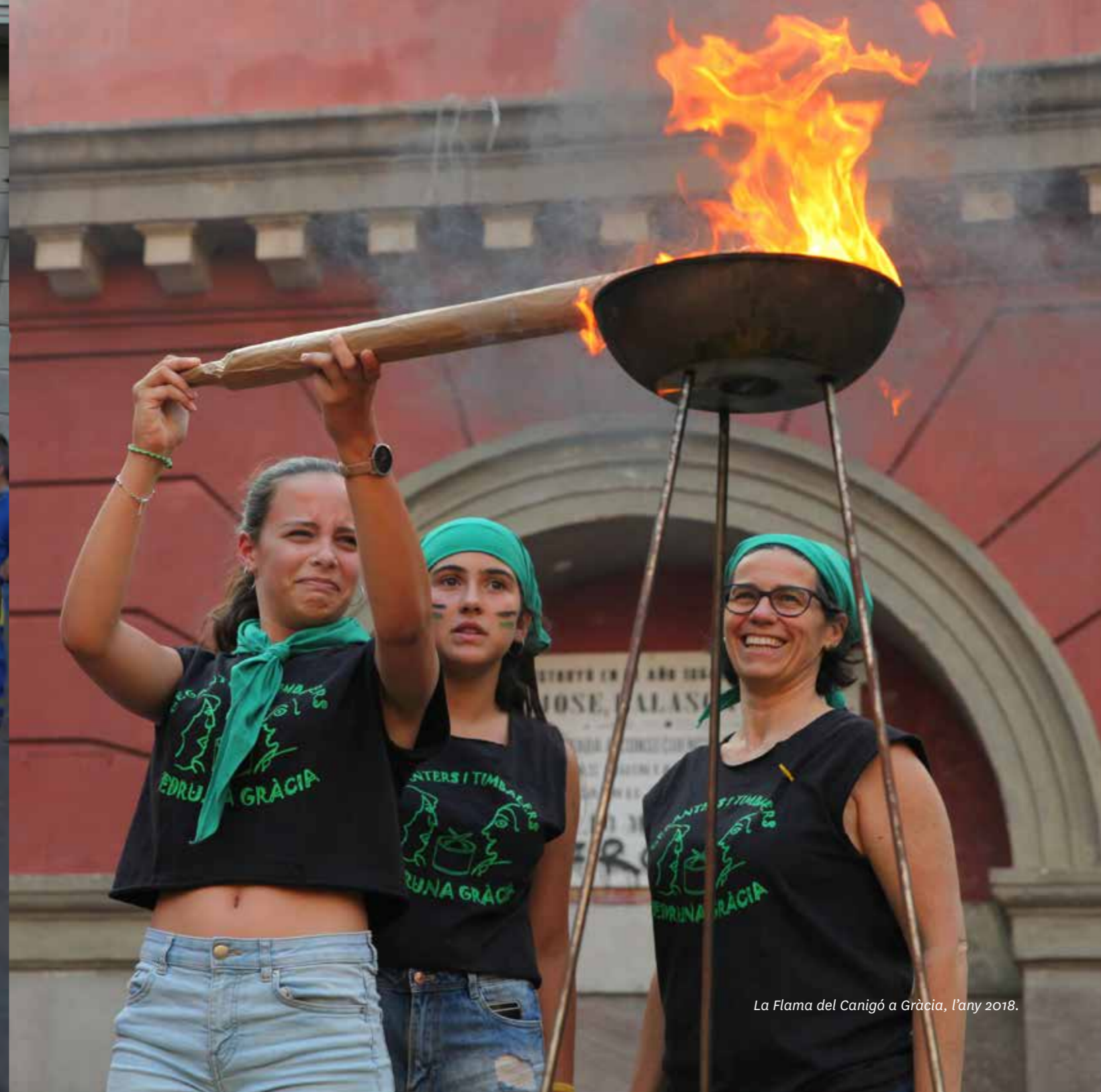
La Flama del Canigó a Gràcia, l'any 2018.