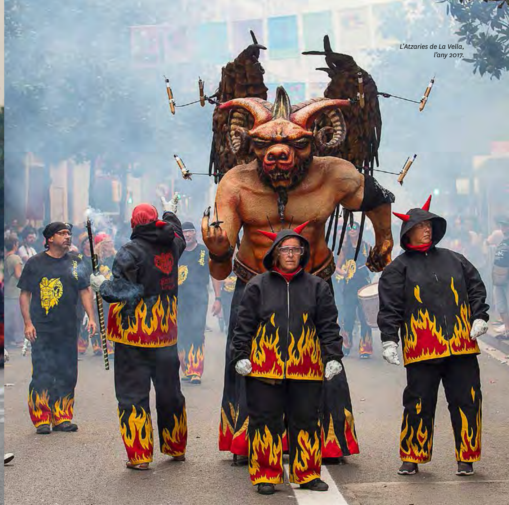
L'Atzarie de La Vella, l'any 2017.