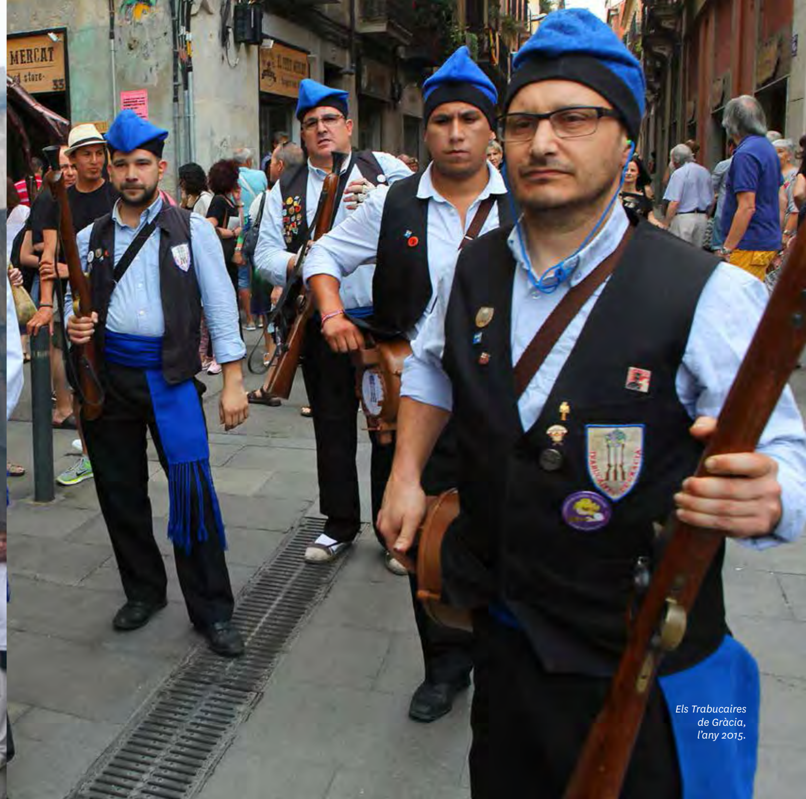
Els Trabucaires de Gràcia, l'any 2015.