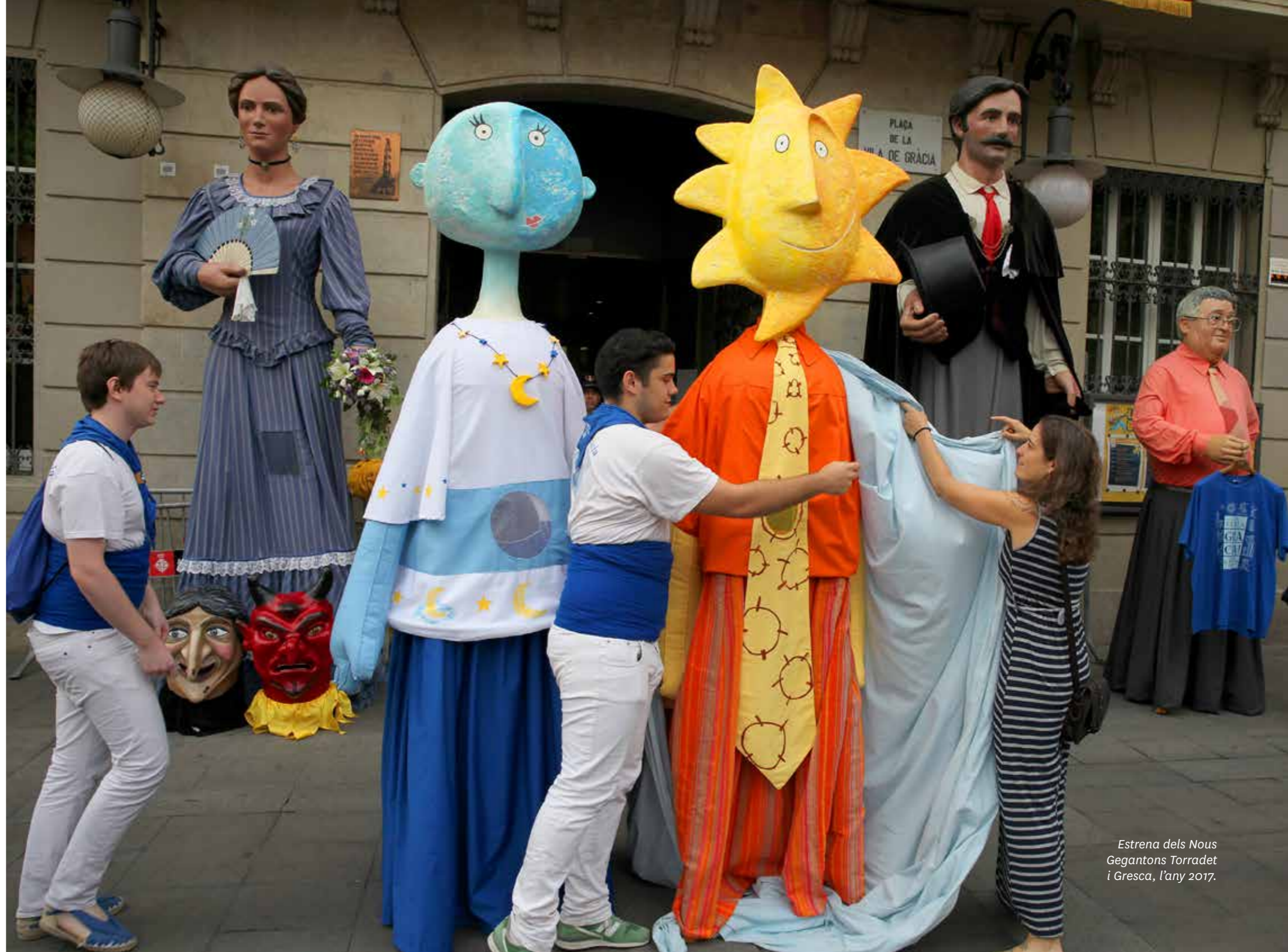
Estrena dels Nous Gegantons Torradet i Gresca, l'any 2017.