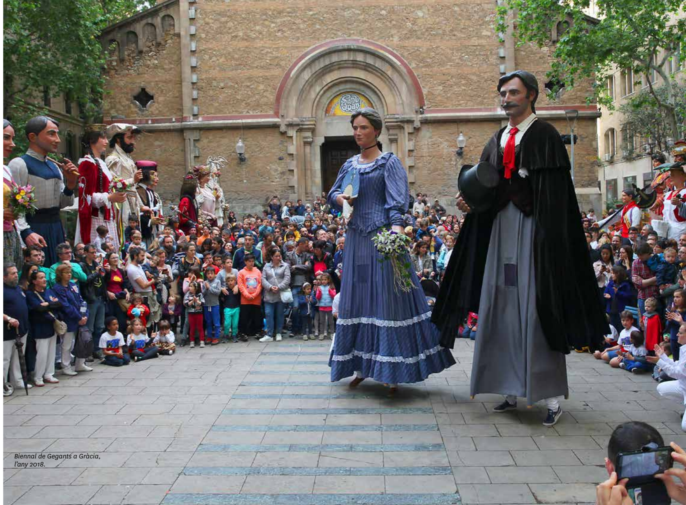
Biennal de Gegants a Gràcia, l'any 2018.

Durant tota la setmana anterior es fan petits actes al carrer Gran de Gràcia que anuncien l'arribada de la trobada gegantera.