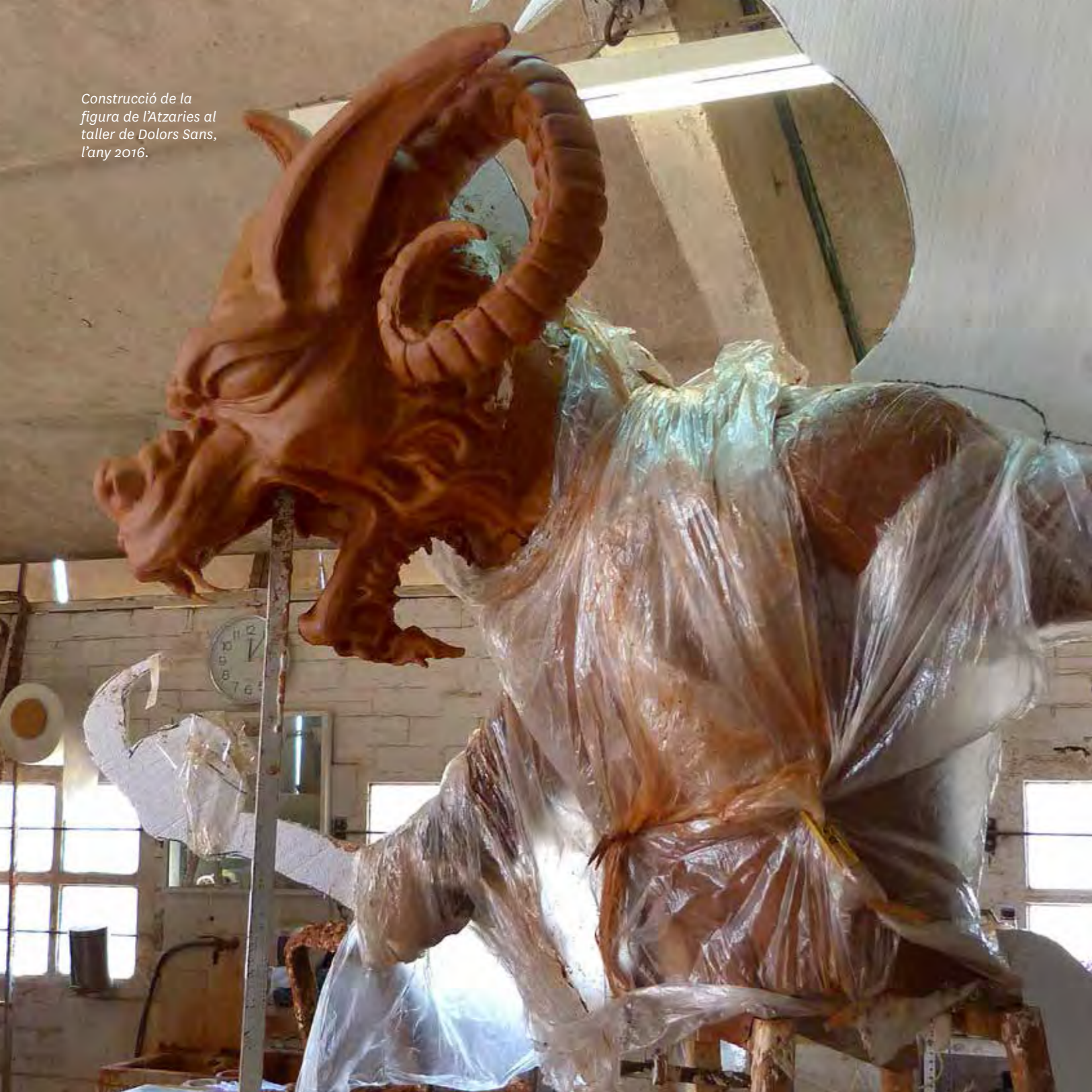
Construcció de la figura de l'Atzaries al taller de Dolors Sans, l'any 2016.

La cultura, i també, doncs, la cultura popular, és un procés obert de comunicació, i només es viu en tant que serveix per a comunicar coses, no pas per a emmagatzemar-les.