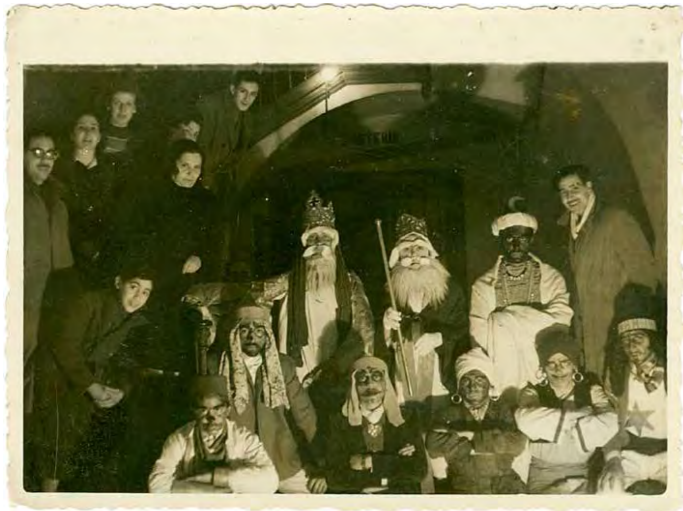
Vigília de Reis de 1949, a l'escala del carrer d'Astúries, número 85.