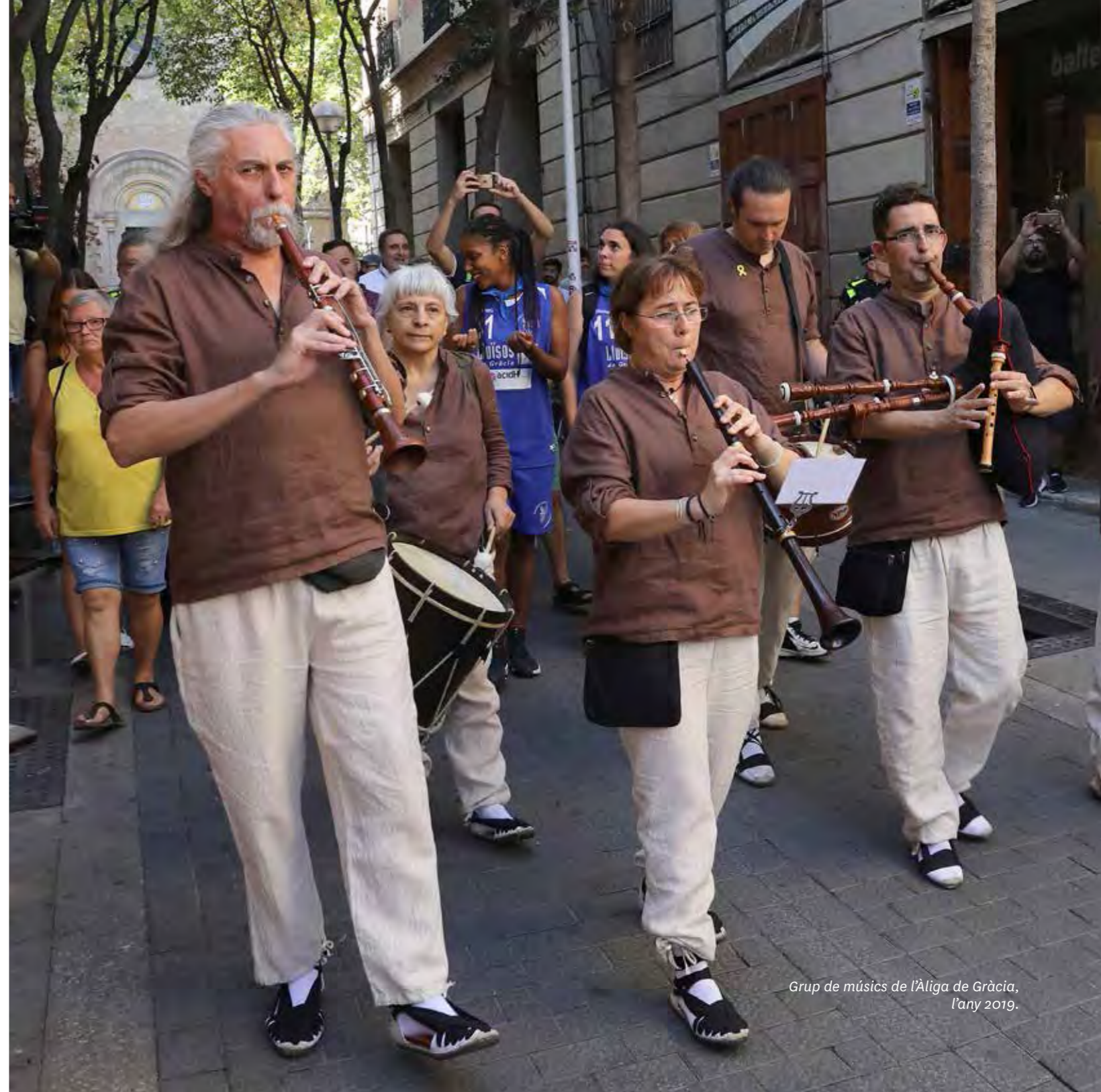
Grup de músics de l'Àliga de Gràcia, l'any 2019.

Autoria: Jordi Barbet, Kami (2017). Drac de Gràcia. Instruments: tabals i campana.