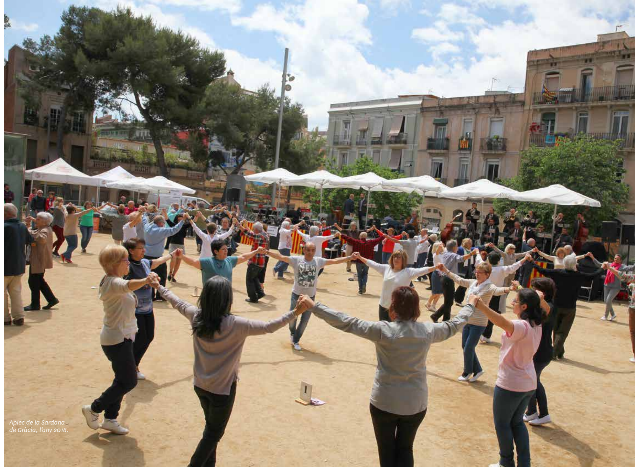
Aplec de la Sardana de Gràcia, l'any 2018.

En l'Aplec participen tres cobles, que durant tot el matí i tota la tarda interpreten sardanes. Al matí se celebra el Concurs de Colles Improvisades i durant la sessió de la tarda un jurat dona a conèixer els guanyadors.