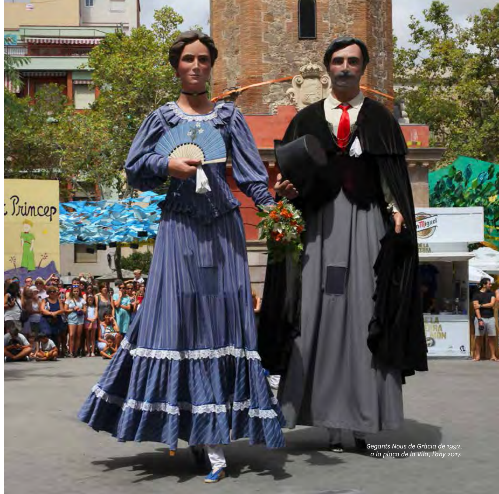
Gegants Nous de Gràcia de 1993, a la plaça de la Vila, l'any 2017.

El vestit que llueix la nova figura fou elaborat pel Taller Goretti. Va guarnida amb un pom de flors, que són naturals el dia de la Festa Major, i un ventall decorat amb els tres liris blancs sobre un fons blau cel de l'escut de Gràcia. Duu també un collaret i dues arracades.