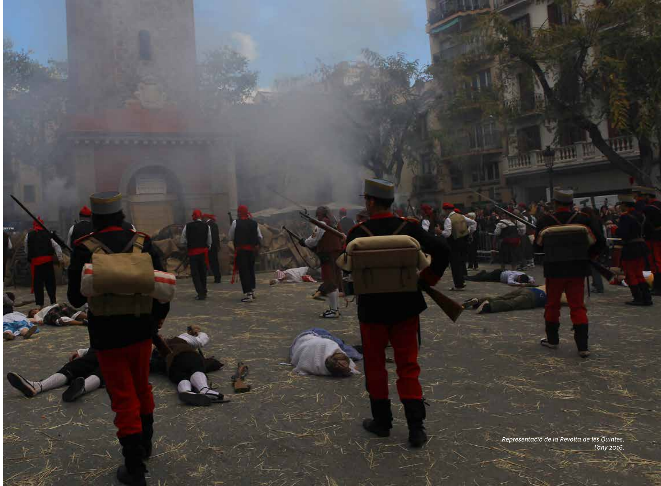
Representació de la Revolta de les Quintes, l'any 2016.

Aquesta representació va obtenir el Premi Vila de Gràcia 2015, a títol col·lectiu.