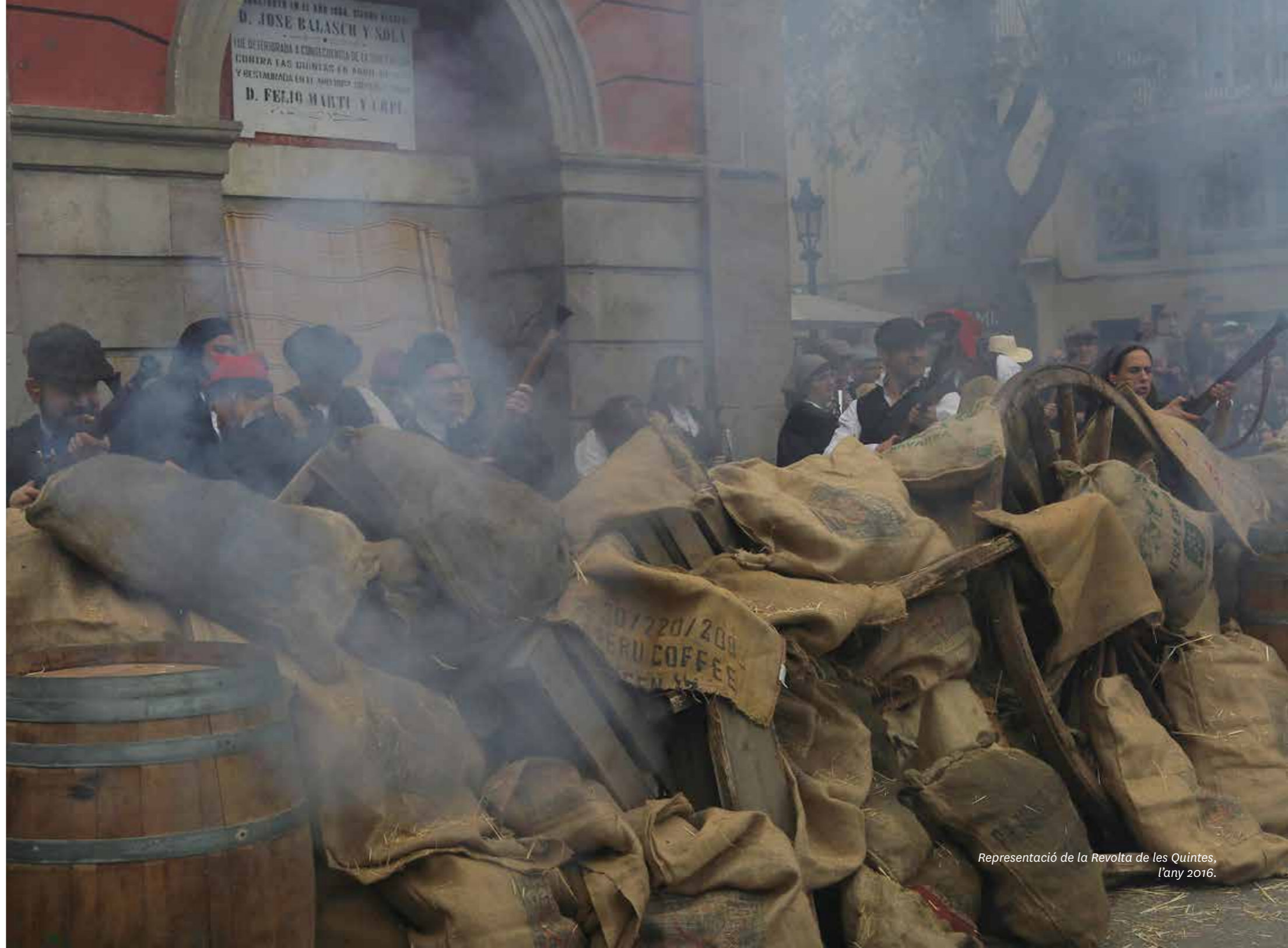
Representació de la Revolta de les Quintes, l'any 2016.

La diada comença amb la cercavila dels Trabucaires de Gràcia i de les colles de trabucaires convidades per diferents carrers. El recorregut s'acaba a la plaça de la Vila de Gràcia, on les colles fan els lluïments corresponents i la galejada final.