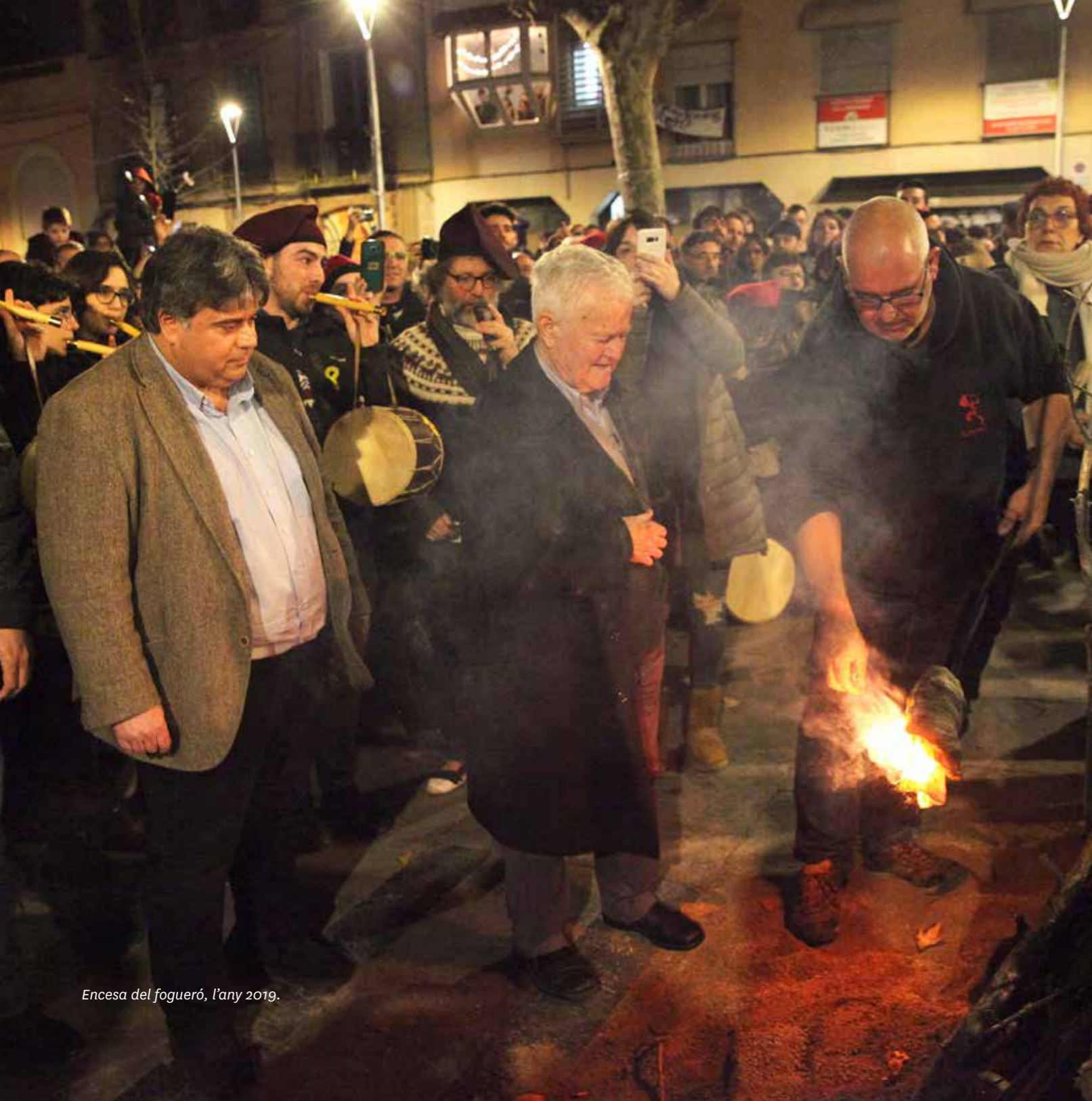
Encesa del fogueró, l'any 2019.