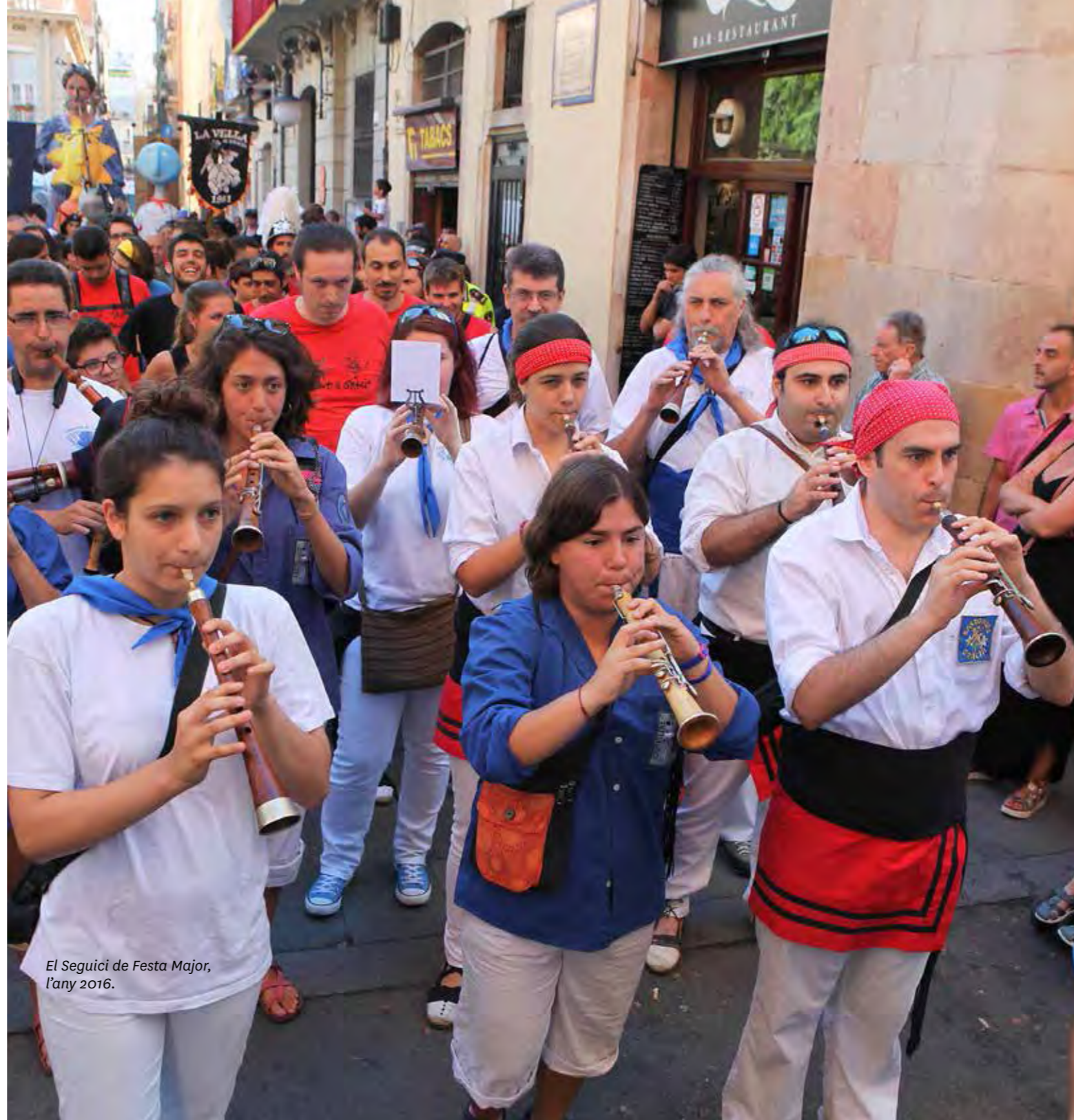
El Seguici de Festa Major, l'any 2016.

Amb la Guàrdia Urbana de gala, el Seguici del Matí de Festa Major surt de la plaça de la Vila de Gràcia pel carrer de Goya fins a Gran de Gràcia i, tot seguit, baixa cap a l'església de Santa Maria de Gràcia, on les autoritats, les figures i les colles són rebudes pel rector de la parròquia.