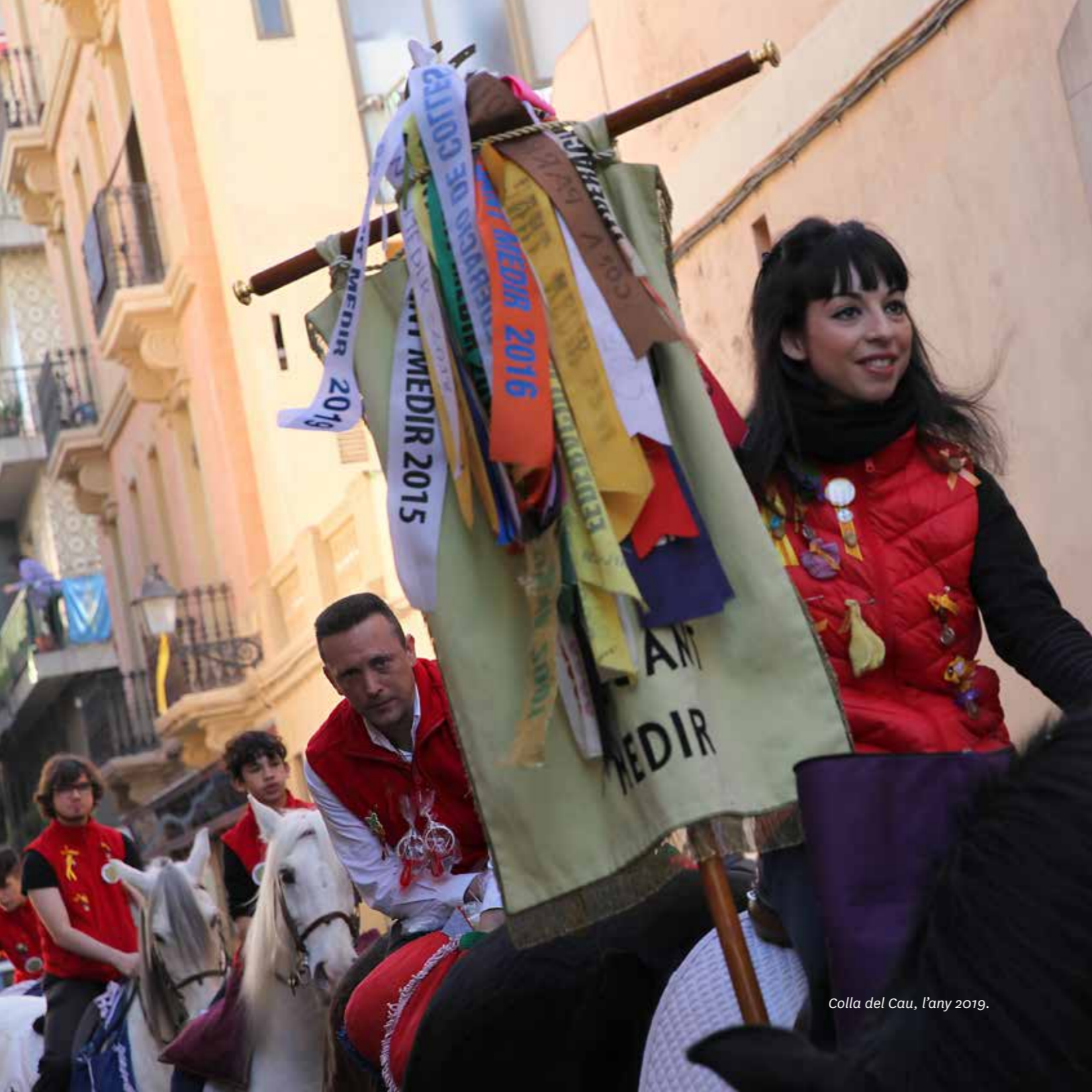
Colla del Cau, l'any 2019.