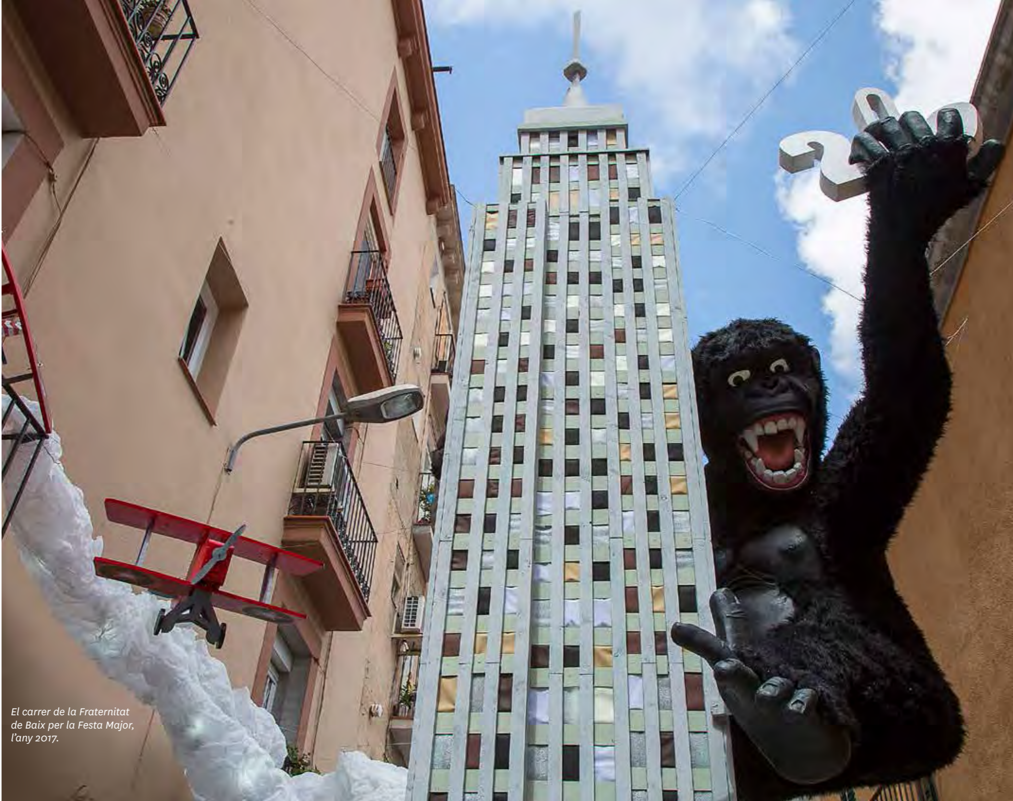
El carrer de la Fraternitat de Baix per la Festa Major, l'any 2017.

La Fundació Festa Major de Gràcia, que aglutina els carrers i places associats que participen en el concurs de guarniment, amb la col·laboració del Centre Artesà Tradicionari, la Coordinadora de Colles de Cultura de Gràcia, l'Orfeó Gracienc, el Centre Moral de Gràcia, l'Associació de Veïns i Amics del Passeig de Sant Joan, el Taller d'Història de Gràcia, la Federació de Colles de Sant Medir, l'església de Santa Maria de Jesús de Gràcia, el Club d'Escacs Tres Peons, la Salle, el Club Ciclista Gràcia, el Cercle Catòlic de Gràcia, el Cargol Graciós i el Casal d'Avis Siracusa, entre d'altres.