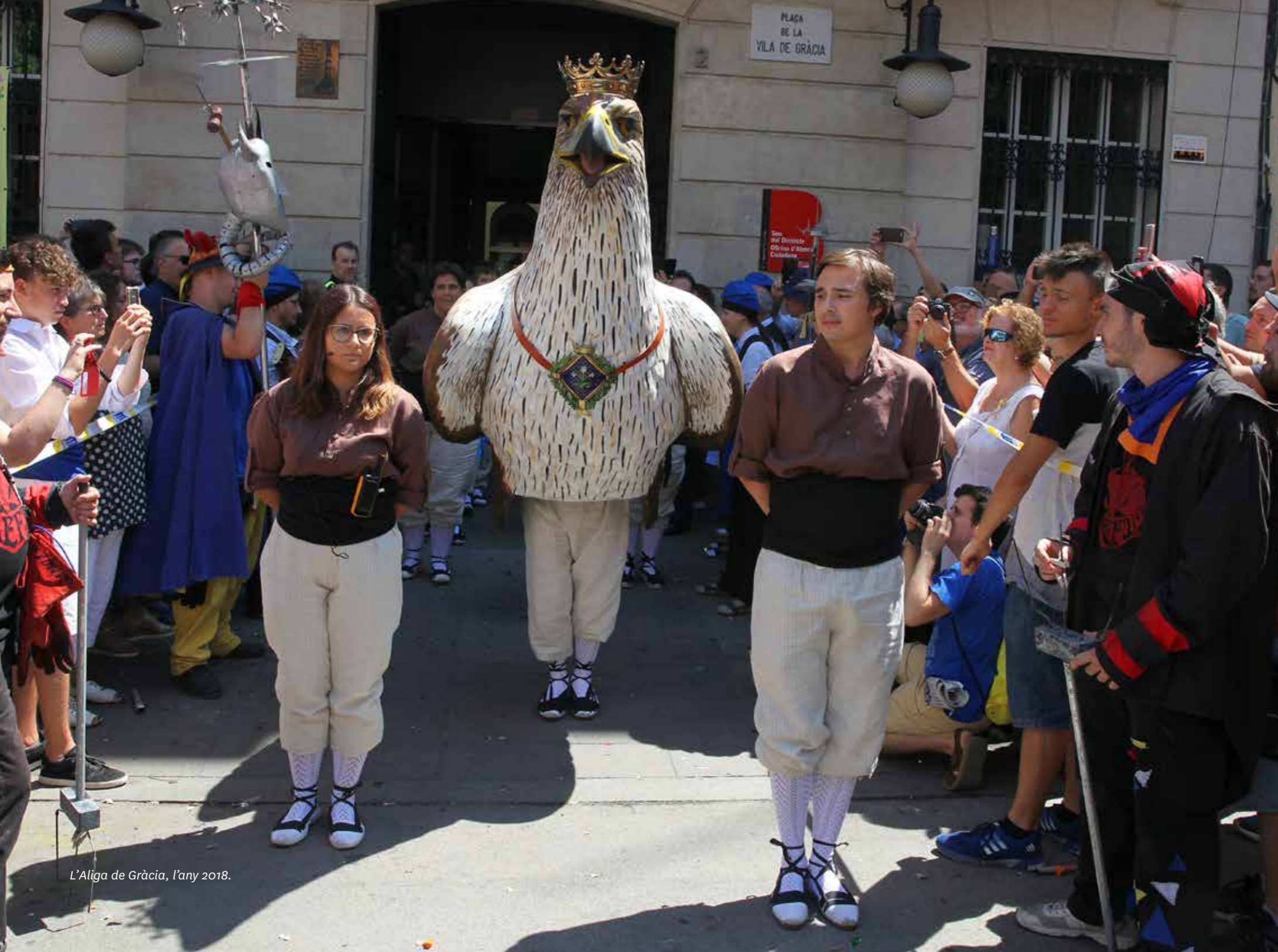
L'Àliga de Gràcia, l'any 2018.