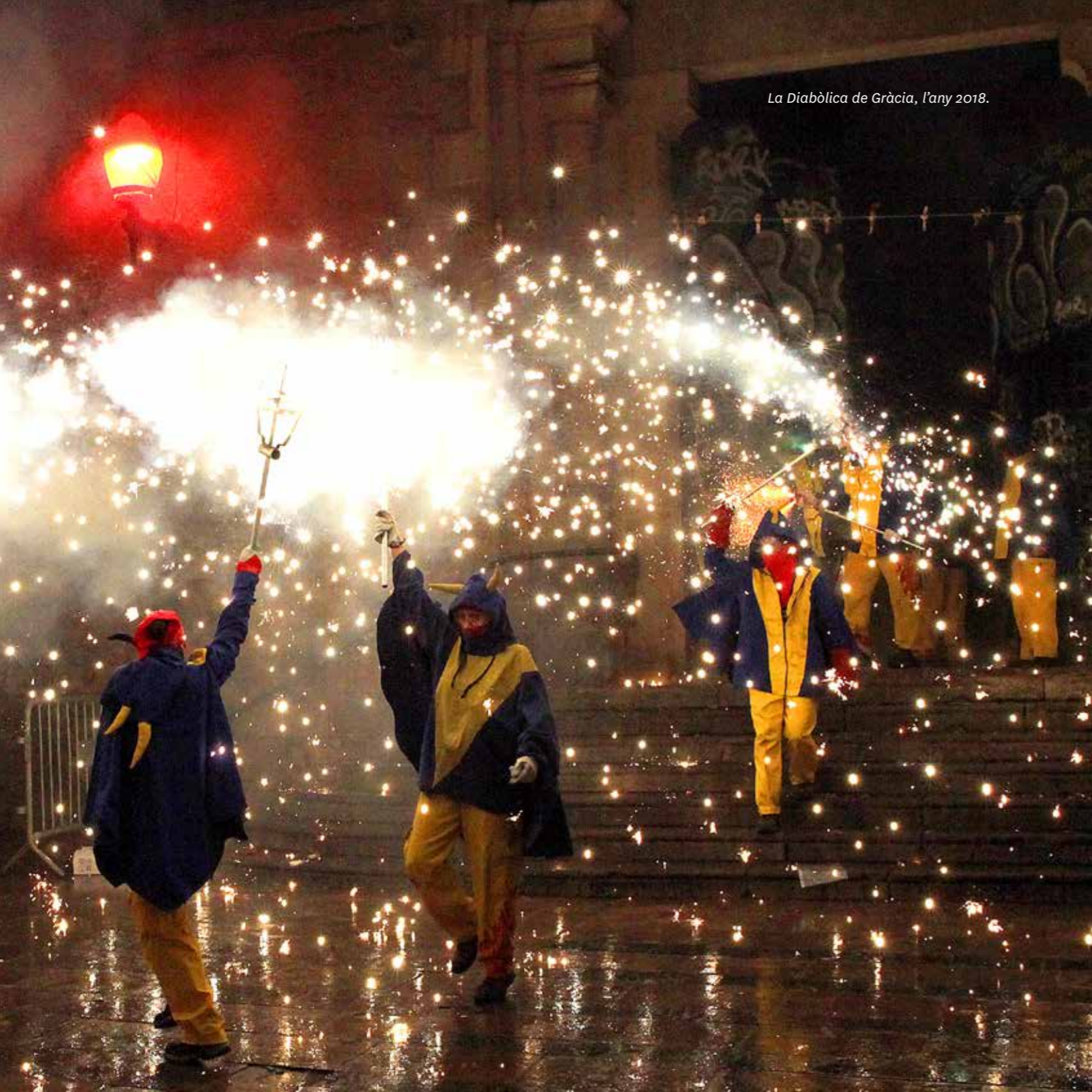
La Diabòlica de Gràcia, l'any 2018.