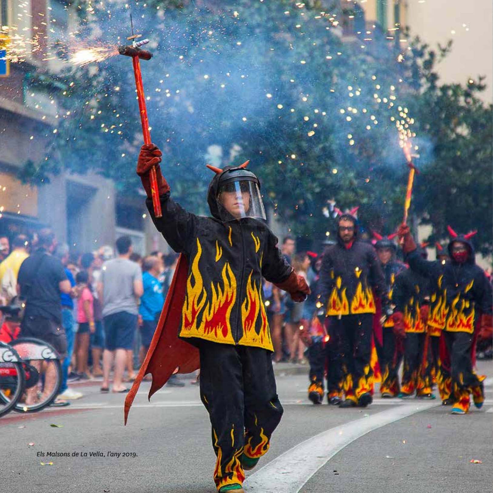
Els Malsons de La Vella, l'any 2019.