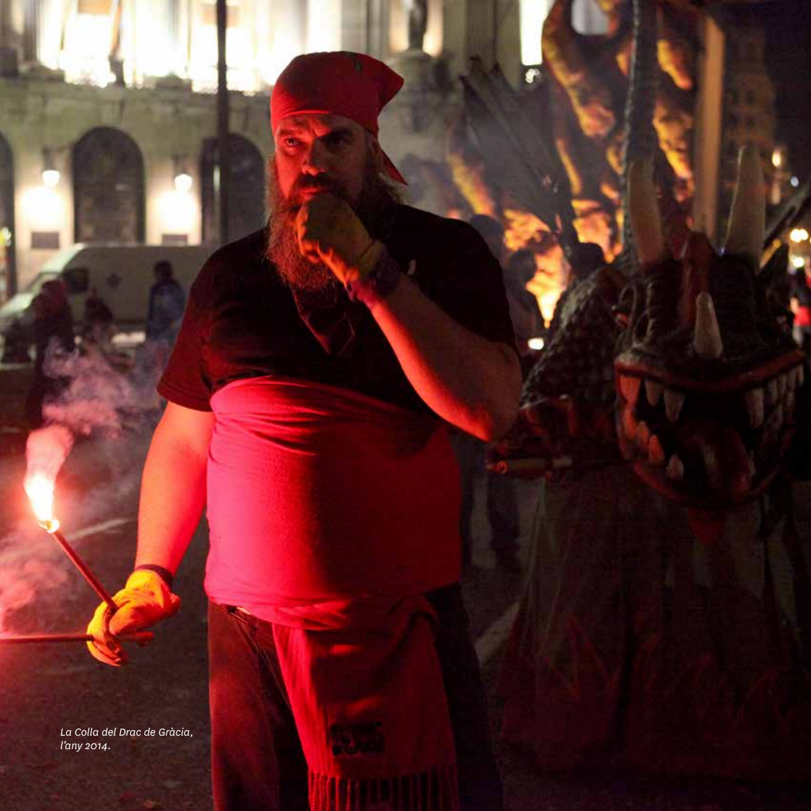
La Colla del Drac de Gràcia, l'any 2014.