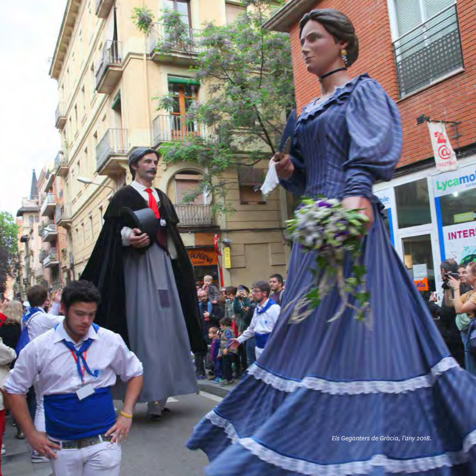
Els Geganters de Gràcia, l'any 2018.