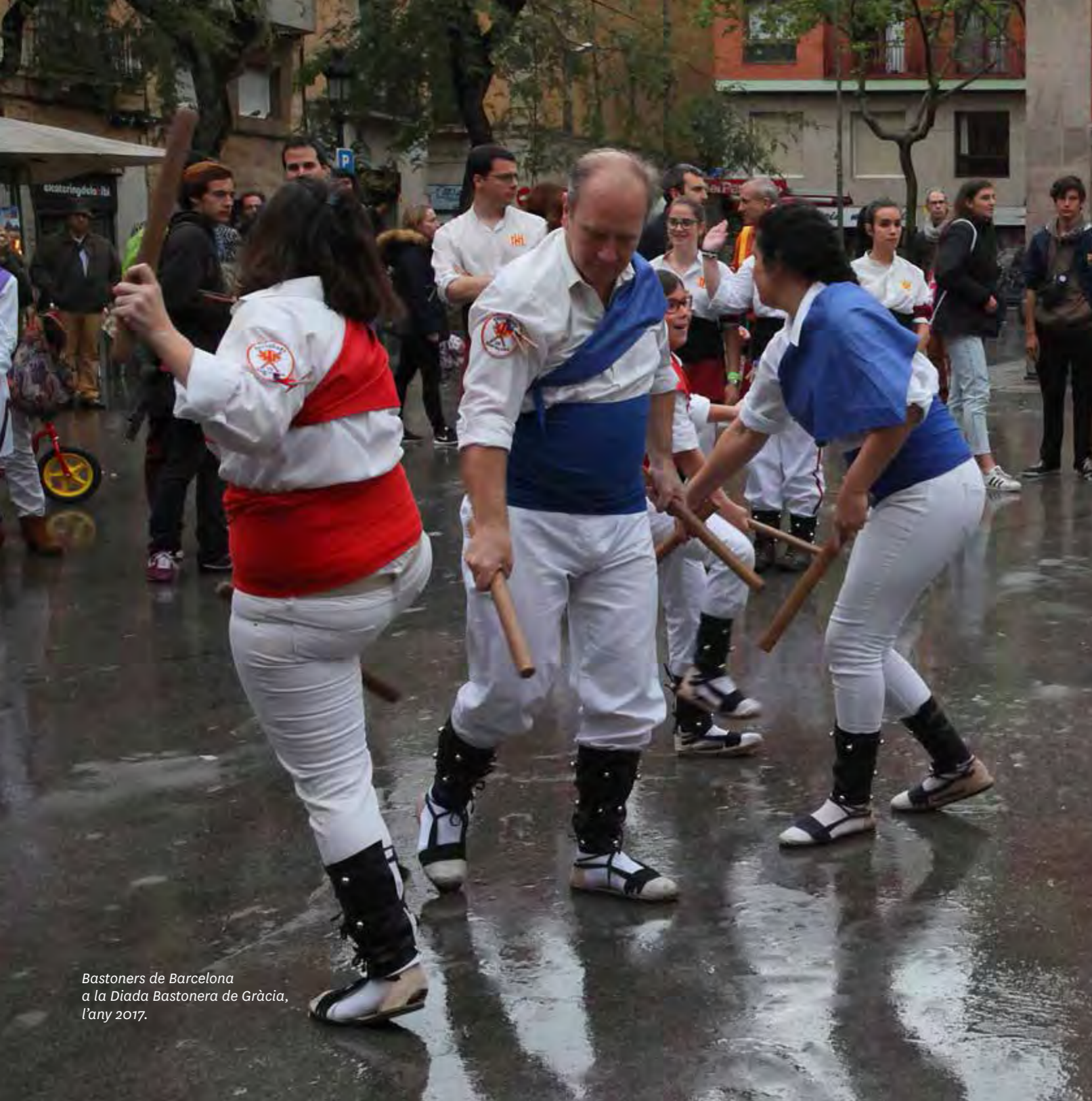
Bastoners de Barcelona a la Diada Bastonera de Gràcia, l'any 2017.