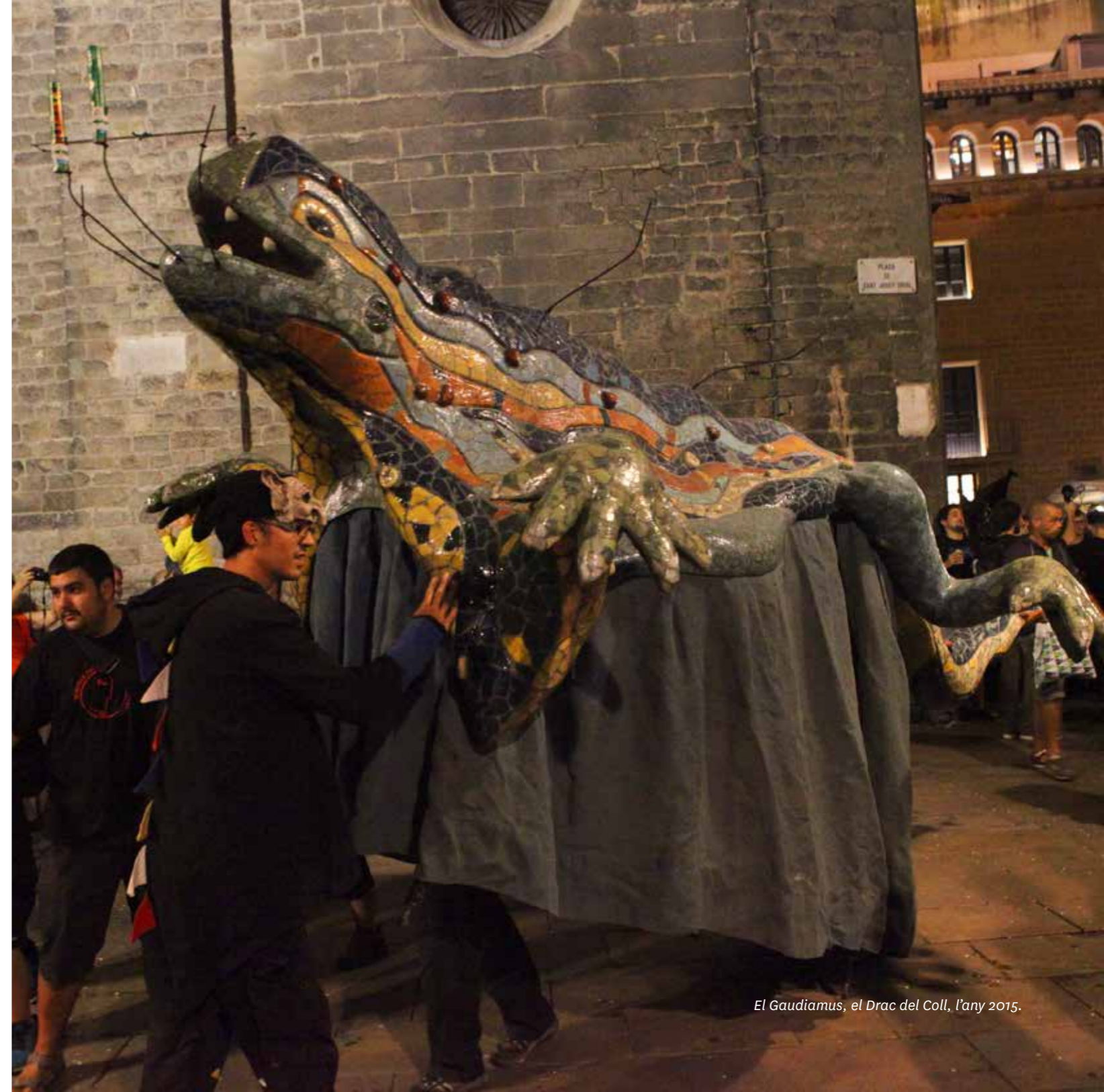
El Gaudiamus, el Drac del Coll, l'any 2015.

Quan està en exposició, el Gaudiamus porta un faldó de lluïment, amb motius aquàtics i amb el logotip de La Malèfica de color platejat brodat al davant, mentre que quan surt n'utilitza un de diferent, més senzill, lleuger i que permet més visió exterior als portadors. El ball de lluïment està en procés de desenvolupament.