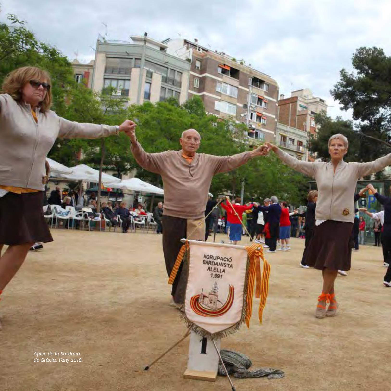
Aplec de la Sardana de Gràcia, l'any 2018.