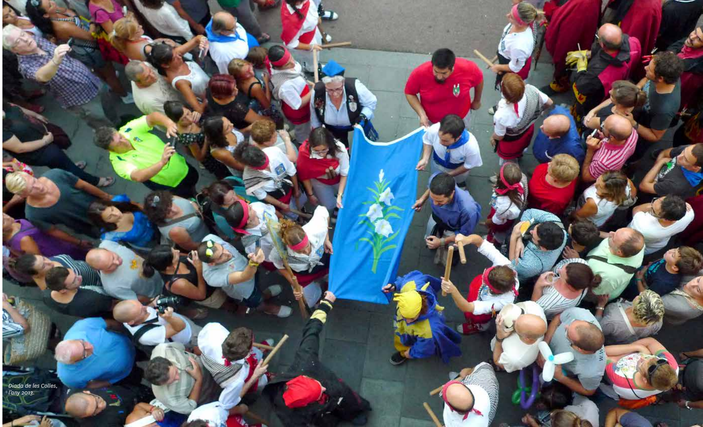
Diada de les Colles, l'any 2013.

L'espectacle té lloc a la plaça de la Vila de Gràcia i explica els orígens de Gràcia fins a l'annexió amb Barcelona. A més, s'intercalen textos històrics i narratius entremig de les actuacions i els lluïments de les colles. Finalitza amb la interpretació conjunta de Timbrallers , l'himne de les colles de cultura popular de Gràcia.