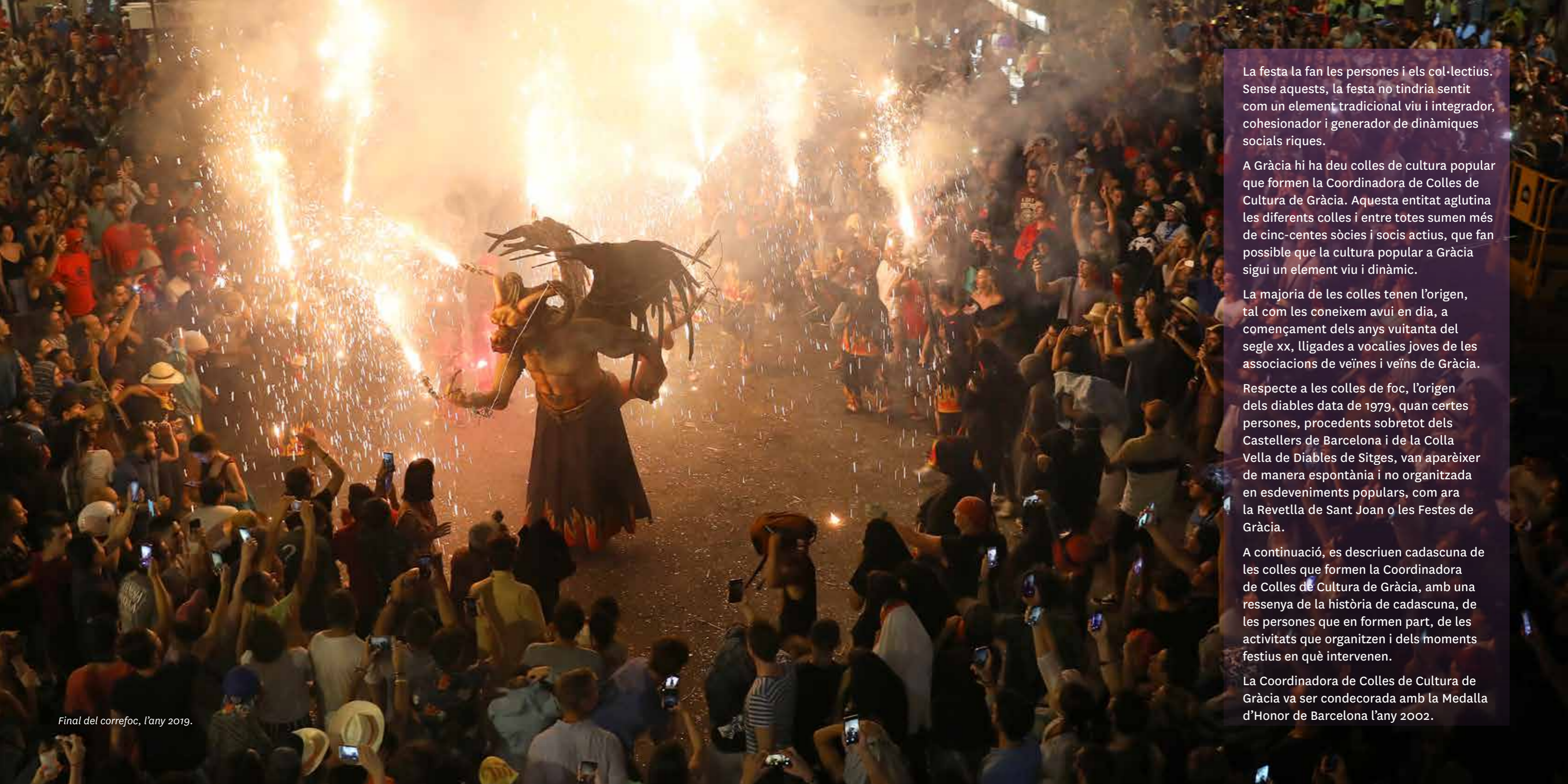
Final del correfoc, l'any 2019.

La festa la fan les persones i els col·lectius. Sense aquests, la festa no tindria sentit com un element tradicional viu i integrador, cohesionador i generador de dinàmiques socials riques.