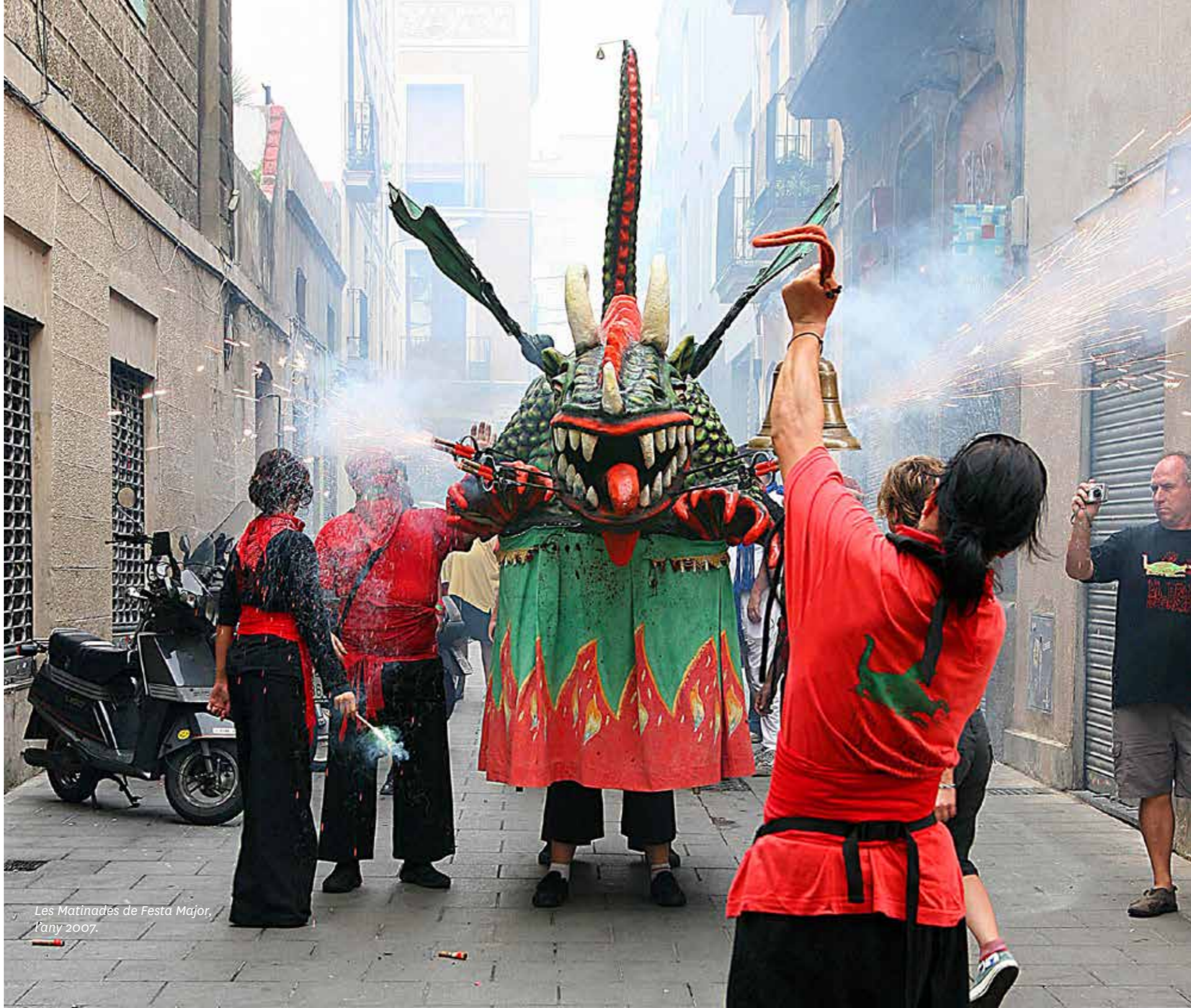
Les Matinades de Festa Major, l'any 2007.

L'inici i el final és a la plaça de la Vila de Gràcia.