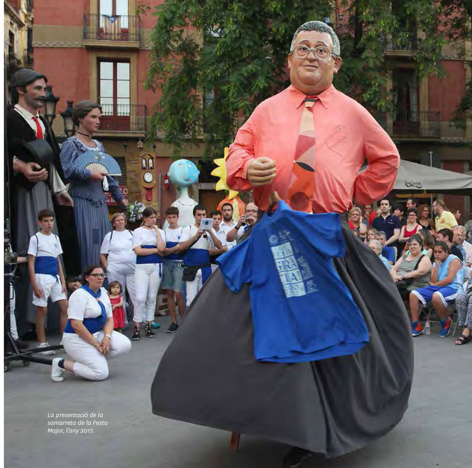
La presentació de la samarreta de la Festa Major, l'any 2017.

Posteriorment, el Gegantó Torres fa un ball i, després, el president de la Fundació Festa Major de Gràcia i el regidor i el president del Districte substitueixen la samarreta de l'any anterior per la nova, i el Gegantó torna a ballar. Tot seguit, es van esmentant tots els carrers i les places que guarneixen el seu espai i un representant de cadascun puja a la tarima a recollir la nova samarreta. També s'esmenten els altres espais de festa. En aquesta part de l'acte, cada vegada que es diu el nom d'un espai els Trabucaires de Gràcia, des del balcó de l'Ajuntament, fan una galejada individual per a cada carrer, cada plaça o cada espai que participa en la Festa Major. L'acte finalitza amb un concert de la Banda Municipal de Barcelona.