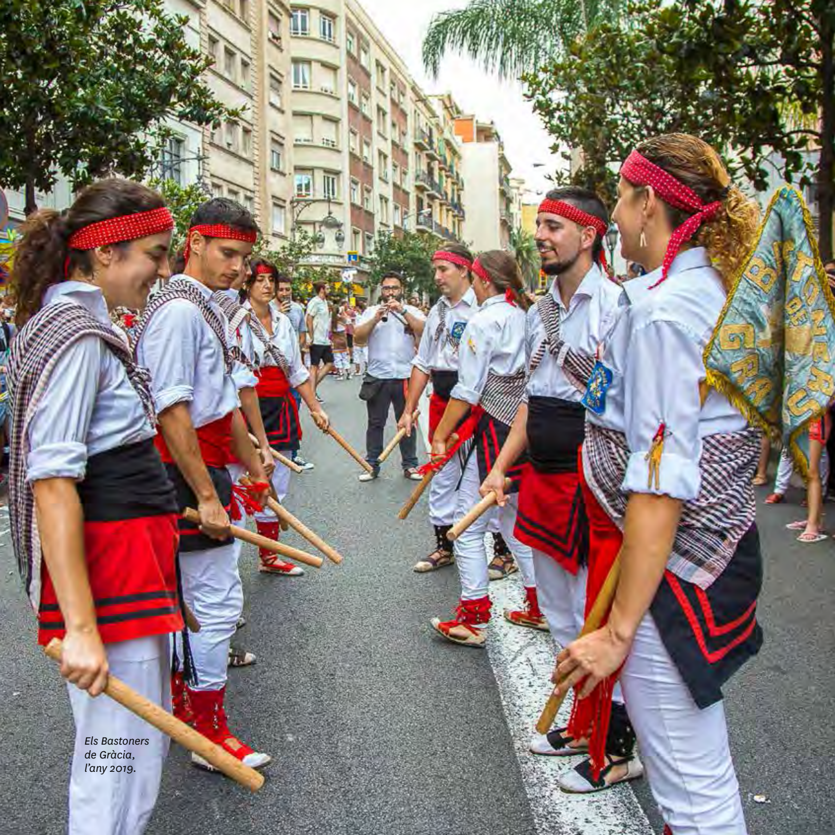
Els Bastoners de Gràcia, l'any 2019.