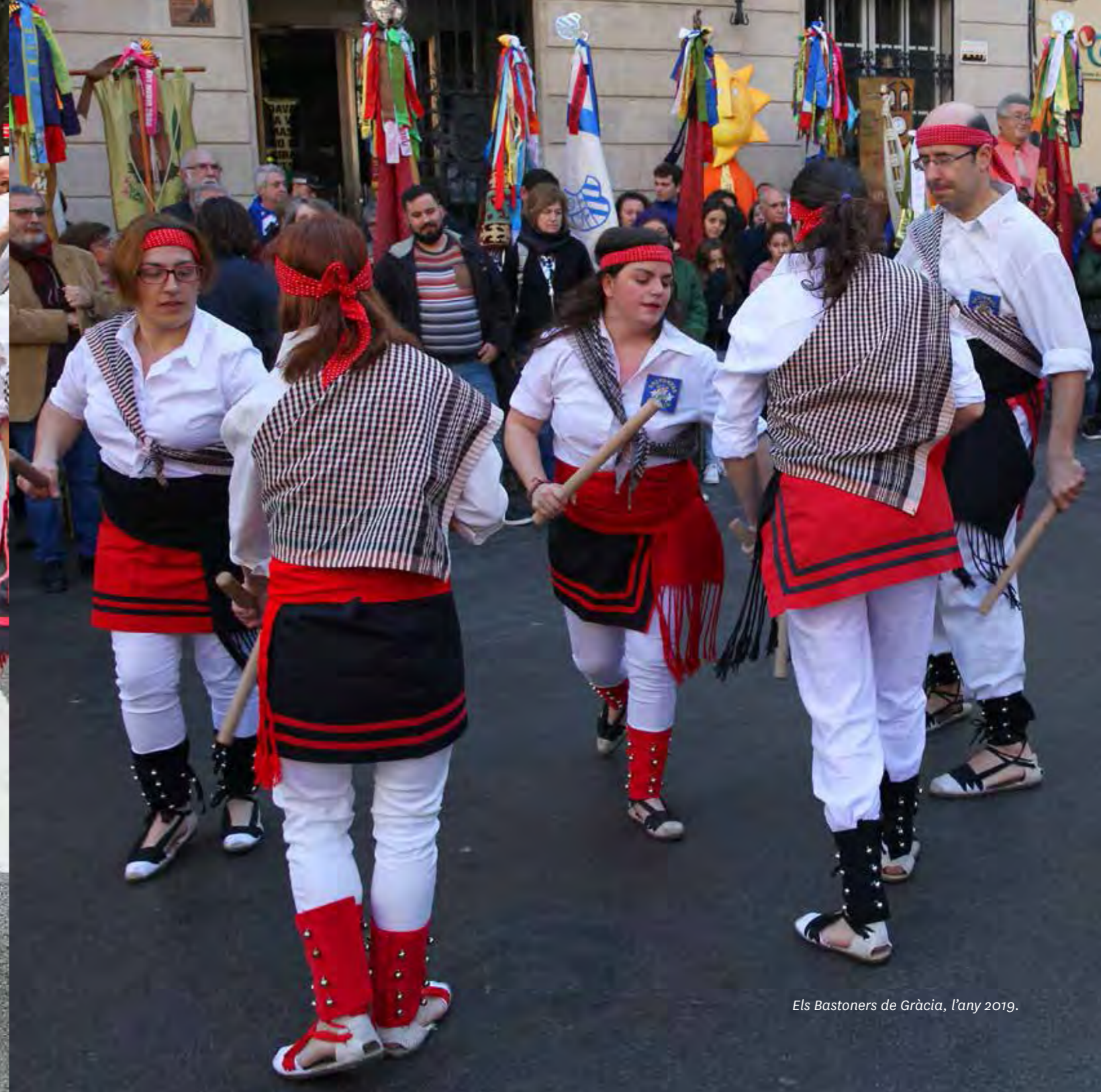
Els Bastoners de Gràcia, l'any 2019.