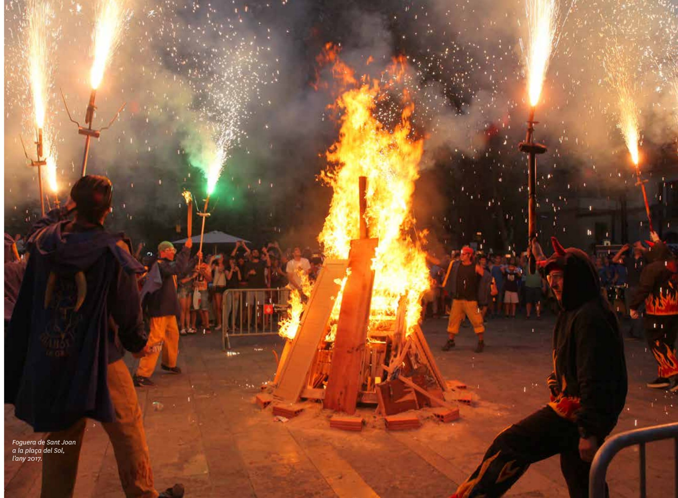
Foguera de Sant Joan a la plaça del Sol, l'any 2017.

Membres de l'organització de la Flama del Canigó de Gràcia la recullen a mitja tarda a la plaça de Sant Jaume de Barcelona. Arribada la Flama a la vila, s'inicia una cercavila fins a una plaça, on es llegeix el manifest corresponent i tot seguit es reparteix la Flama entre totes les entitats que en volen. Finalment, amb la Flama s'encén la foguera de la plaça del Sol.