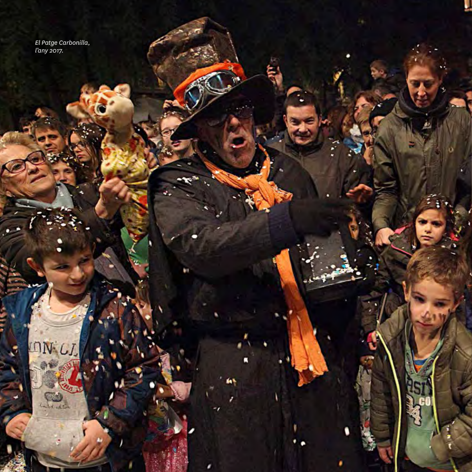
El Patge Carbonilla, l'any 2017.