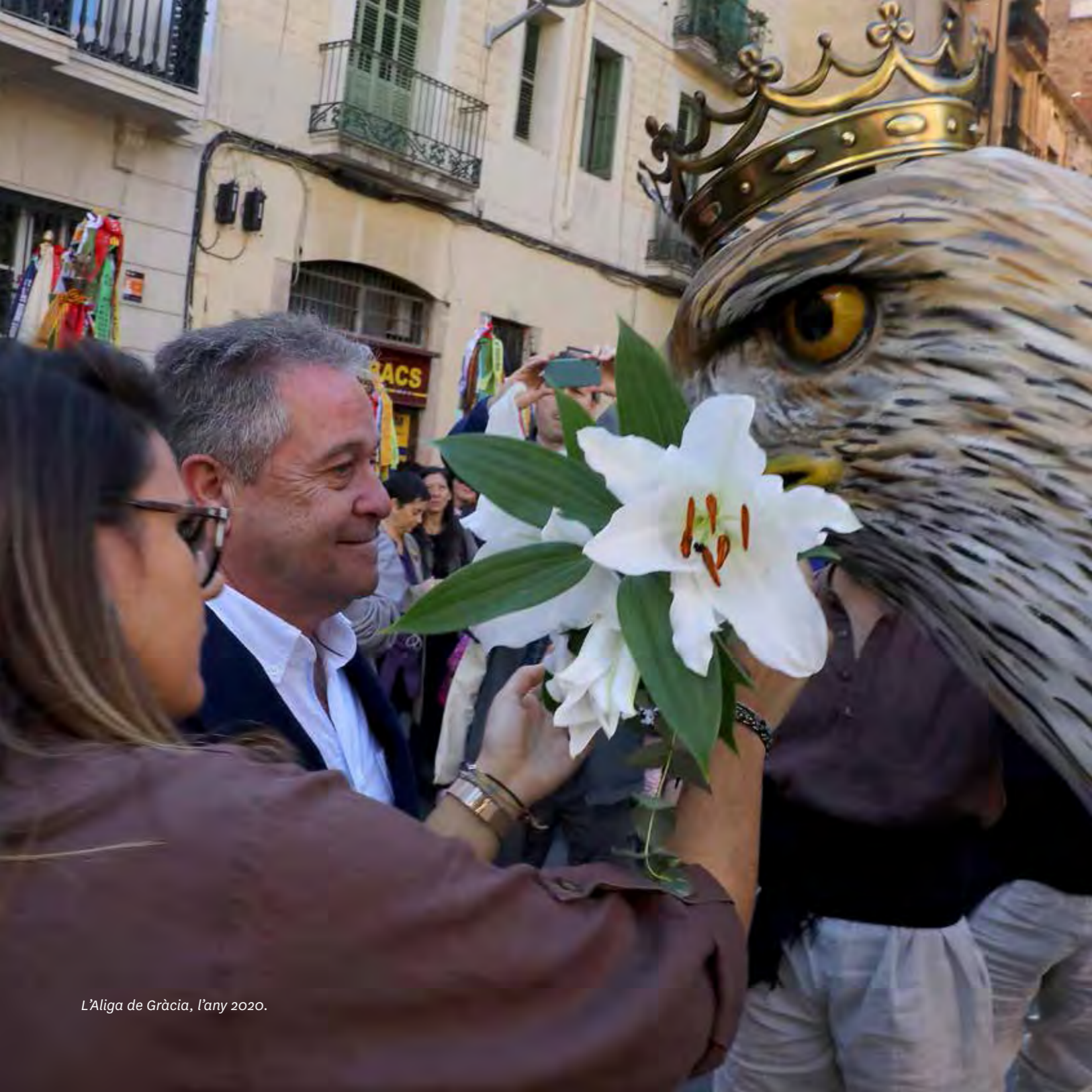
L'Aliga de Gràcia, l'any 2020.