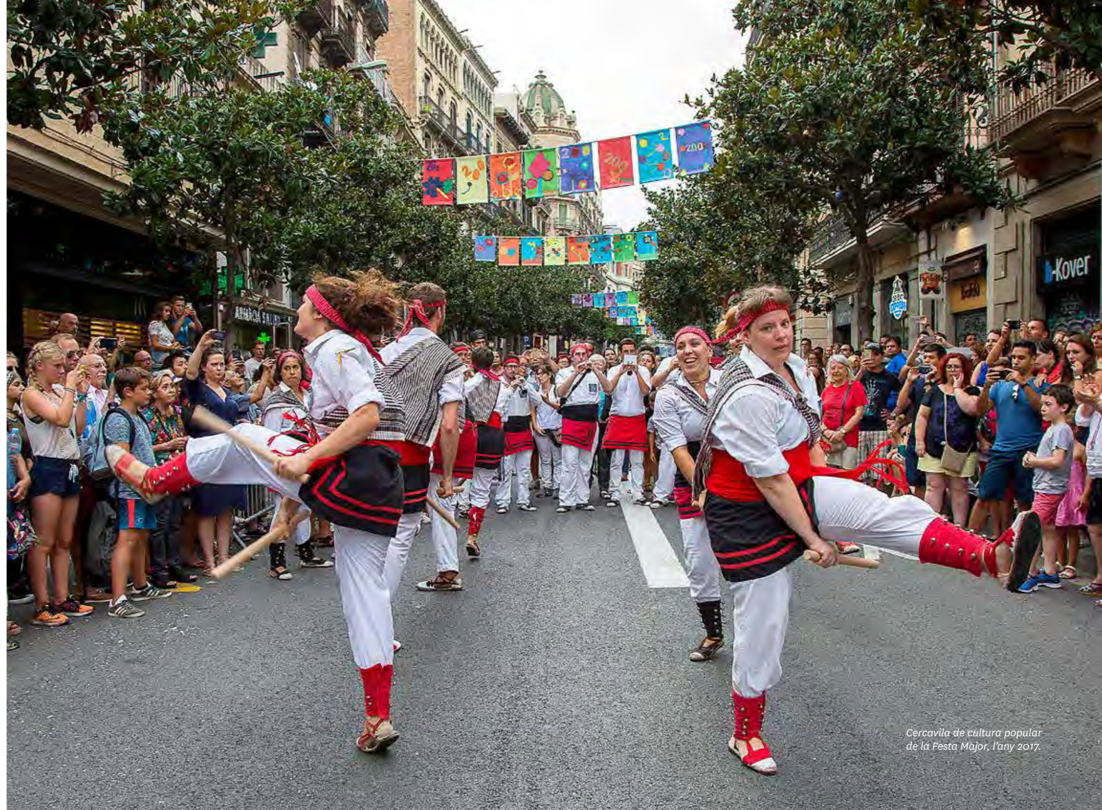
Cercavila de cultura popular de la Festa Major, l'any 2017.

Desfilada de les diferents colles participants, amb un lluïment final a la plaça de la Vila. Des del 2010 el recorregut és el següent: carrer Gran de Gràcia amb carrer de Santa Àgata, travessera de Gràcia, carrer del Torrent de l'Olla, carrer del Diluvi i plaça de la Vila.