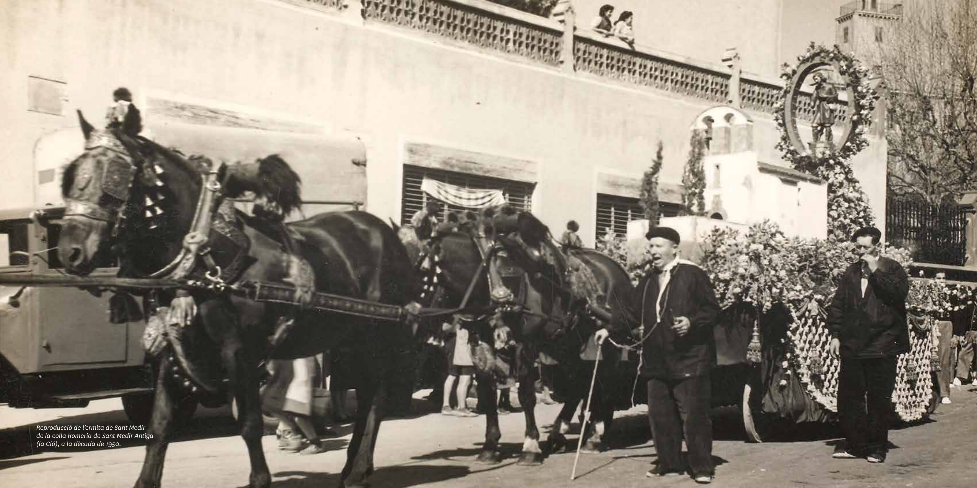
Reproducció de l'ermita de Sant Medir de la colla Romeria de Sant Medir Antiga (la Ció), a la dècada de 1950.