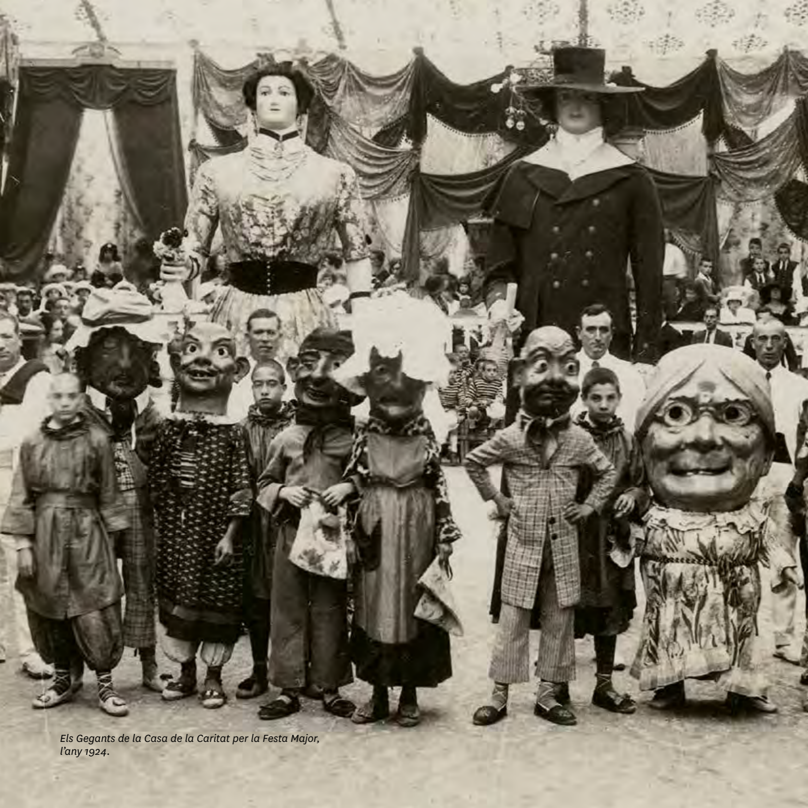
Els Gegants de la Casa de la Caritat per la Festa Major, l'any 1924.