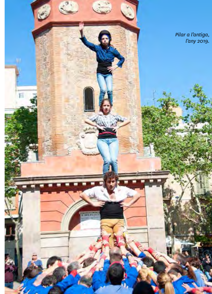
Pilar a l'antiga, l'any 2019.

Posteriorment, té lloc una cercavila amb les colles de cultura popular de Gràcia fins a la plaça de la Revolució, amb el recorregut següent: carrers del Penedès, de