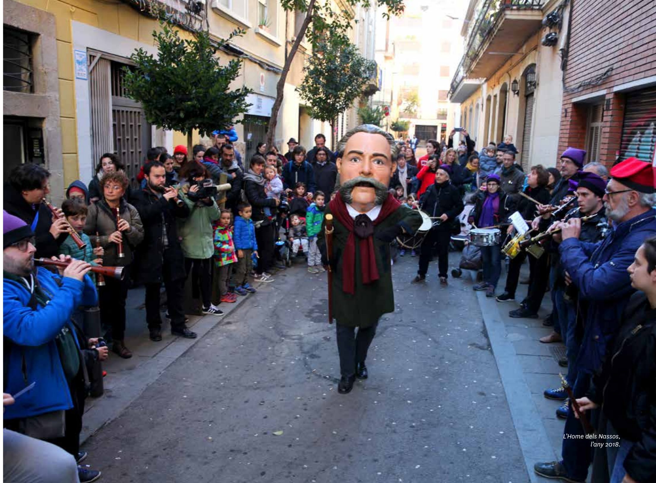
L'Home dels Nassos, l'any 2018.

El matí del 31 de desembre, l'Home dels Nassos surt del Centre de Cultura Popular La Violeta, acompanyat del seu seguici, dels portadors i dels músics, i enceta una cercavila pels principals carrers i places de la vila.