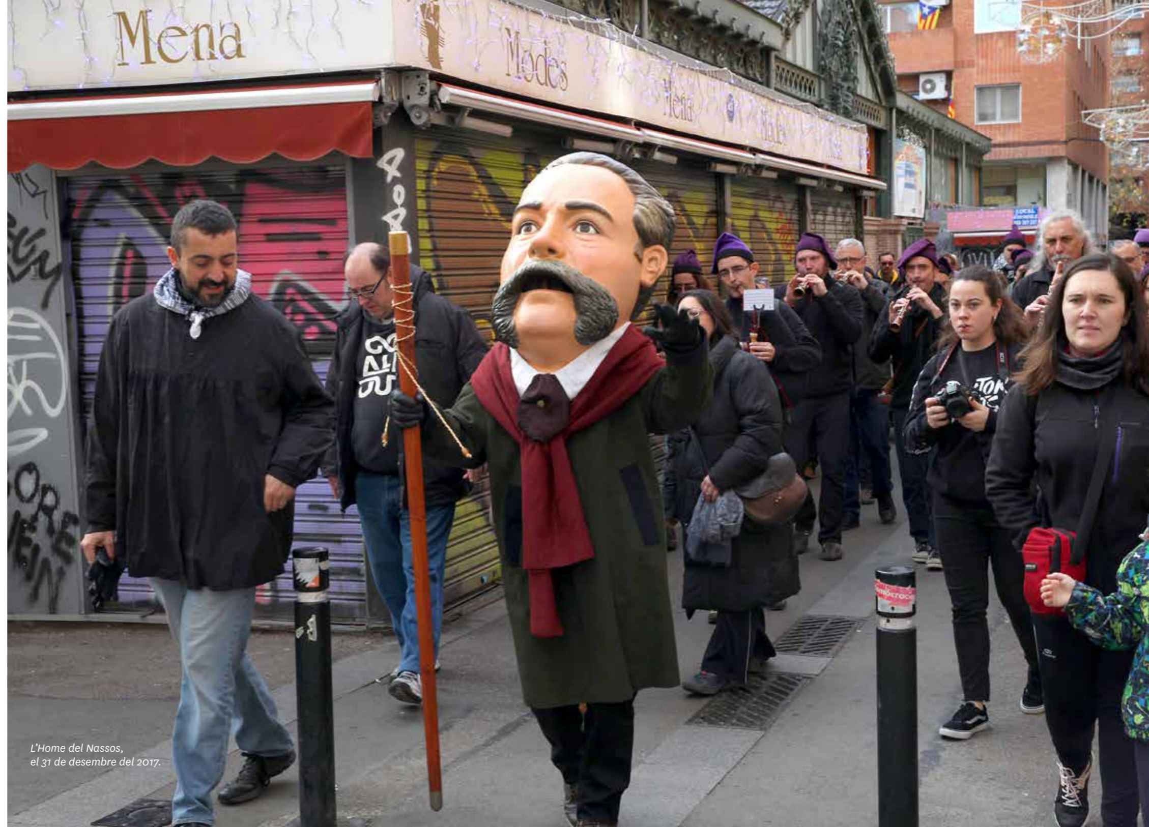
L'Home del Nassos, el 31 de desembre del 2017.

És un capgròs fet a imatge de qualsevol gracienc o gracienc, és un clar retrat de Francesc Derch Alió, líder de la Revolta de les Quintes de 1870, darrer alcalde de la Gràcia independent, el 1897.