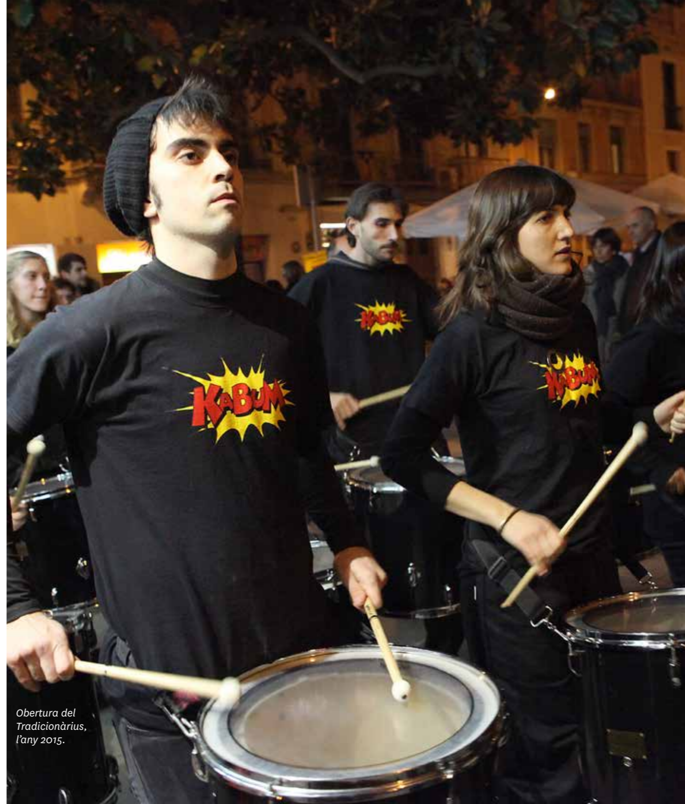
Obertura del Tradicionàrius, l'any 2015.

Actualment, des de l'any 2015, la part musical és a càrrec de Kabum i del Col·lectiu Guirigrall , grups residents al CAT, que inicien el Seguici a la plaça de la Vila de Gràcia amb el Toc d'atenció , que és interpretat per dos grallers des del balcó de l'Ajuntament. En arribar la comitiva a la plaça d'Anna Frank, abans de procedir a tallar la cinta inaugural, s'interpreta el tema Ball gemmat .