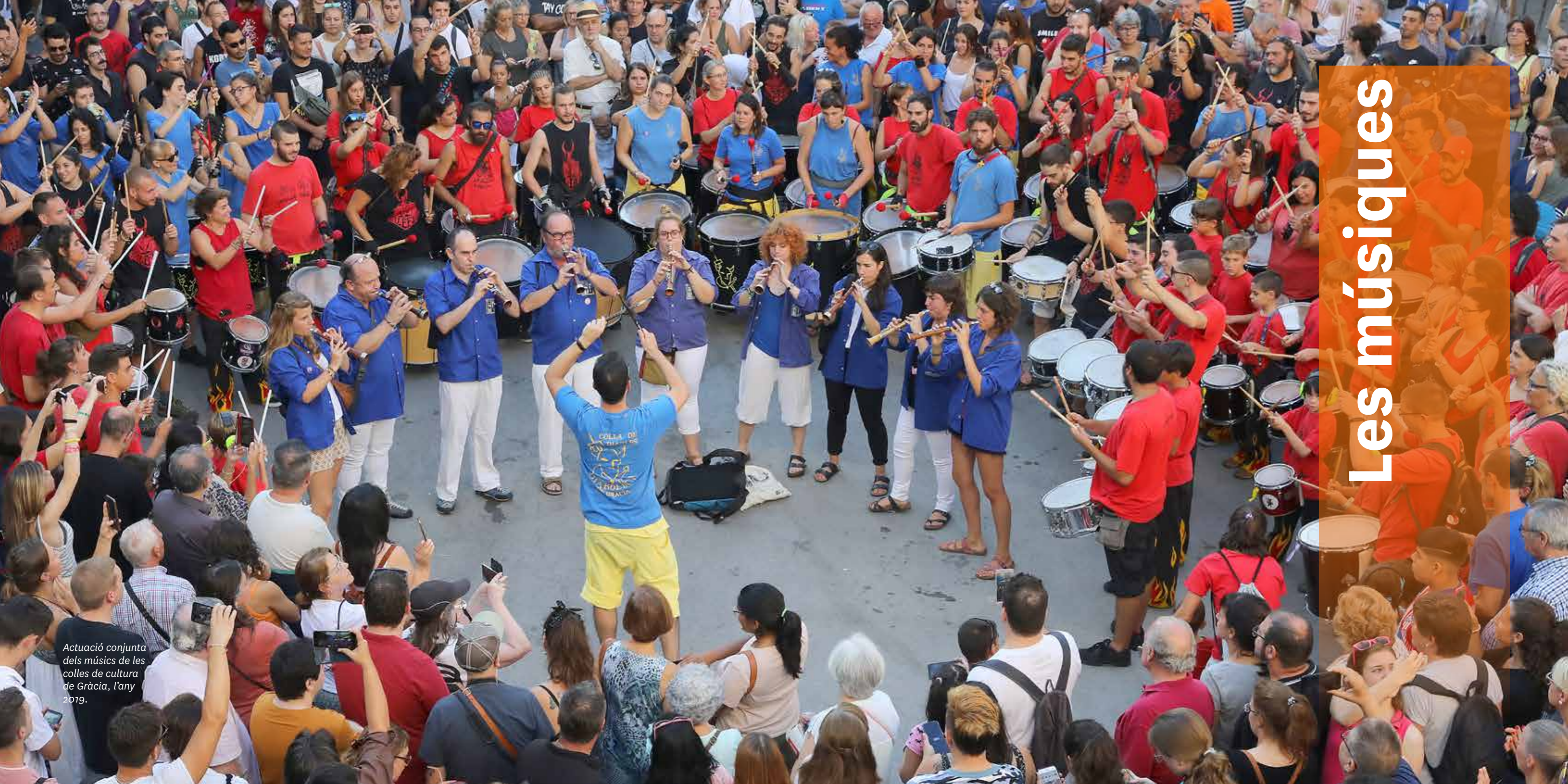
Actuació conjunta dels músics de les colles de cultura de Gràcia, l'any 2019.