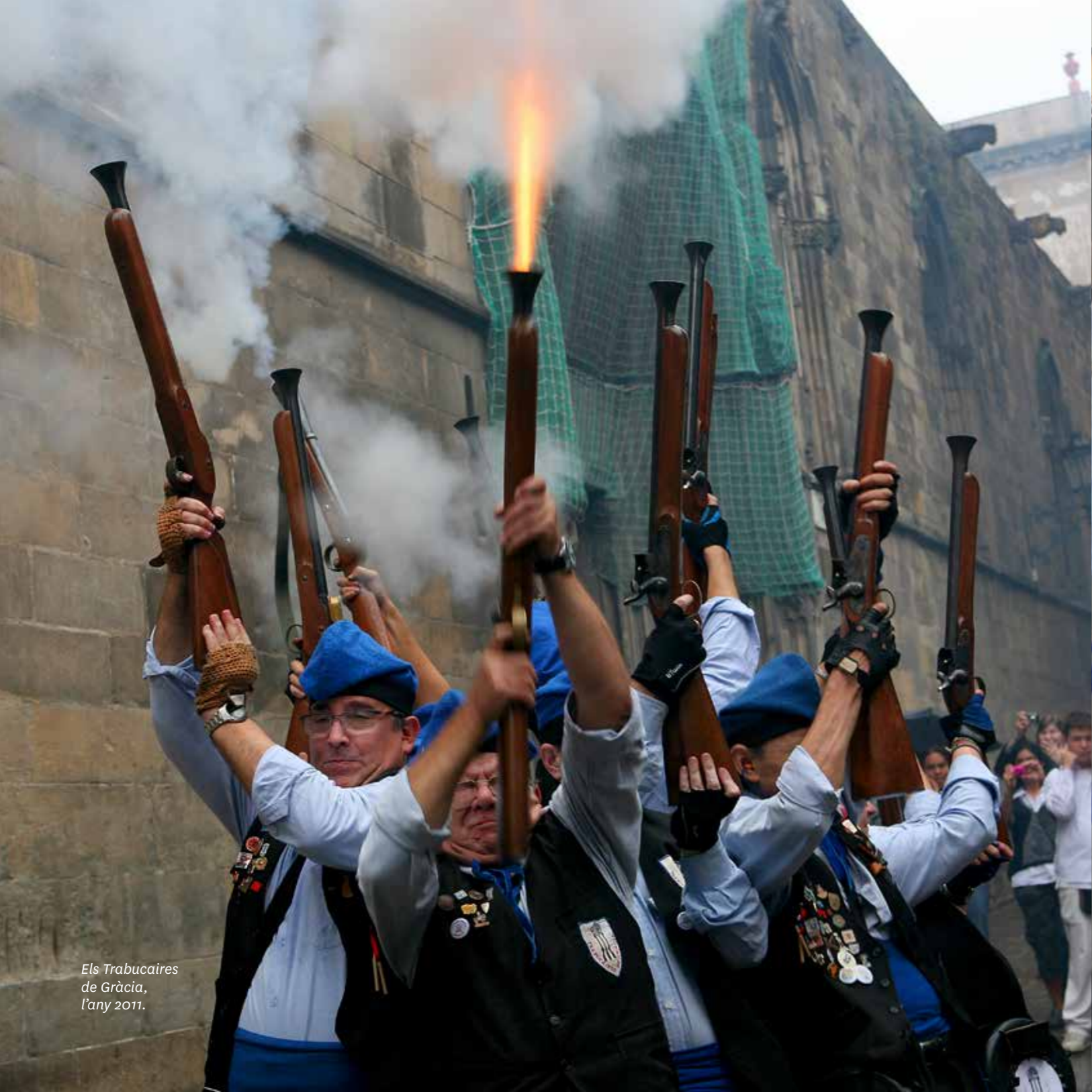
Els Trabucaires de Gràcia, l'any 2011.