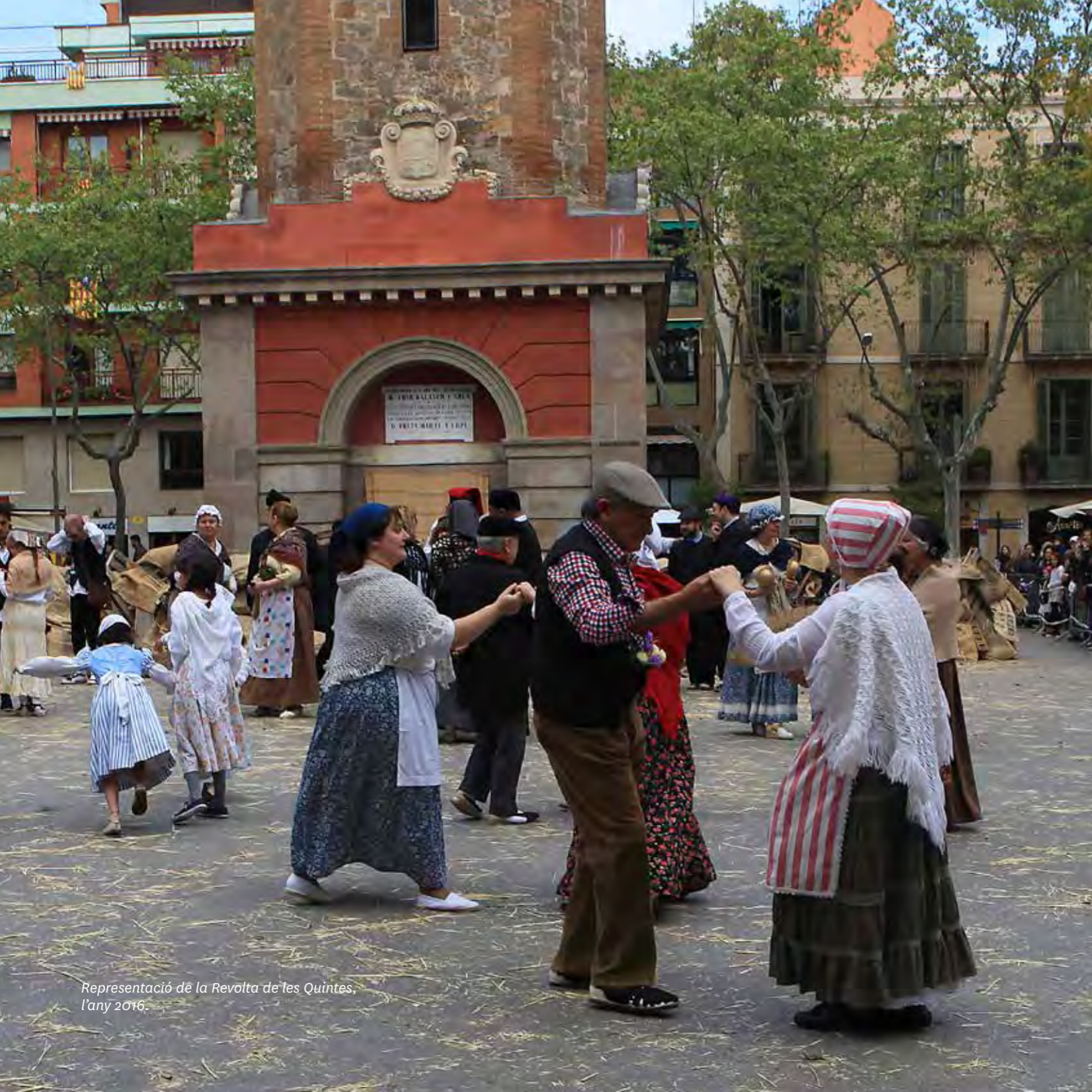
Representació de la Revolta de les Quintes, l'any 2016.