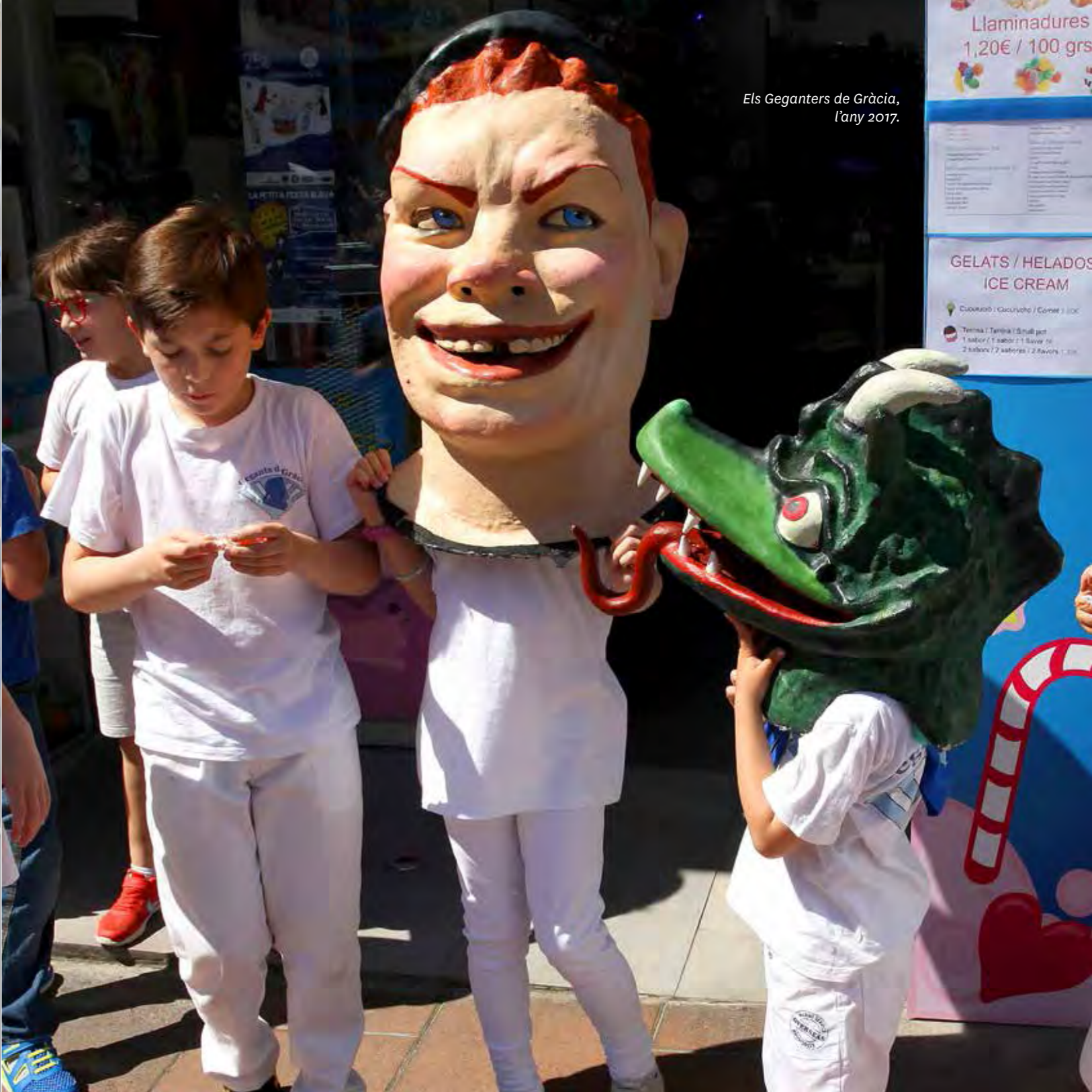
Els Geganters de Gràcia, l'any 2017.