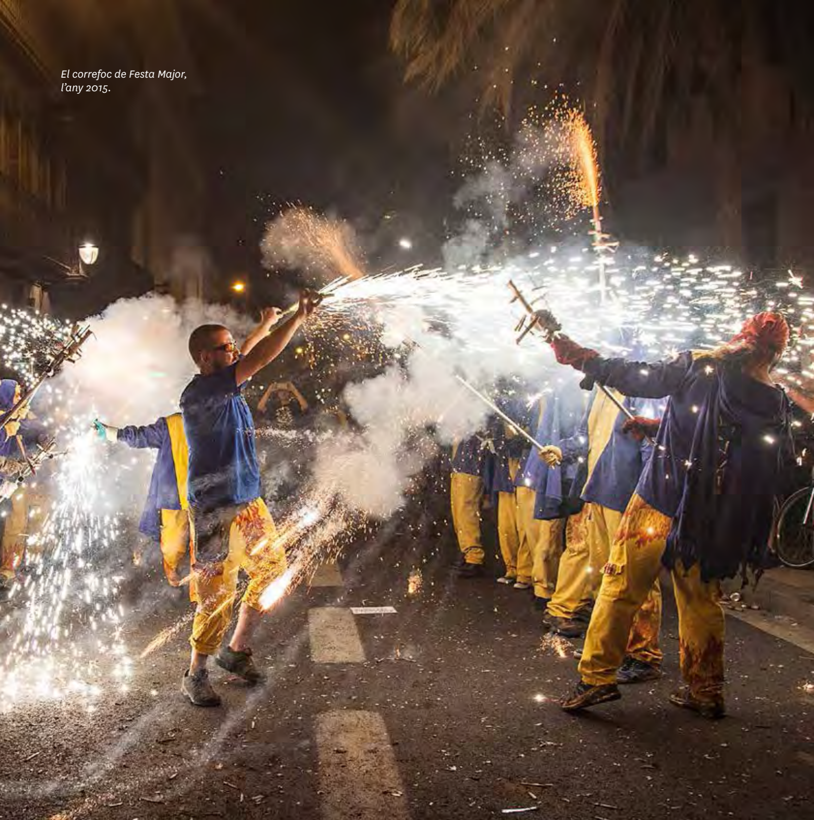
El correfoc de Festa Major, l'any 2015.