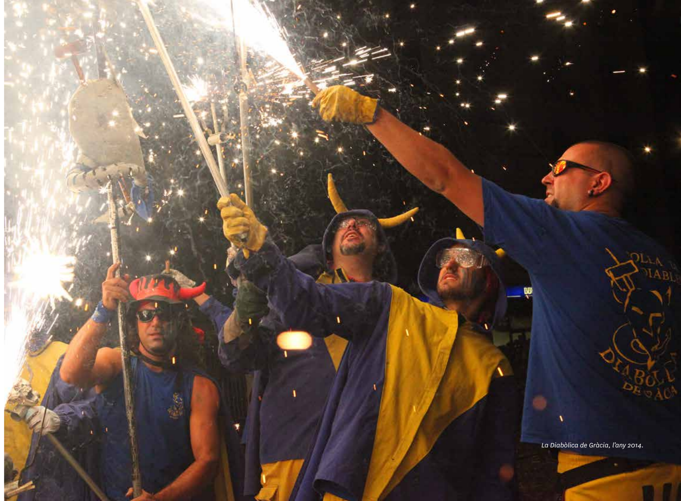
La Diabòlica de Gràcia, l'any 2014.

La secció de cremadors i cremadores disposa d'un estendard (amb l'opció de posar-hi fins a setze carretilles) i dues figures: en Llucifer i la Diablessa, cadascuna amb el seu propi ceptre. El ceptrot del Llucifer pot arribar a portar fins a cent vint carretilles o una combinació de sortidors i volcanets, i el de la Diablessa, fins a seixanta-vuit carretilles.