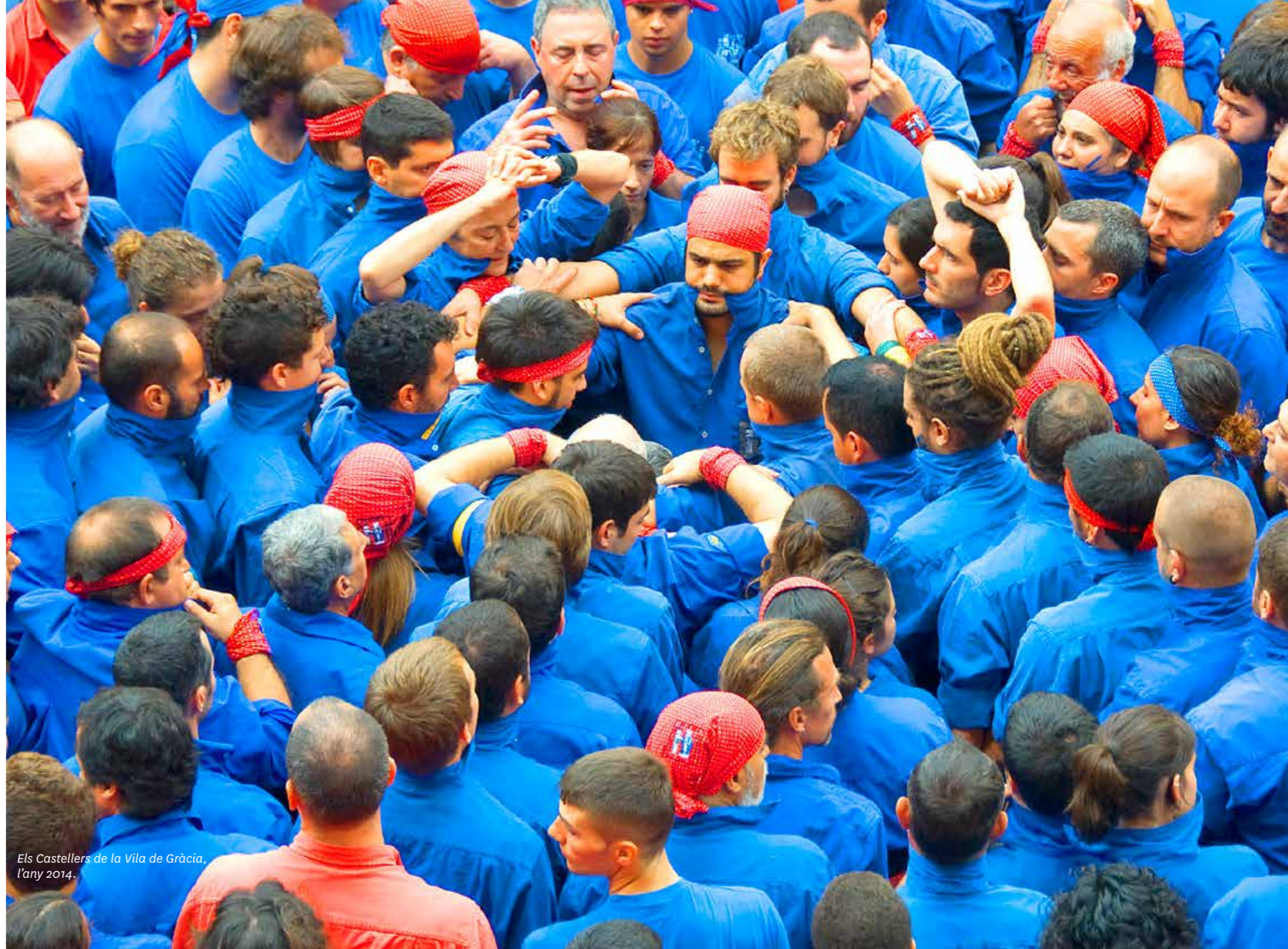
Els Castellers de la Vila de Gràcia, l'any 2014.

Els anys següents, la colla de Gràcia va anar evolucionant de manera positiva i es va consolidar com a colla de set, fins que el 6 d'octubre del 2002, amb motiu del XIX Concurs de Castells de Tarragona, van carregar el primer quatre de vuit de la seva història.