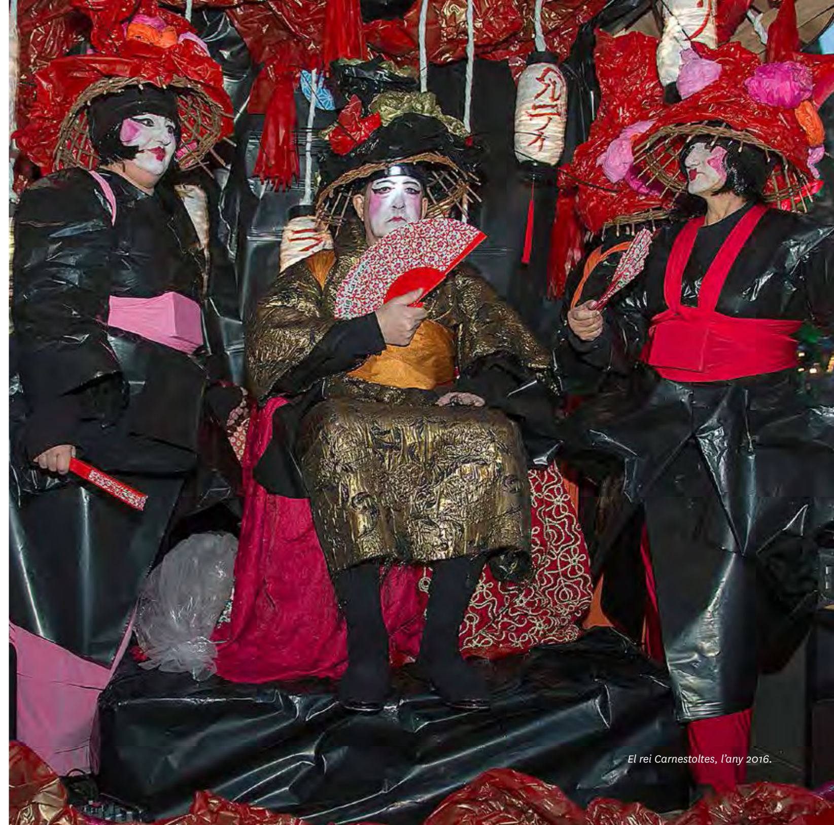
El rei Carnestoltes, l'any 2016.

Carnestoltes. Un cop a la plaça de la Vila, des del balcó de la seu del Districte, el rei Carnestoltes llegeix el ban i es lliuren premis a les millors comparses, carrosses i disfresses de la rua.