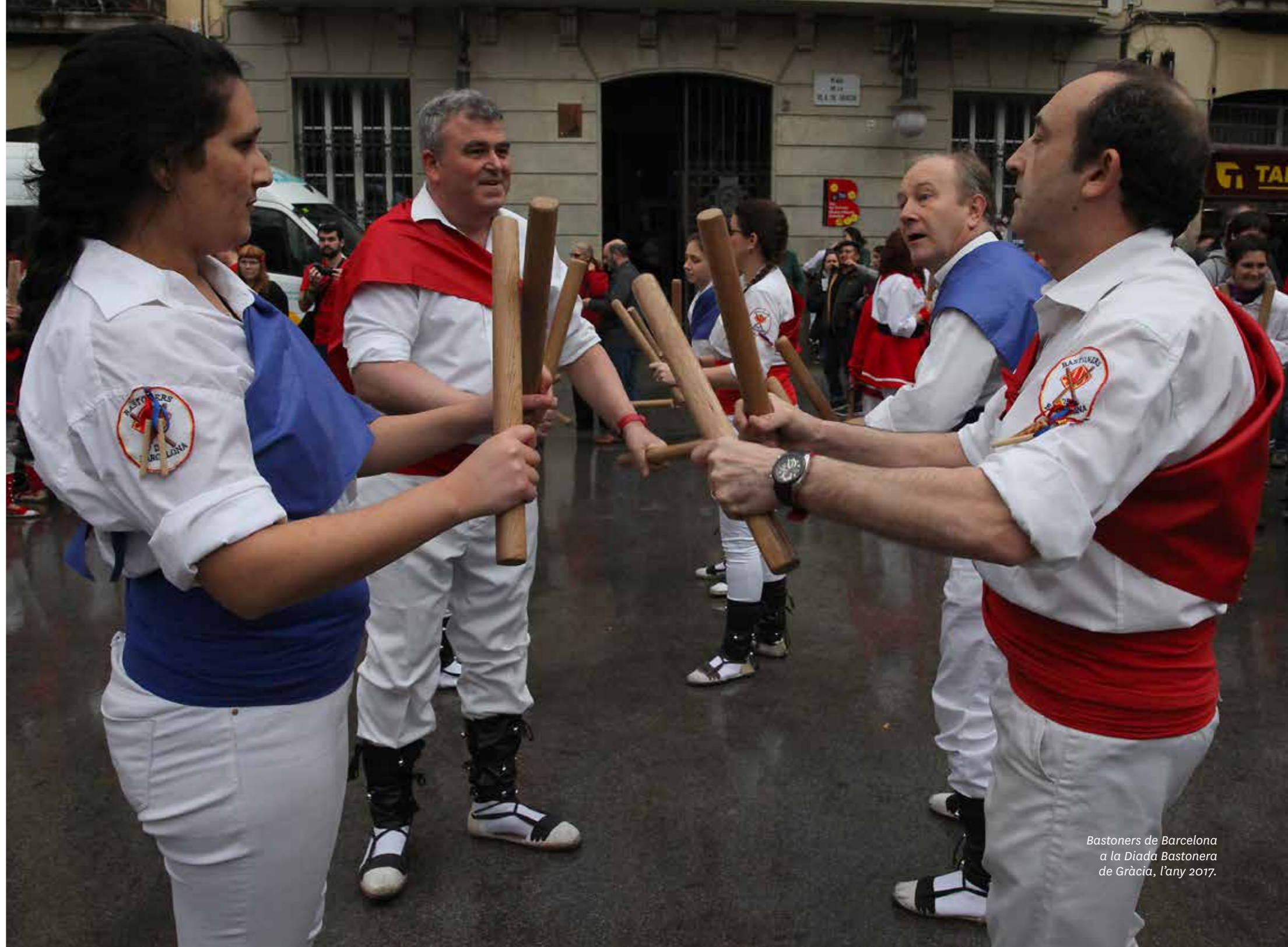
Bastoners de Barcelona a la Diada Bastonera de Gràcia, l'any 2017.

A la Diada Bastonera es conviden colles bastoneres d'altres poblacions de Catalunya. L'estructura de la jornada comprèn una cercavila pels principals carrers i places de la vila. La colla organitzadora va al final de la cercavila i la no organitzadora, al començament.