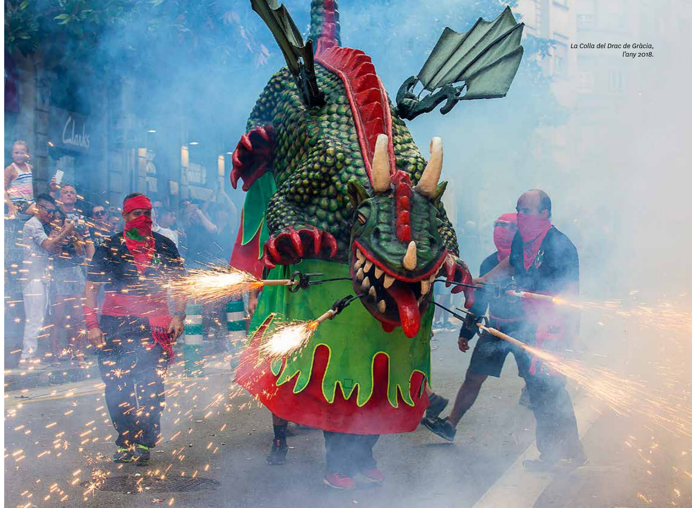
La Colla del Drac de Gràcia, l'any 2018.

Les seves actuacions són les que marca el calendari festiu de la vila de Gràcia i de la ciutat de Barcelona, però també va a qualsevol altre indret on sigui convidat.