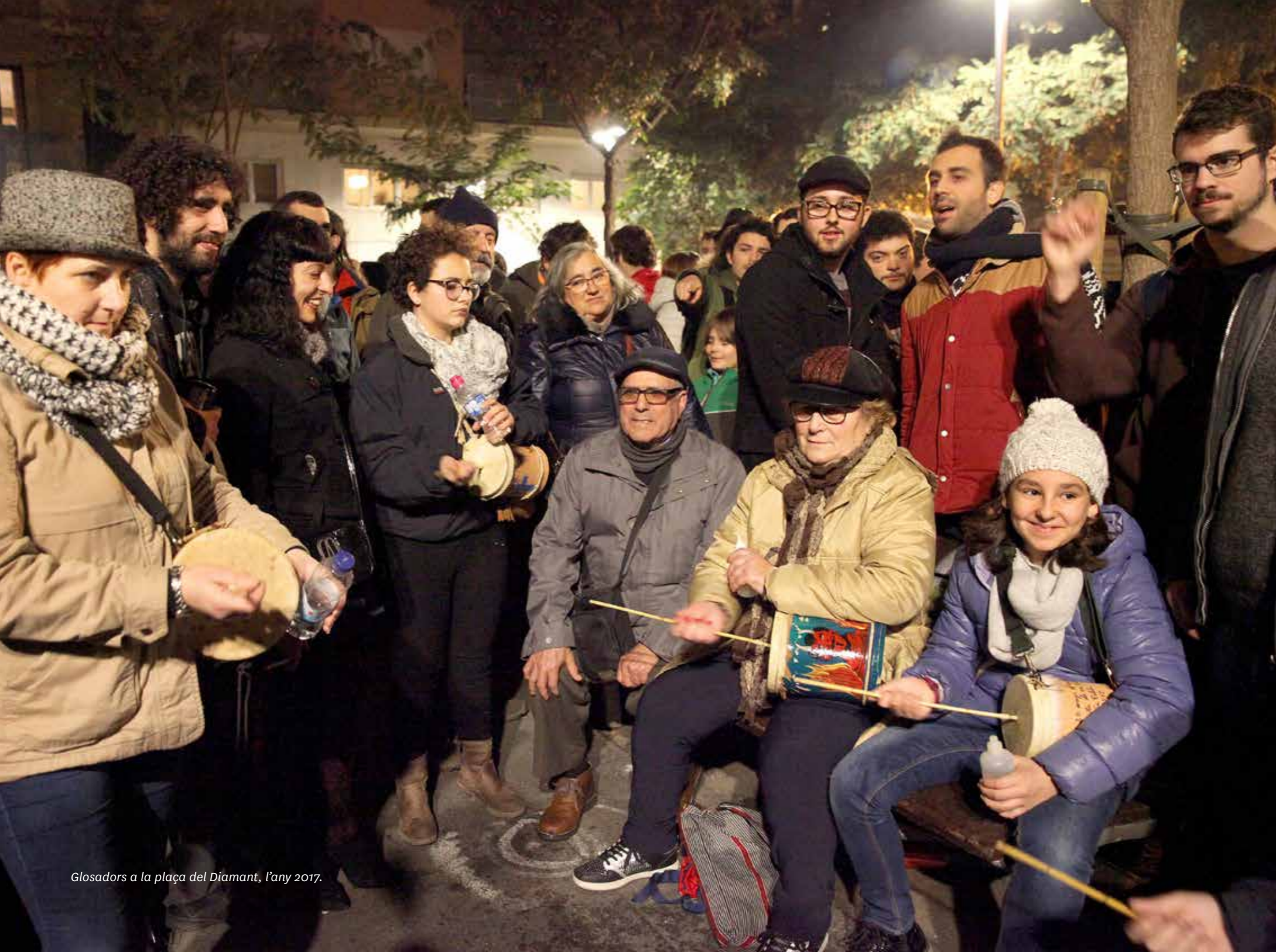
Glosadors a la plaça del Diamant, l'any 2017.