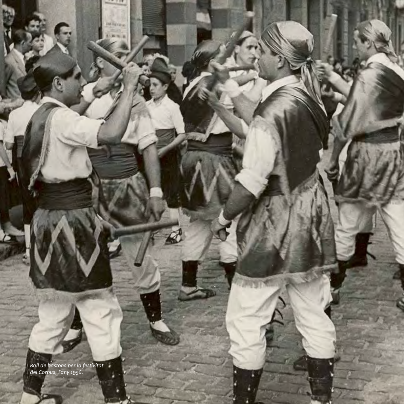
Ball de bastons per la festivitat del Corpus, l'any 1956.