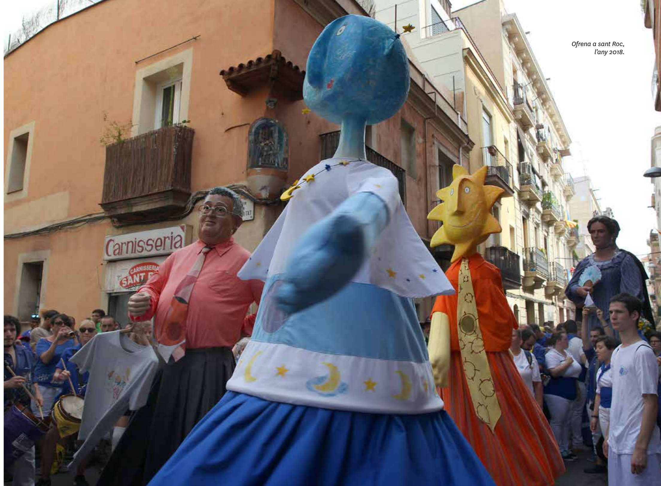
Ofrena a sant Roc, l'any 2018.

A la capella de Sant Roc, situada a la cruïlla dels carrers de la Fraternitat i de la Llibertat, tenen lloc un seguit d'actuacions en l'ordre següent: galejada dels Trabucaires de Gràcia, ballada dels Bastoners de Gràcia, actuació, si s'escau, d'altres colles, ball dels Gegants de Gràcia, ball dels Gegantons Torradet i Gresca, i del Gegantó Torres de la Fundació Festa Major de Gràcia, ball de l'Àliga i un pilar aixecat pels Castellers de la Vila de Gràcia, en el qual l'inxaneta fa l'ofrena floral al sant.